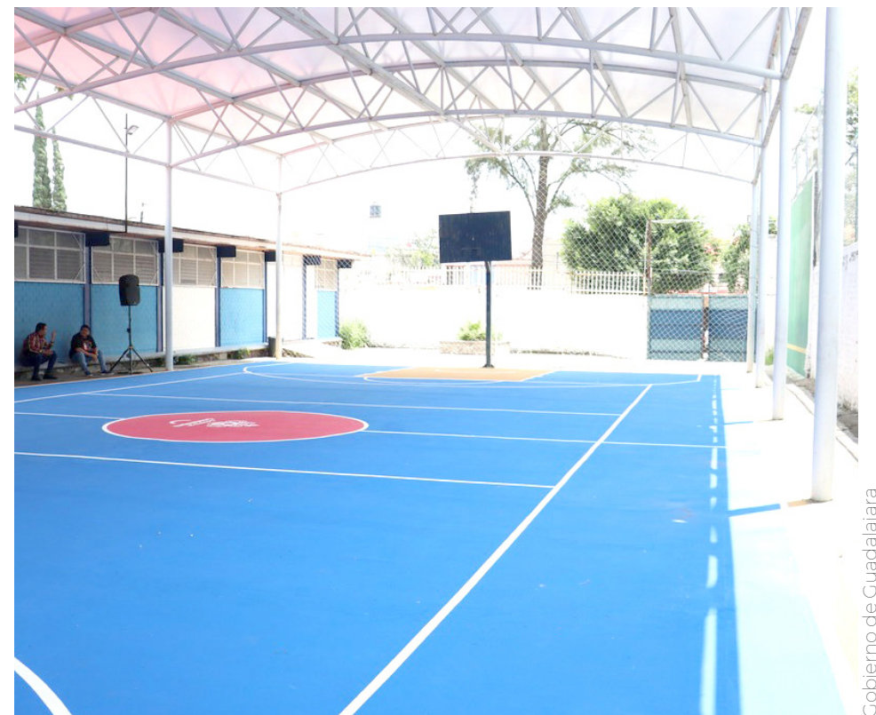
Gobierno de Guadalajara

“Hasta el último día de esta Administración vamos a trabajar de la misma manera, cuidando las escuelas, las calles, los servicios públicos. Siempre que podamos hacer algo por nuestra ciudad, va a ser el mejor legado que le vamos a dejar, no