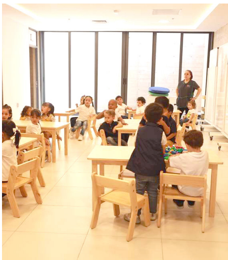
Gobierno de Zapopan