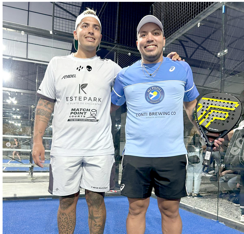
Tolito y Tolo ven el deporte como un espacio familiar.

“La gente aporta muchísimo al pádel, creo que es un deporte muy familiar y ha crecido muchísimo”