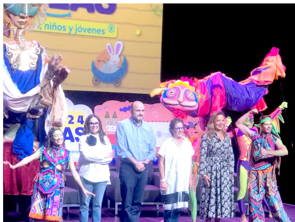
Este año habrá un ciclo de cine y un programa exclusivo para bebés.

Del 2 al 6 de octubre en el Pabellón Cultural Universitario y el Conjunto Santander será realizada la edición 29 del evento