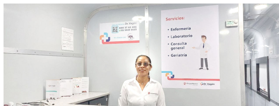
Este año se inauguró también el Vagón Quirófano.

“Hay dos factores principales, uno de ellos que no se hicieron los estudios, que cuando estuvieron regresando a hacer