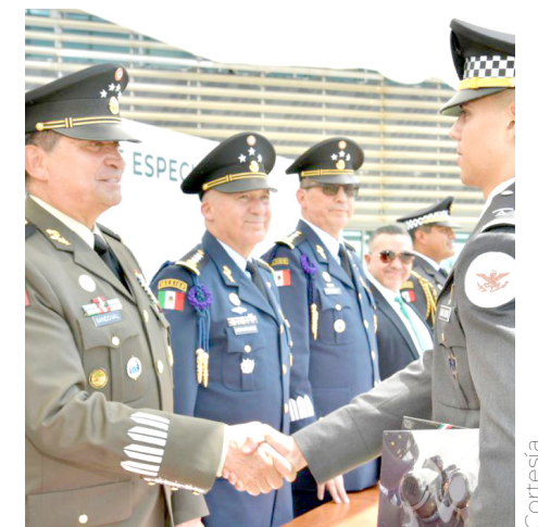
Los alumnos duraron 4 años en formación académica.

Además, detallan que el programa de formación de los primeros pilotos aviadores con licenciatura en Seguridad Pública contempló el fortalecimiento de sus cualidades de mando y liderazgo, empleo de aeronaves y trabajo permanente en talleres, laboratorios y simuladores de vuelo, además de entrenamiento en el control de tránsito aéreo, entre otras materias.