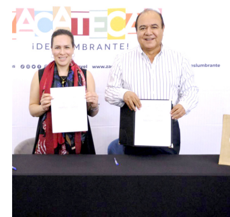
Además de ser estados vecinos y formar parte de la región Centro-Occidente del país.

Jalisco y Zacatecas, además de ser estados vecinos y formar parte de la región Centro-Occidente del país, con el Pacto Centro Occidente por el Turismo realizan acciones de promoción conjunta para reactivar el turismo en esta región del país tras la pandemia.