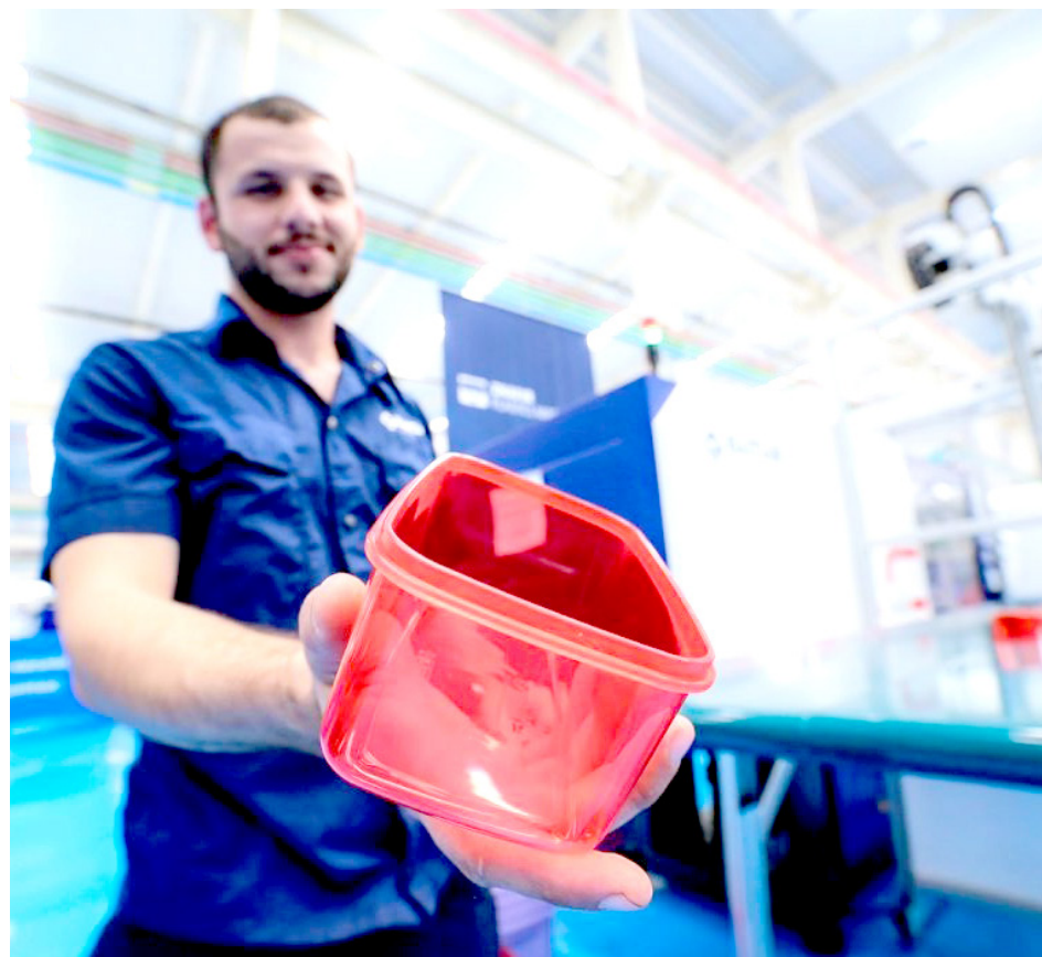
La FIIE es una de las iniciativas con visión internacional más importantes en México.

Se busca inspirar y respaldar al emprendimiento así como en apoyar e impulsar la creación y consolidación de las micro, pequeñas y medianas empresas