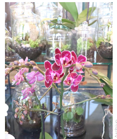
Una de las sedes será el Parque Agua Azul.