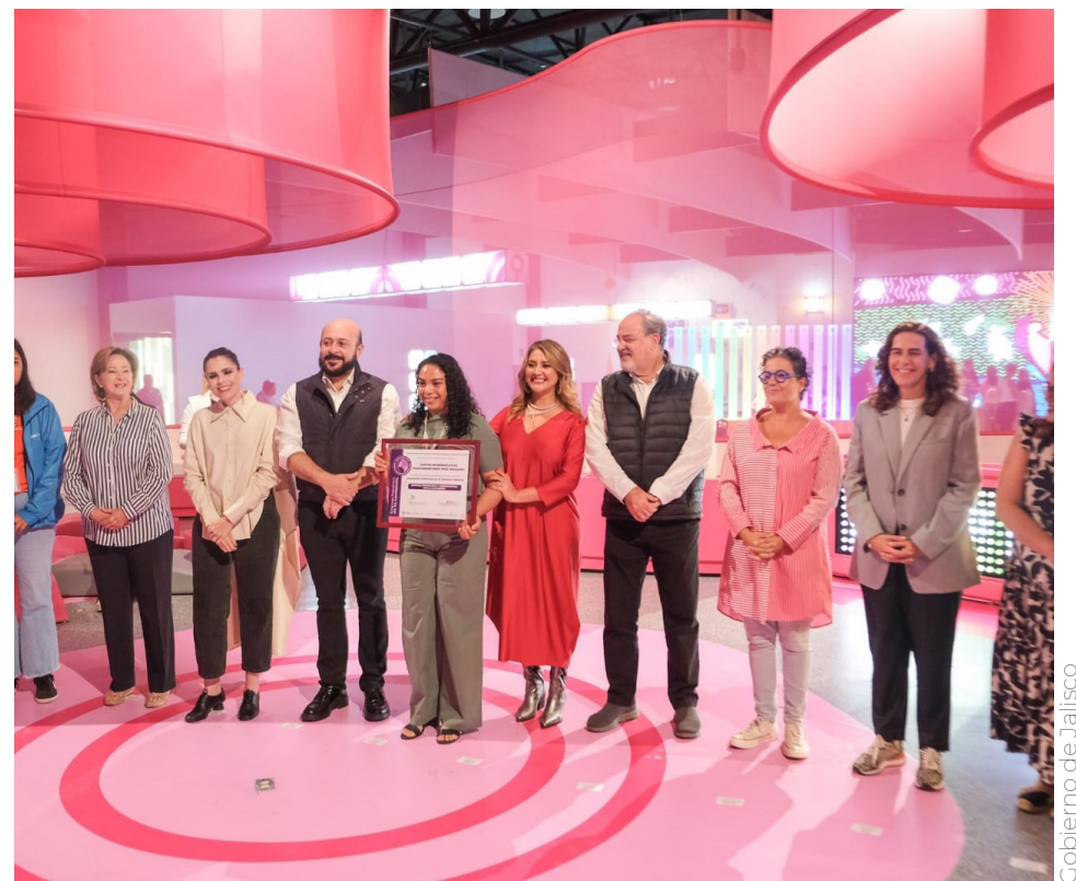
Gobierno de Jalisco

Los distintivos corresponden a la categoría de “Empresa promotora y comprometida con la lactancia” en la que el centro de trabajo, además de promover y fomentarla, cuenta con una sala especial en la que hay un refrigerador para conservar la leche materna.