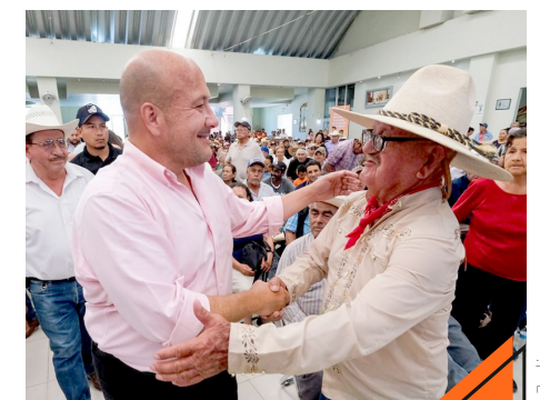
En este 2024 esta región ha recibido 130.7 millones entre más de ocho mil proyectos.

“Hoy puedo regresar con la tranquilidad del deber cumplido. Faltan cosas por hacer pues claro, no estaba fácil el poder atender un estado que