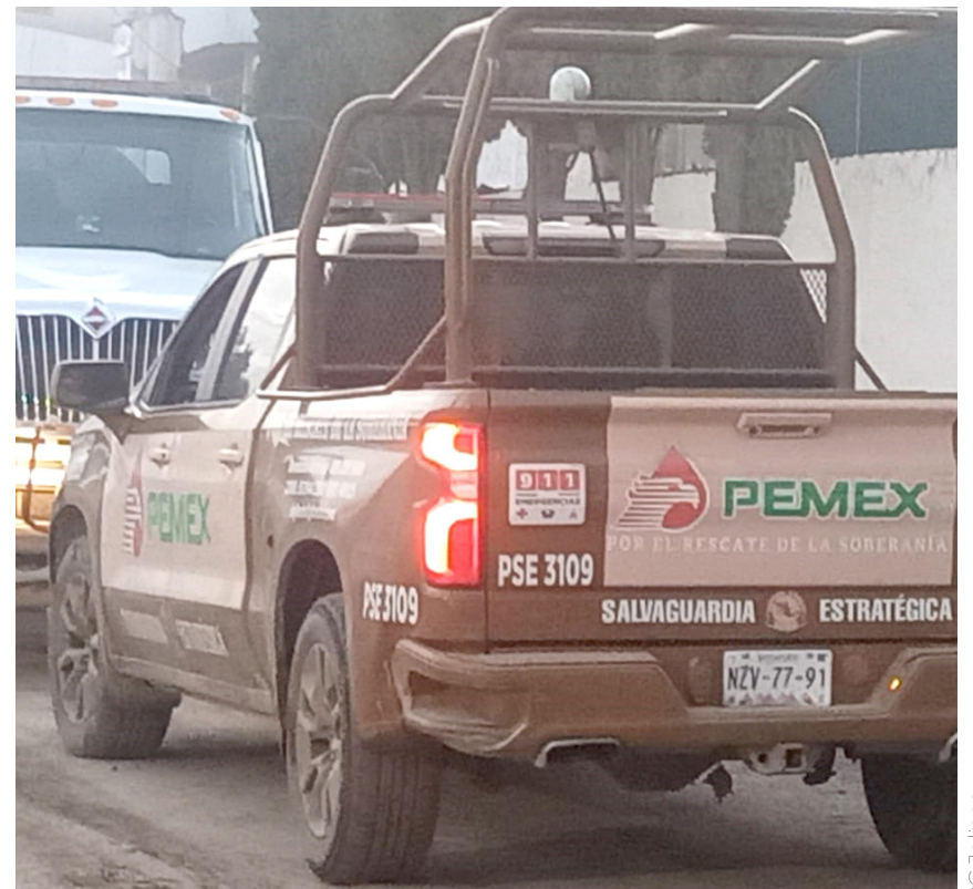
Se realizó un operativo coordinado entre tres órdenes de Gobierno.