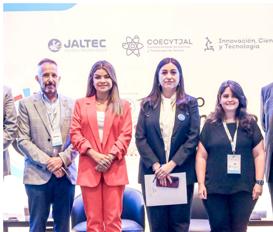
El evento fue organizado por la Secretaría de Innovación, Ciencia y Tecnología.

“Todo el ecosistema de ciencia y tecnología, muy señaladamente los científicos que están en centros de investigación, en universidades o los ingenieros que están desarrollando tecnología en empresas realmente reconozcamos los logros que han tenido, todo eso contribuye a que Jalisco sea más competitivo y a que avancemos a una economía del conocimiento (...) una economía que Jalisco tiene todo el derecho a aspirar, a tener y que lo hemos ido construyendo, en este foro se van a presentar algunos de los casos más notables de cómo hemos podido lograr que toda la inversión pública que hacemos en proyectos de ciencia o tecnología buscan tener un beneficio para la comunidad en diferentes formas”, comentó.