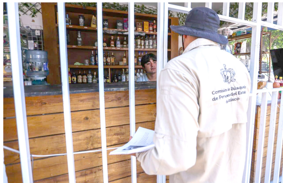
La Central Camionera es un lugar por el que transitan diariamente cientos de camiones.

Cabe señalar que la Central Camionera es un lugar por el que transitan diariamente cientos de camiones y transporte foráneo, siendo este punto únicamente una referencia para los familiares en donde tuvieron el último contacto con sus conocidos. No significa