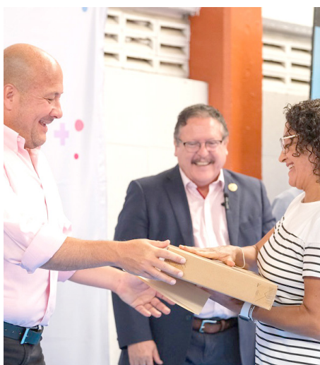
Gobierno de Jalisco

La campaña se reforzará con los Operativos Baja la Velocidad que estarán a cargo de agentes de la Dirección de Movilidad y Transporte con el apoyo de la Comisaría Guadalajara, los puestos de control harán mediciones de velocidad con un equipo TruCam II LTI 20/20, entre sus características destacan: imagen y video de alta resolución, Información encriptada y segura, visión nocturna y capacidad de impresión inalámbrica.