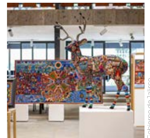
Las piezas están expuestas en la Casa de las Artesanías del Estado.

La Casa de las Artesanías se ubica en: Calz. Jesús González Gallo 20, El Rosario en Guadalajara, con un horario de horario de 9 a 17 horas.