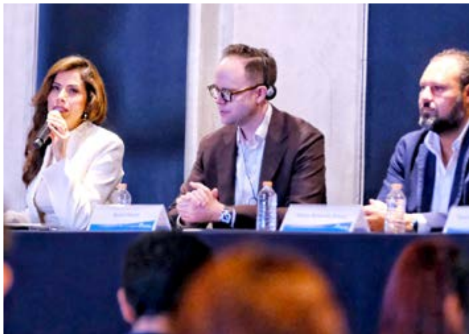
El foro reunió a participantes de 40 municipios del país.

Cabe destacar que el Foro Red de Ciudades del Futuro de Visor Urbano