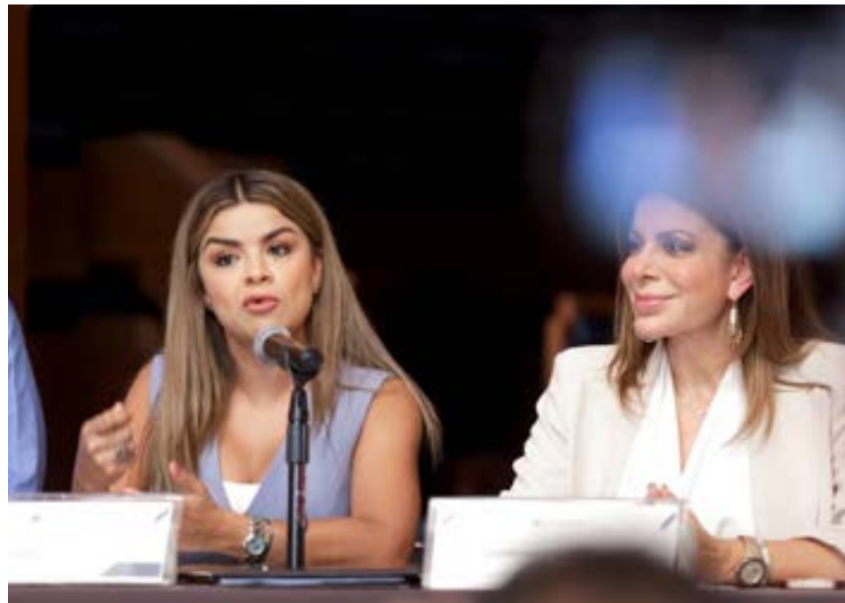
Las diputadas presentaron la iniciativa de ley en el Congreso local.

El propósito final es mantener en la economía el valor y vida útil de los materiales y recursos asociados a ellos