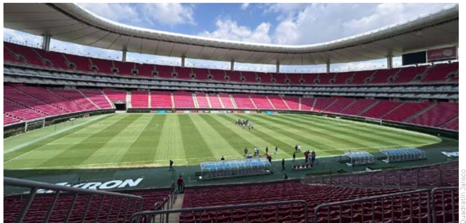
La Selección Mexicana pisará la cancha del Estadio Akron.

Al ser país anfitrión de la Copa del Mundo de 2026, México no juega eliminatorias, lo que le complica seriamente el conseguir rivales importantes para jugar amistosos en Fecha FIFA, pues todas las selecciones del mundo están disputando un boleto para el Mundial. Así, es probable que enfrente a varios clubes durante su preparación.