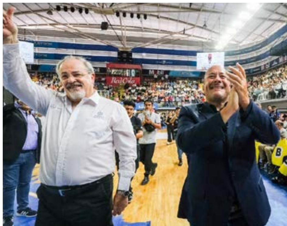
Gobierno de Jalisco

El gobernador, Enrique Alfaro, realizó la entrega de las últimas 502 basificaciones para trabajadores, cumpliendo con el OPD