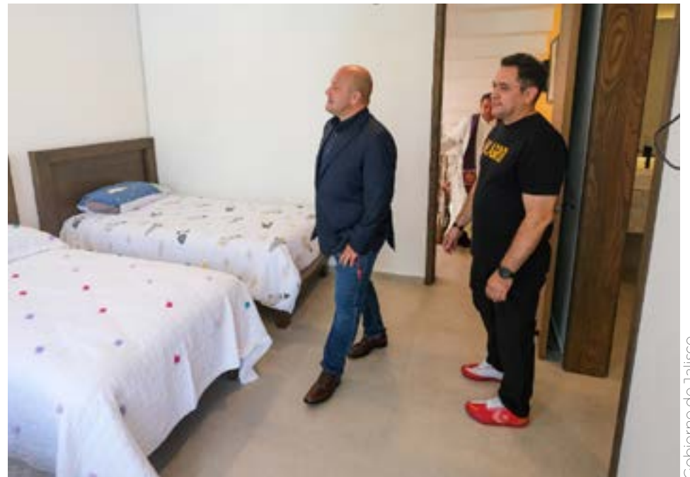
Gobierno de Jalisco

Y es que no existe justificación a lo que hizo el gobierno federal durante la presente administración de abandonar a las niñas y niños con Cáncer bajo el pretexto de la corrupción, así lo expresó el gobernador de Jalisco, Enrique Alfaro al inaugurar el tercer albergue de