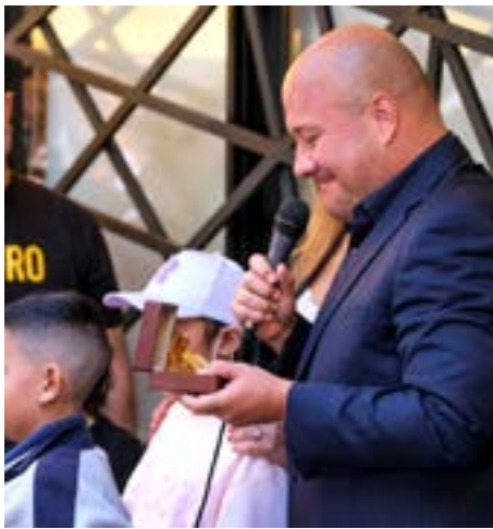
Gobierno de Jalisco

El mandatario estatal buscará mostrarle los avances del proyecto.