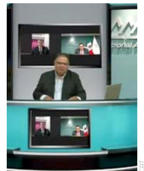
El tequila en el Comercio Internacional informa sobre la industria.

Cabe señalar que El Tequila en el Comercio Internacional, además de brindar información, ha contribuido a fortalecer el prestigio del Tequila y a fomentar su consumo responsable.