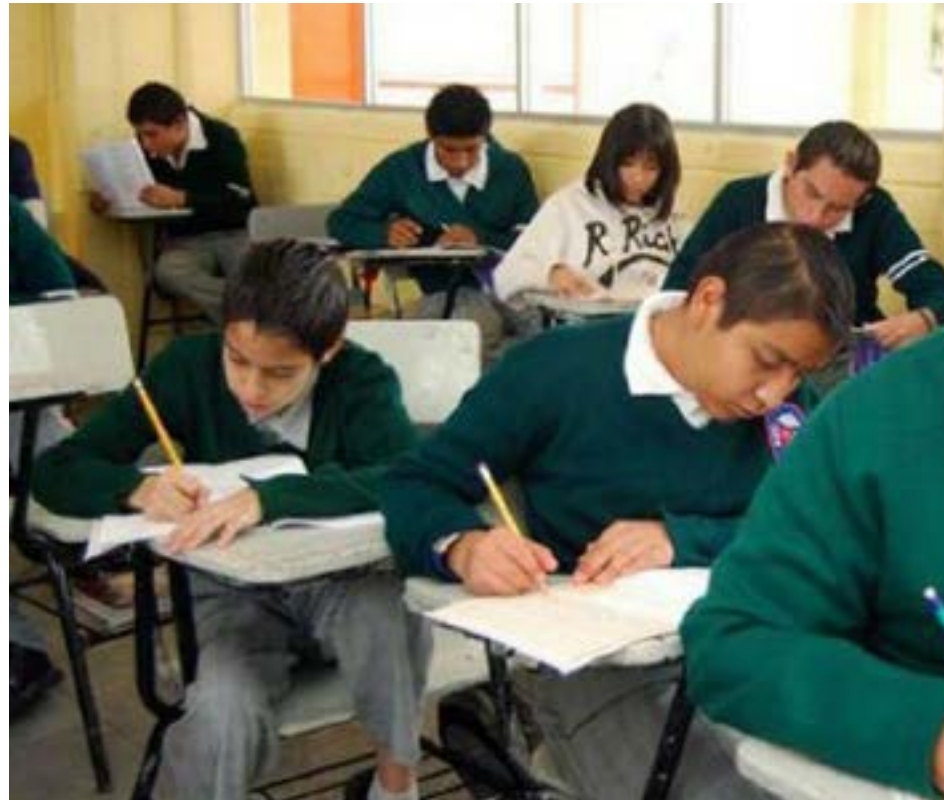
El arranque oficial con las autoridades este año será en la Escuela Secundaria Mixta número 18.

que nada sustituye al aula, al maestro y a la maestra, también la pandemia nos enseñó que si no somos capaces de usar la tecnología como una herramienta fundamental en el proceso de enseñanza y aprendizaje nos vamos a quedar rezagados respecto a lo que está pasando en otros lugares del mundo, por eso hoy este equipo que se les entrega es una herramienta para poder seguir construyendo ese modelo que pensamos, imaginamos, implementamos y diseñamos juntos”, indicó Alfaro Ramírez en una de las recientes entrega de computadoras en regiones del estado.