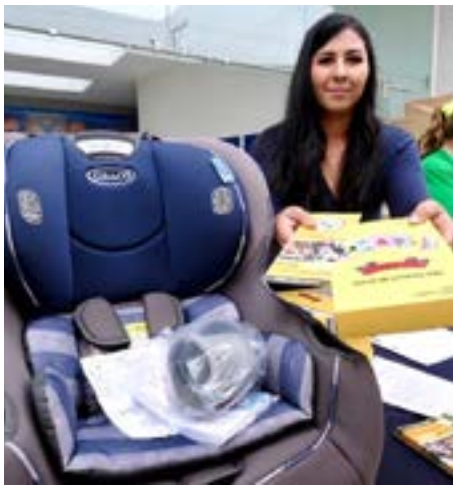
Gobierno de Jalisco

Los menores de 12 años deben ser transportados en estas sillas.