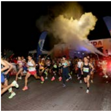
Gobierno de Guadalajara