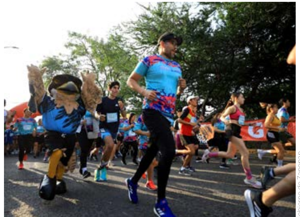
Gobierno de Zapopan

La marea azul tiñó parte de la avenida Patria, justo frente al Mercado Atemajac.