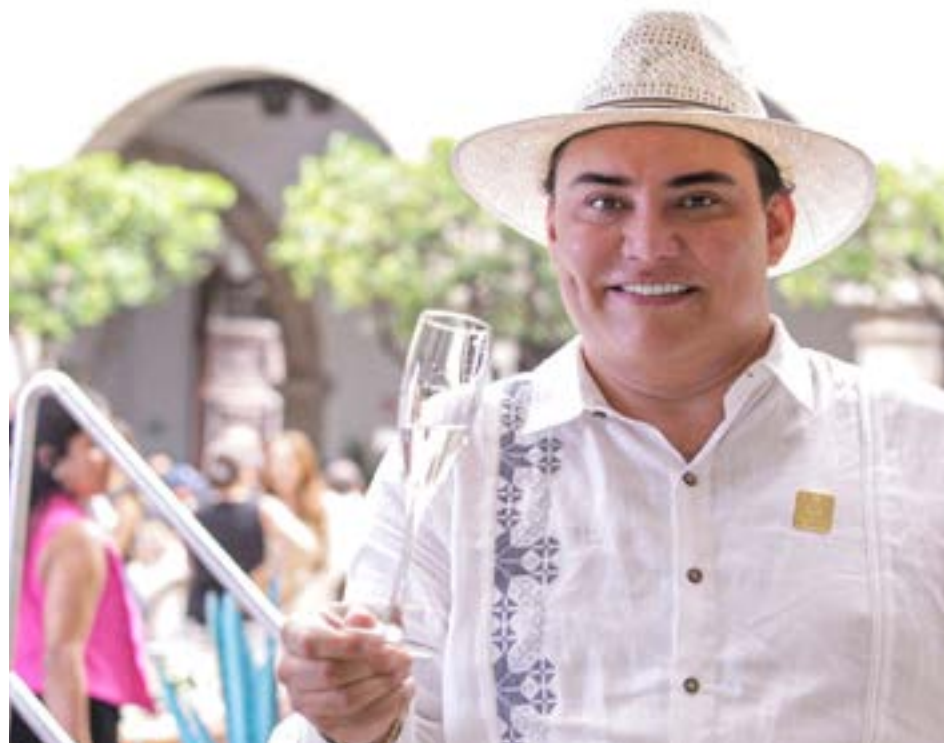
En 2023 se consumieron 2.2 millones de toneladas de agave, dijo el CEO del Castillo de Tequila.

La bebida nacional no solo es un ícono de mexicanidad, sino también un modelo de integración y compromiso con productores y consumidores