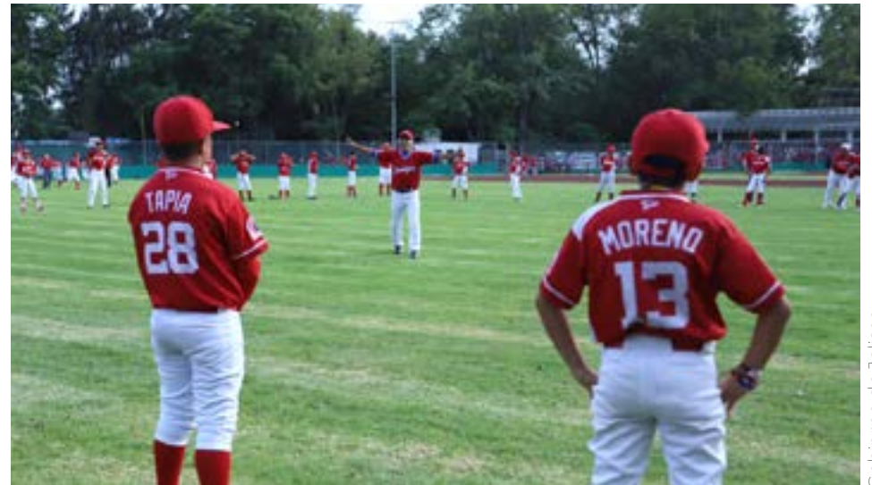
Gobierno de Jalisco

Sin embargo, de 2019 a la fecha, con las acciones emprendidas y una inversión de más de mil 600 millones de pesos, Alfaro cumplió su palabra, recuperó y transformó de fondo 401.69