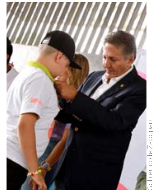
El programa es parte del compromiso con las infancias, dijo el primer edil.

Las presentaciones tienen más de 50 artistas en escena, música en vivo y las melodías más representativas del folclor mexicano.