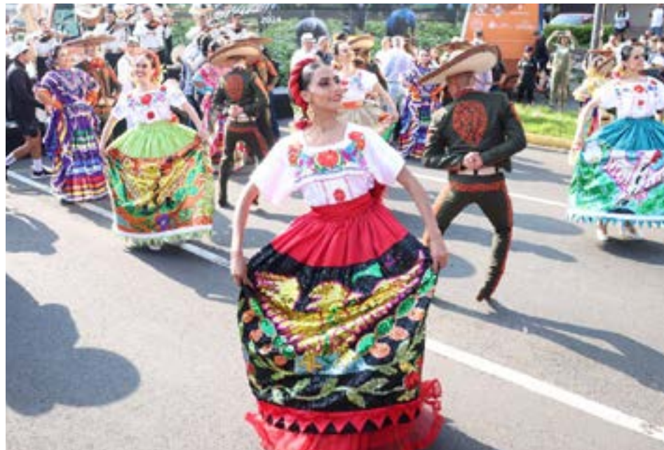
El banderazo de salida del evento se realizó en la glorieta La Minerva.

México en el Corazón comenzó en 2017, promovida por North American Institute for Mexican Advancement (NAIMA) —una organización conformada principalmente por empresarios—; el Gobierno de Guadalajara fue uno de los principales impulsores de este proyecto y su respaldo continúa en la actualidad.