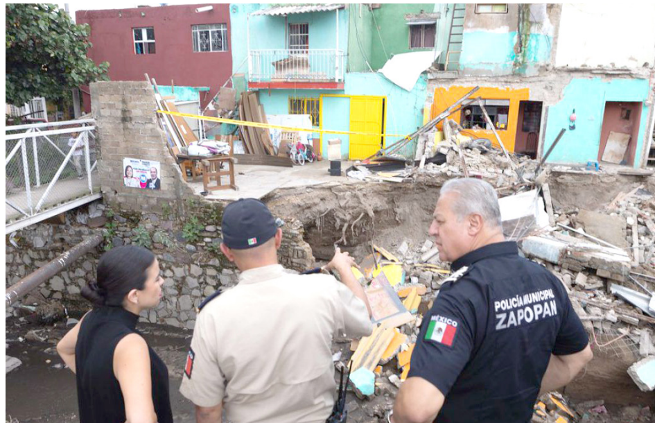
Las familias se niegan a retirarse de las zonas de peligro.

“Tenemos bien identificadas las viviendas instaladas en las orillas del cauce que es una zona federal, no deberían de estar instalados. El cálculo que nos da Protección Civil y Bomberos son alrededor de dos mil viviendas,