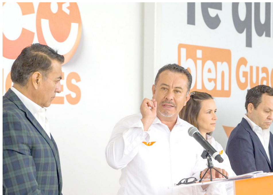
Los naranjas en Jalisco están seguros de su triunfo y piden respetar a los votantes.

En rueda de prensa, también hizo un llamado a Morena para que deje de mentir y engañar a la población, ya que las presuntas irregularidades que dicen se cometieron durante el proceso electoral son falsas como pretender anular tres mil 600 casillas, porque, dicen, tenían errores aritméticos, pero