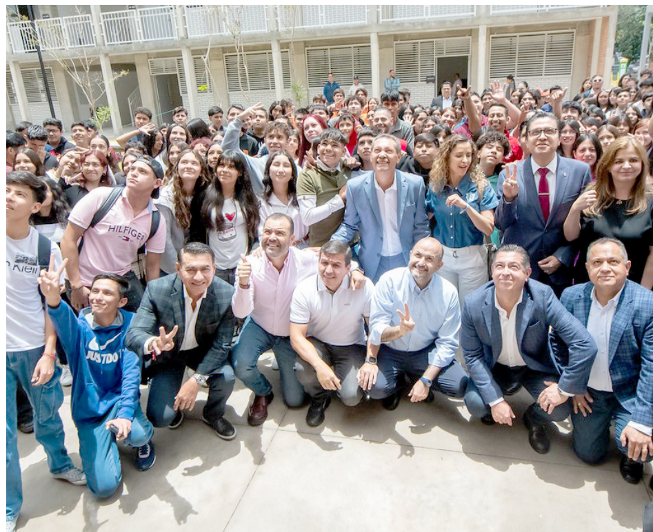
Acudieron a la inauguración funcionarios municipales, estatales y el rector de la UdeG.

El plantel tiene una inversión de 99.7 millones de pesos, y fue edificado en un predio de casi 30 mil metros cuadrados que el municipio donó a la UdeG