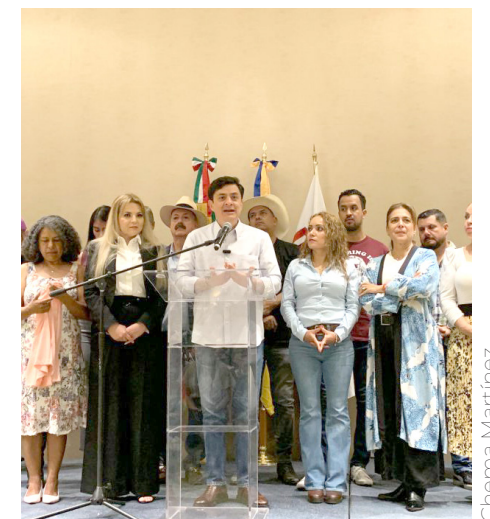
Acudirán a la sala superior del TEPJF.