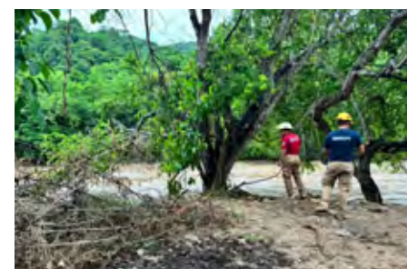
La Tormenta se encuentra aproximadamente a 490 km de las costas de Manzanillo.

Cabe mencionar que la Tormenta Tropical Carlota actualmente se localiza aproximadamente a 490 km