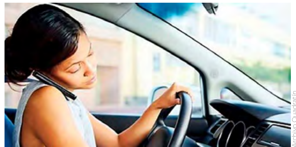
La Comisaría de Seguridad Vial lanzó la campaña Suelta el cel.

En ese sentido, del 1 de enero al 30 de junio del presente año, la Comisaría de