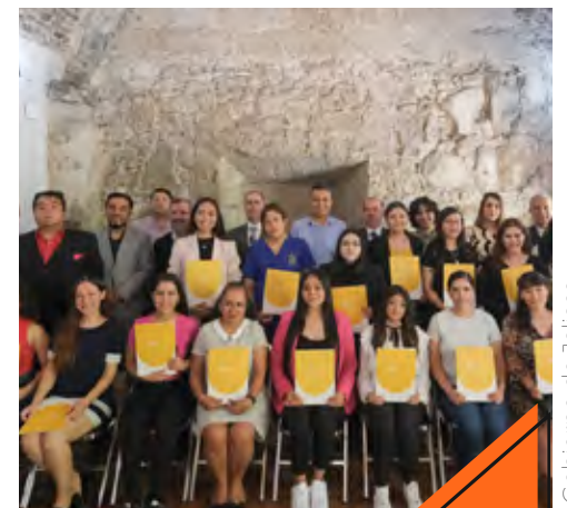
Tendrán descuentos para educación superior y posgrados.

Universidad Panamericana Universidad Autónoma de Guadalajara Universidad del Valle de Atemajac Universidad Antropológica de Guadalajara Universidad Virtual de Estudios Superiores Universitarios de Occidente Instituto Universitario Hispanoamericano Instituto Nórdico Universitario Colegio Libre de Estudios Universitarios Instituto del Pacífico