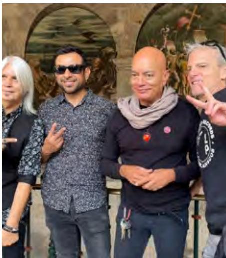
Gobierno de Guadalajara