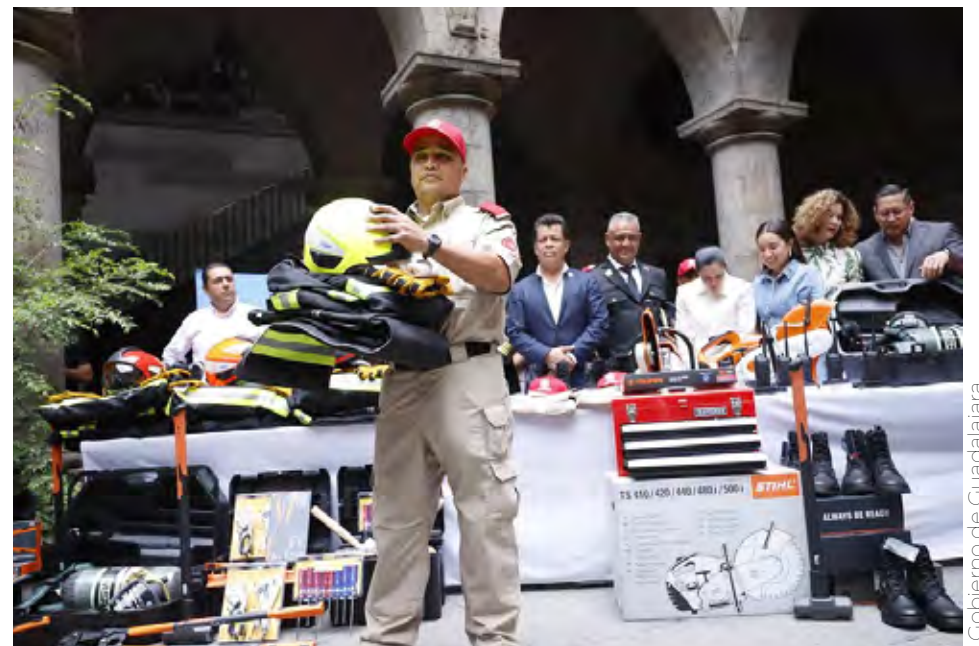
Gobierno de Guadalajara

En un momento muy emotivo, el alcalde interino pidió un minuto de aplausos en memoria de la Primer Oficial