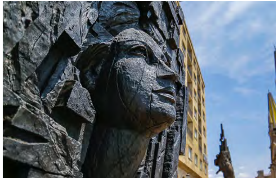
La derrama económica generada por el sector turístico ascendió a 37 mil 687 mdp durante el 2024

“Estos resultados son el reflejo del arduo trabajo que se ha realizado para la promoción de los destinos de Jalisco, por lo que ahora contamos con indicadores muy superiores a los