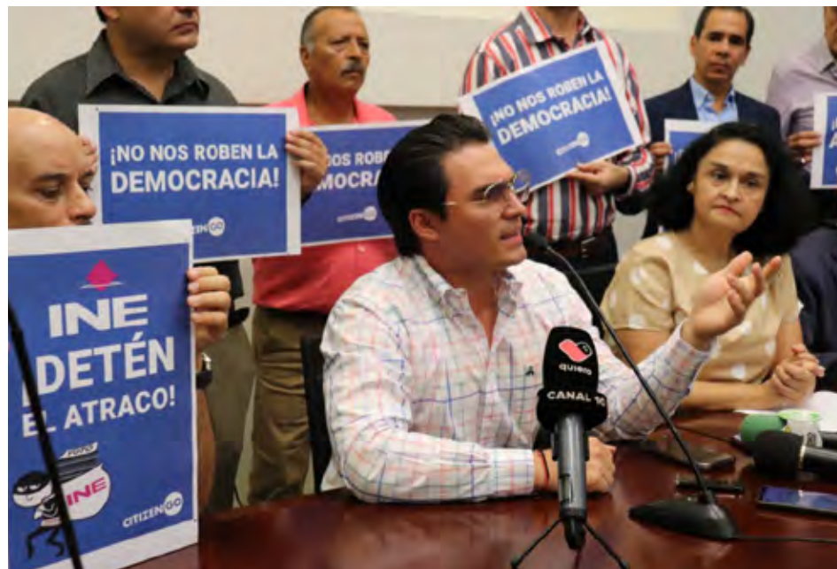
Calificaron como un atraco el hecho de que el partido guinda tenga más representantes.

Detalló que no es válido que con el 54 por ciento de los votos, el partido Movimiento de Regeneración Nacional y sus aliados pretendan el 75 por ciento de la representación en el Congreso de la Unión, tratando de obtener una mayoría que lo les corresponde y que no consiguieron