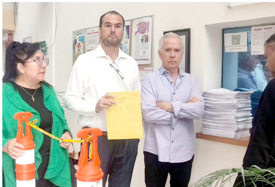
Buscan que se haga un reparto justo.

De manera física entregaron tres mil 486 firmas y 71 mil 782 digitales pidiendo el cumplimiento del artículo 54 de la Constitución Política de los Estados Unidos Mexicanos, pidiendo