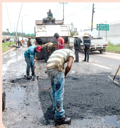
Gobierno de Tlajomulco

Las obras se realizan en coordinación con el Gobierno del Estado y hasta el momento se han invertido alrededor de 6 millones de pesos. Se trabaja las 24 horas de los siete días de la semana, con una fuerza laboral de hasta 30 personas y maquinaria que consta de equipo de succión de alta presión, equipo de video inspección, vactor, retroexcavadora, volteos, pipas y bombas.