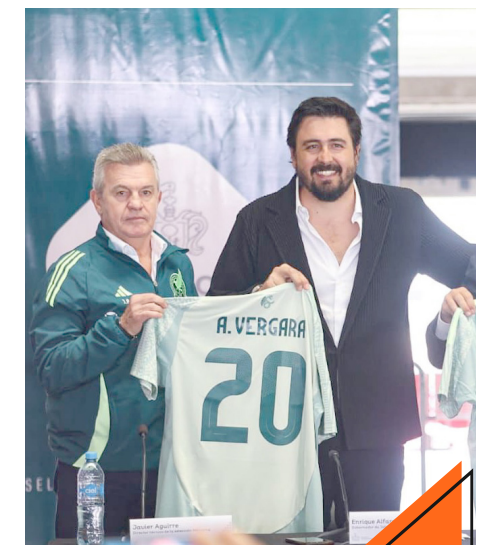
El duelo es resultado de las negociaciones del Gobierno con la FMF.

La venta para todo público arranca el 28 en la misma plataforma y en el inmueble de las Chivas.