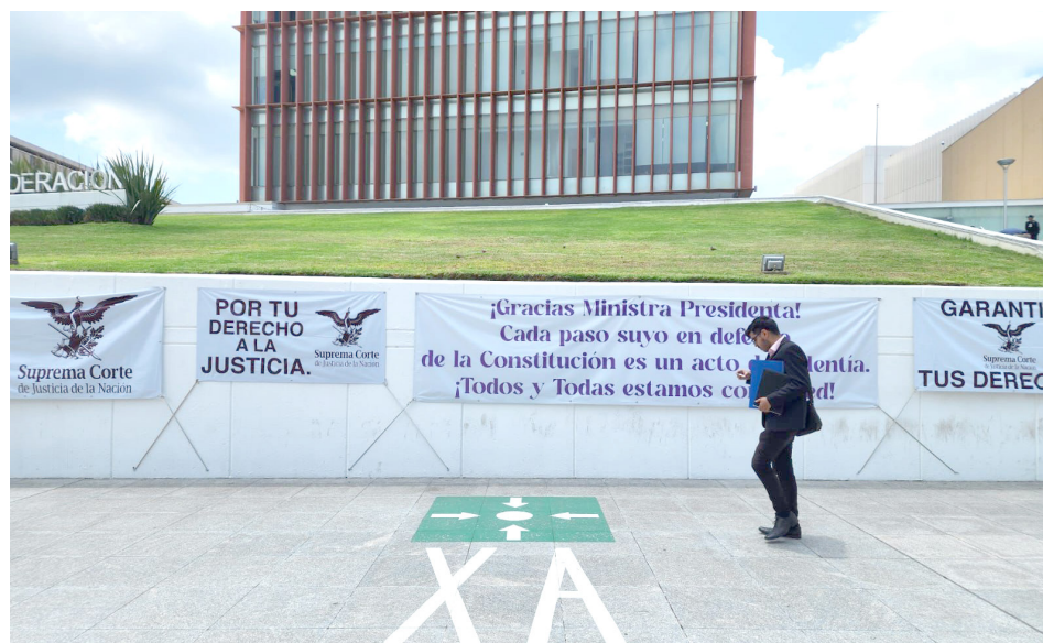
En Ciudad Judicial pegaron mantas en protesta.

A partir de este lunes los trabajadores del Poder Judicial de la Federación