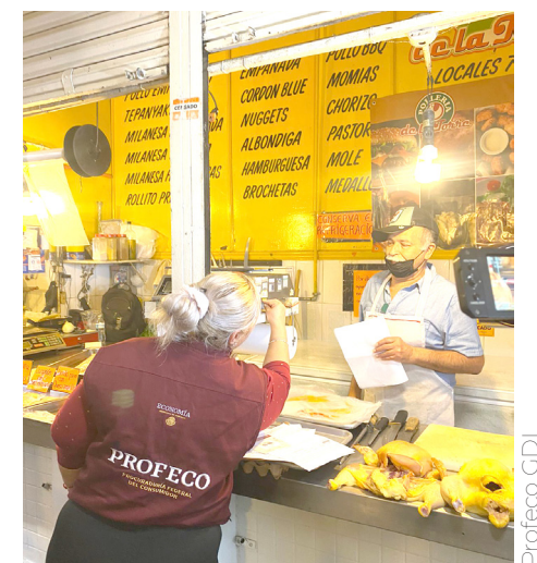
Los propios comerciantes piden la supervisión.

El titular de la Procuraduría Federal del Consumidor en la capital de Jalisco recordó que los negocios tuvieron los tres primeros meses del año para regularizarse, por lo que ya deben estar preparados para cumplir con las verificaciones.