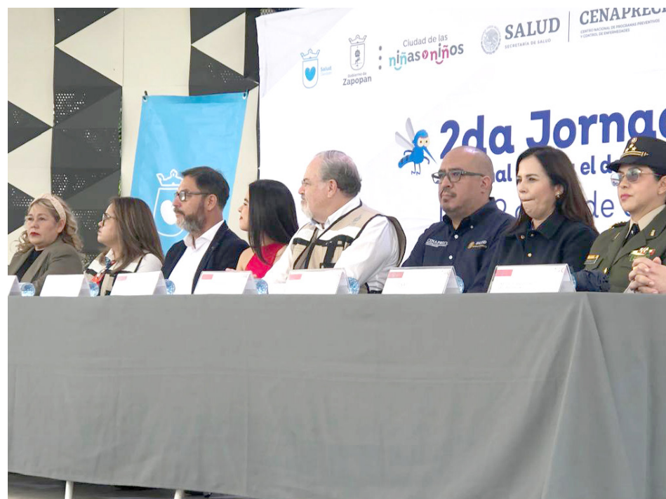
La alerta internacional es sobre todo para los países de África.

El principal llamado es a la población vulnerable, quienes tienen enfermedades que generan