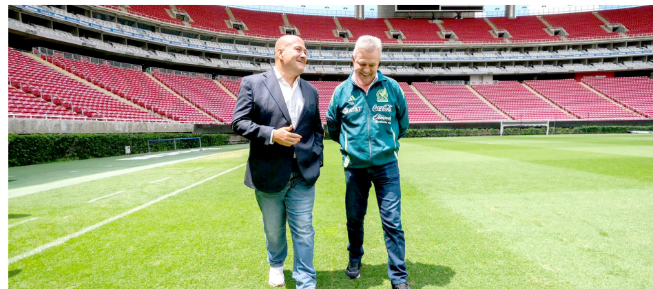
Javier Aguirre recorrió el estadio.