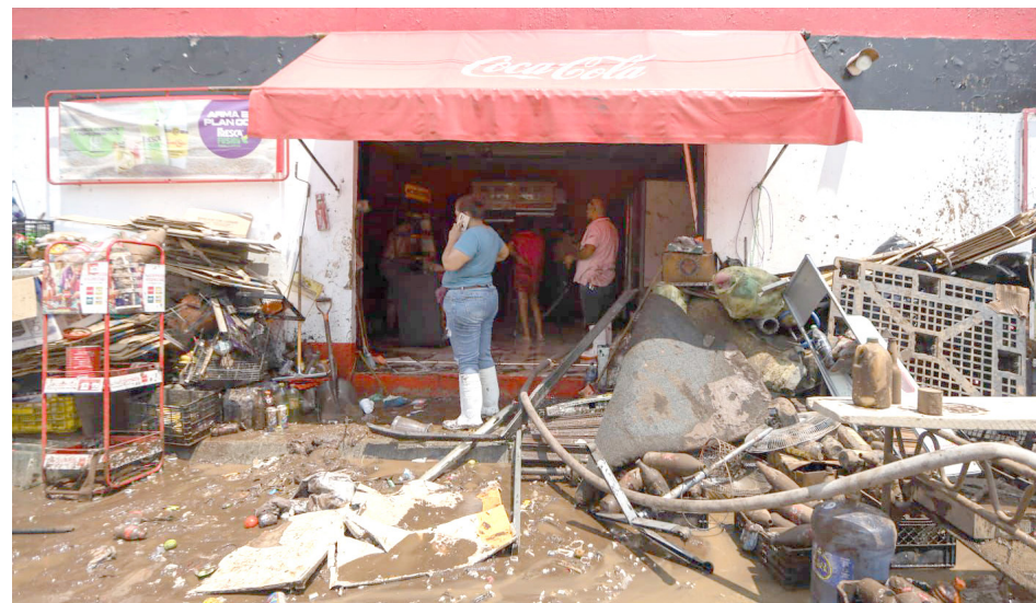
Casas y negocios perdieron menaje por la lluvia del pasado 14 de agosto.

Mañana podemos entregarles ya el diagnóstico final y afortunadamente tenemos un fondo estatal habilitado para que los recursos puedan estar de inmediato”.