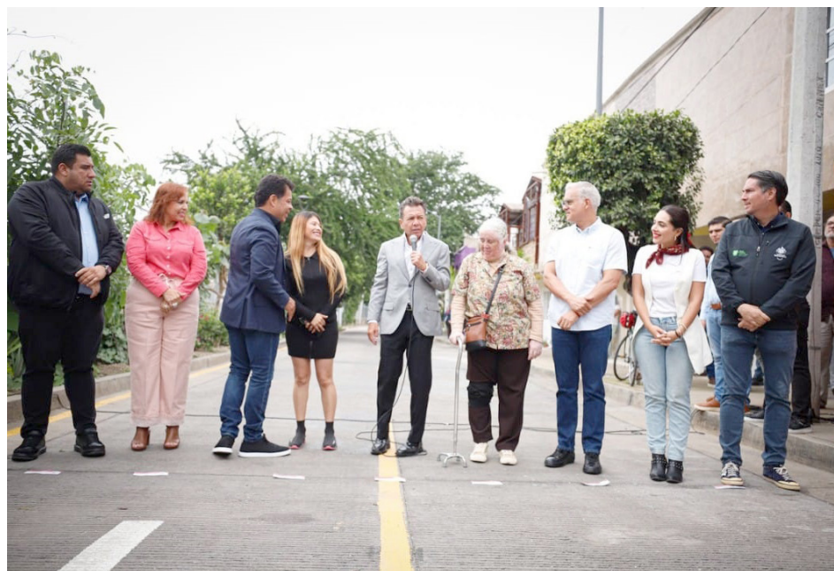
Gobierno de Guadalajara

La renovación de las calles Normalistas y Benjamín Gutiérrez no solo mejorará la movilidad de la zona, sino que representará una inversión a largo plazo en favor de la comunidad.