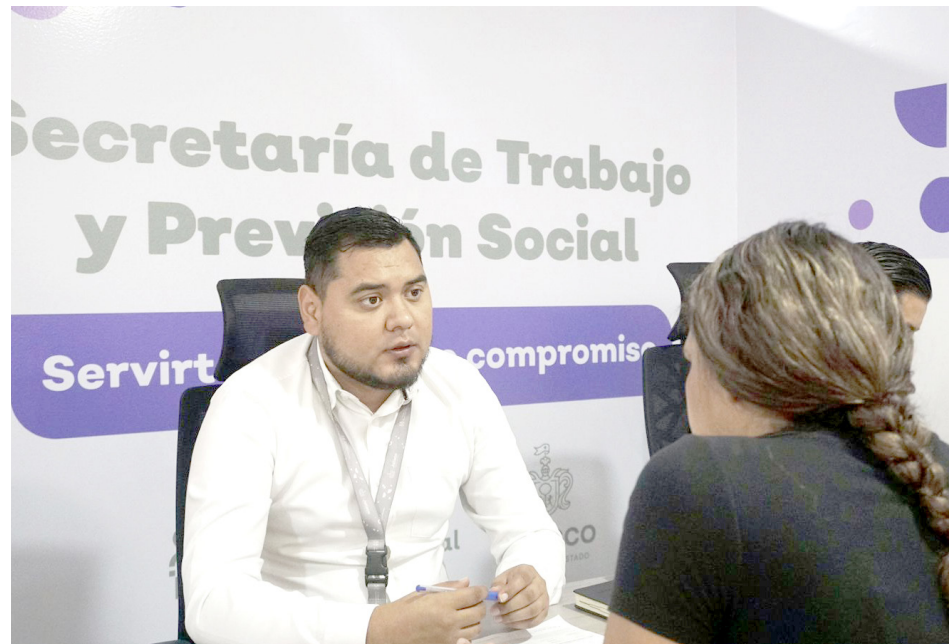
Piden a usuarios que verifiquen que el personal que los atiende.

“Hace unos días identificamos a personas que se ostentan como procuradores, presentamos nuestras denuncias formalmente, ya los identificamos y estamos a punto de detenerlos, vamos a darles certeza jurídica a todos los que acuden a recibir asesoría por parte de la Procuraduría, no