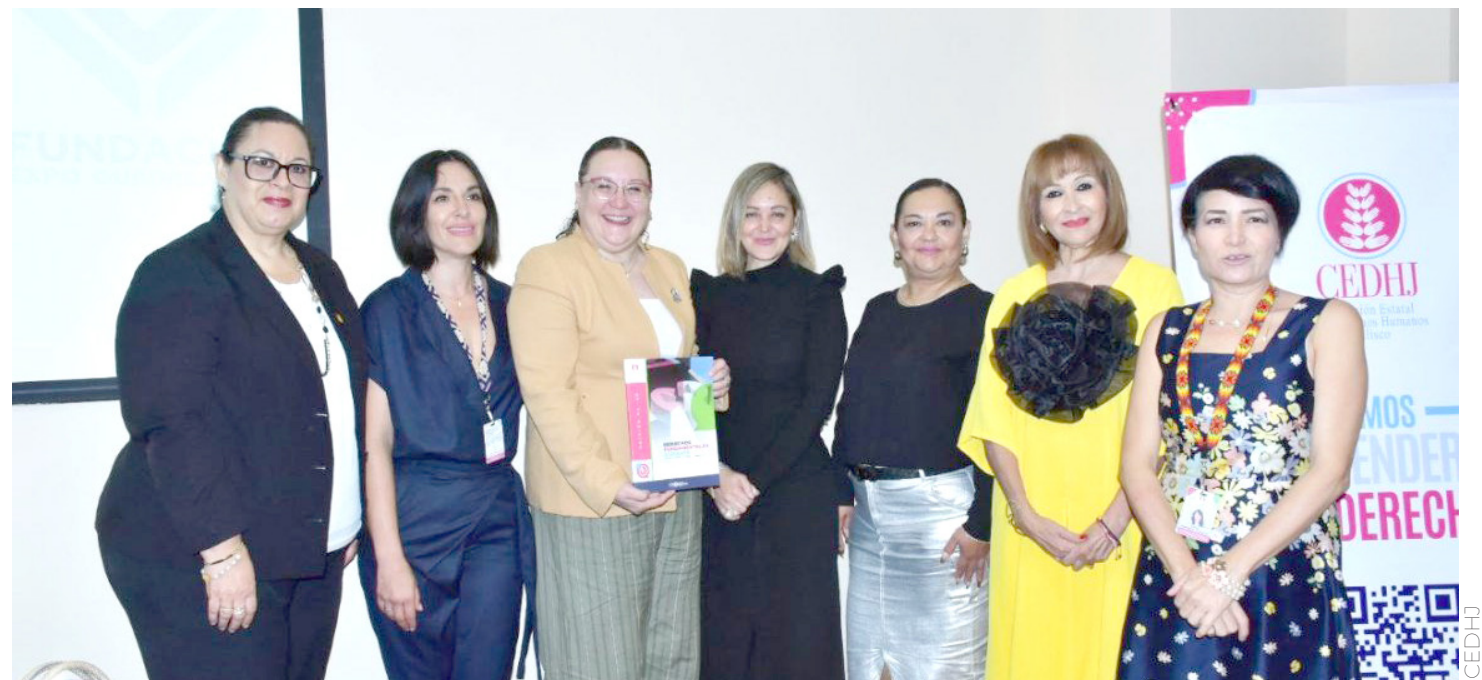
También presentaron el número 20 de la revista Derechos Fundamentales a Debate que edita la CEDHJ.

con el trabajo: “El reclutamiento y utilización de niñas, niños y adolescentes por parte del crimen organizado: una revisión al marco legal”.