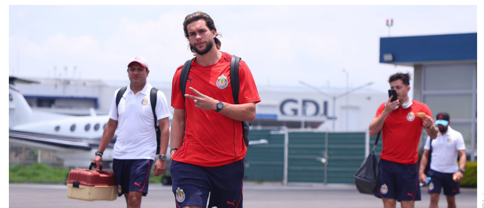
El equipo no conoce la victoria luego de dos jornadas.

El Estadio La Corregidora será escenario donde el Guadalajara buscará este martes su primera victoria de la temporada. El arbitraje correrá a cargo de Fernando Hernández. Para