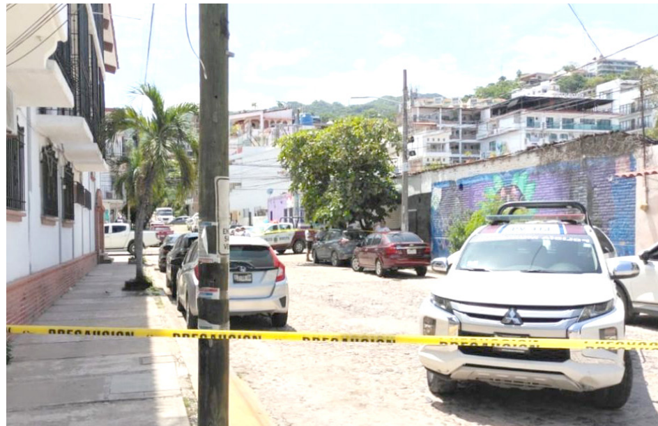
El hecho ocurrió alrededor de las 11 horas en la colonia 5 de Diciembre.