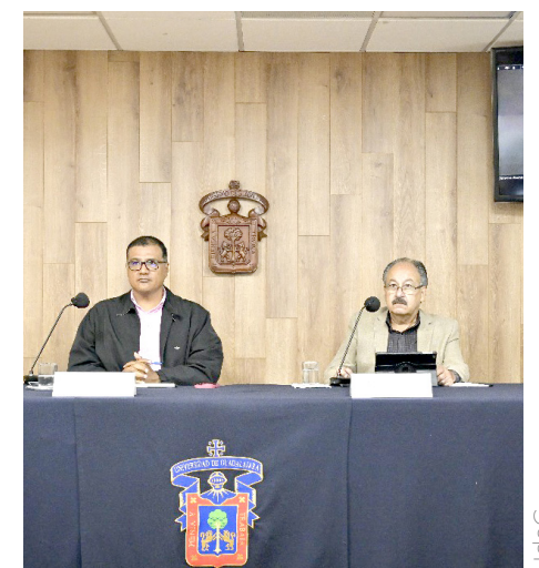
Proponen la creación de corredores verdes a lo largo de las riberas de los ríos.

Por este motivo y basándose en las experiencias de otros países, investigadores del Centro Universitario de Arte, Arquitectura y Diseño de la UdeG, proponen la creación de corredores verdes a lo largo de las riberas de los ríos principales de las tres subcuencas del Valle de Atemajac: los ríos Atemajac, San Juan de Dios y Osorio, sobre todo desde las tierras altas, donde inicia el escurrimiento.