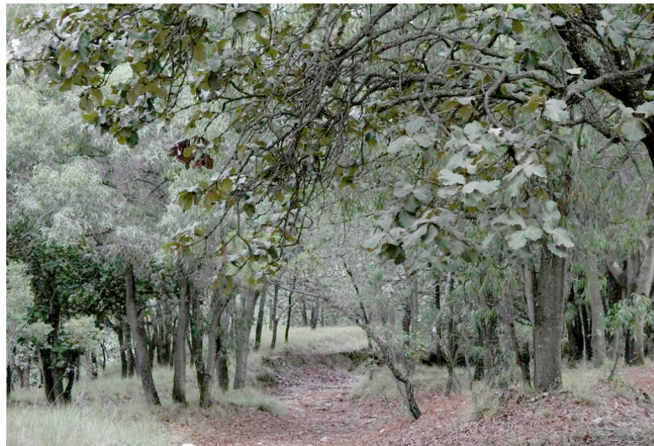
Jalisco se distingue por su riqueza natural, ocupando el cuarto lugar en biodiversidad.

Mediante un comunicado se detalla que Jalisco se distingue por su riqueza natural, ocupando el cuarto lugar en biodiversidad a nivel nacional. Con una superficie forestal de más de cuatro millones de hectáreas, aproximadamente el 55 por ciento de su territorio, está cubierto por distintos tipos de ecosistemas forestales como: selvas caducifolias y subcaducifolias,