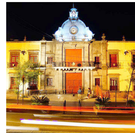
Gobierno de Zapopan

Zapopan es actualmente el municipio con mayor población en Jalisco.