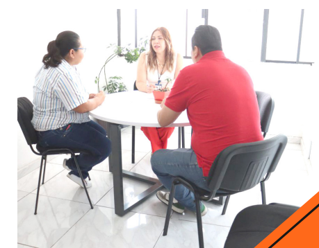
De los 700 servicios otorgados 130 fueron en conflictos vecinales.

Su intervención para estos conflictos se faculta en el Reglamento de Métodos Alternos de Solución de Conflictos del Municipio de Guadalajara, en tanto que el Instituto de Justicia Alternativa (IJA) le brinda competencia para resolver problemas de índole por materia estatal como civiles, familiares y mercantiles.