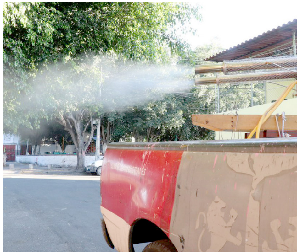
La fumigación impide la propagación del mosco transmisor del virus.

“El tema más importante para prevenir el dengue es la eliminación de los criaderos. Es importante este año porque, precisamente, el dengue tiene un ciclo epidemiológico muy particular. Regularmente, cada tres o cinco años tiene ciclos de pandemia, y por eso es importante que aprendamos a combatir este mosquito y, sobre todo, a eliminar su reproducción para minimizar la transmisión del virus”.