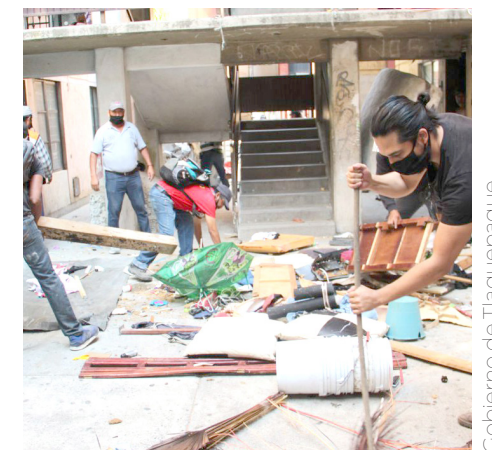
Evita mantener cacharros en casa para evitar el mosquito.