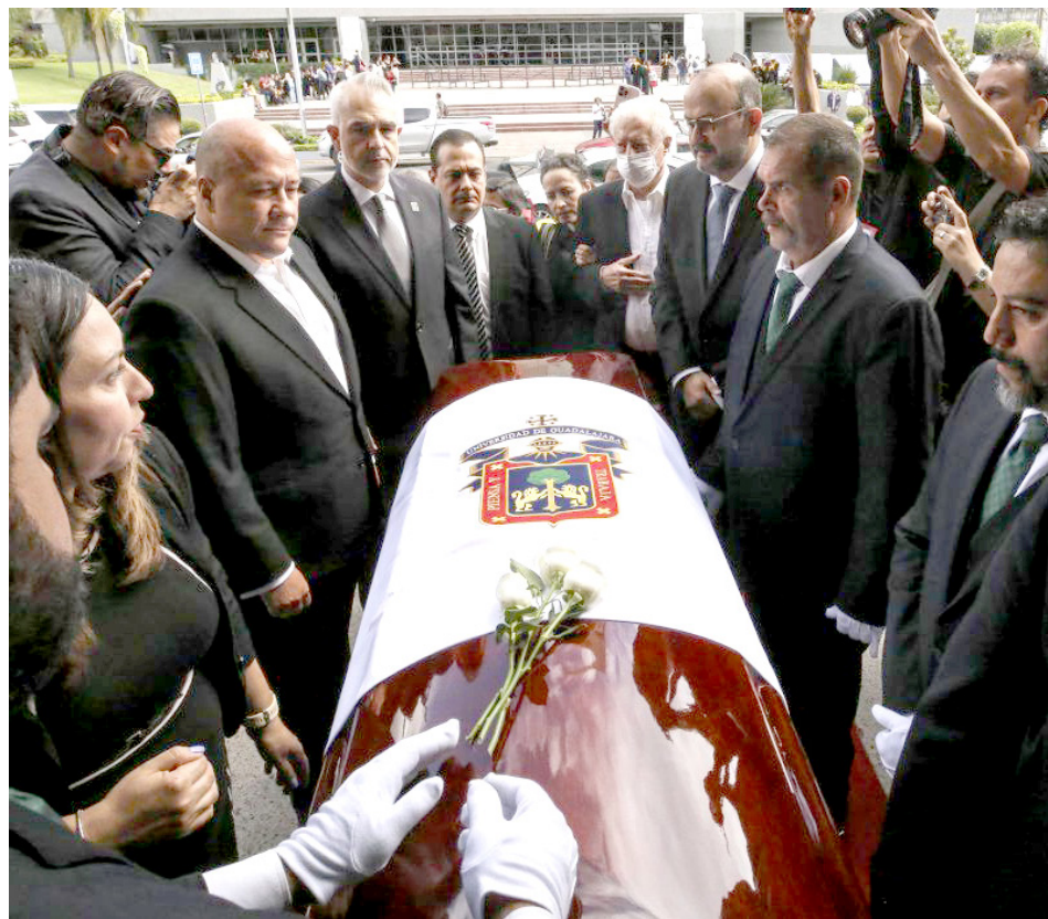
Montaron varias guardias de honor en el féretro.

“Esta fue su casa, la Universidad fue la institución que le permitió hacer más de lo que le tocaba en la vida, esta