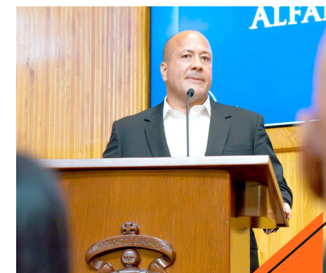
El Gobernador de Jalisco se mostró complacido por las muestras de cariño.