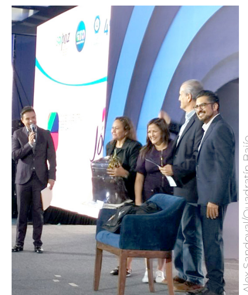
Alex Sandoval/Quadratin Bajío

"La Paz no es un lujo, es un derecho humano fundamental que permite la construcción de sociedades prósperas y justas. Los líderes globales que tienen un mensaje de paz, deben hacerse oír, alzar la voz