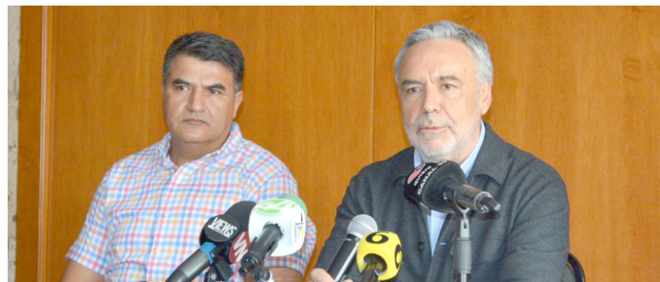
Alfonso Ramírez Cuellar

El político visitó Jalisco para agradecer el apoyo electoral brindado a la presidenta electa Claudia Sheinbaum. En esta reunión dio a conocer los pormenores de la iniciativa de Reforma Judicial que se estará discutiendo en el Congreso de la Unión en septiembre próximo cuando tome protesta la próxima legislatura.