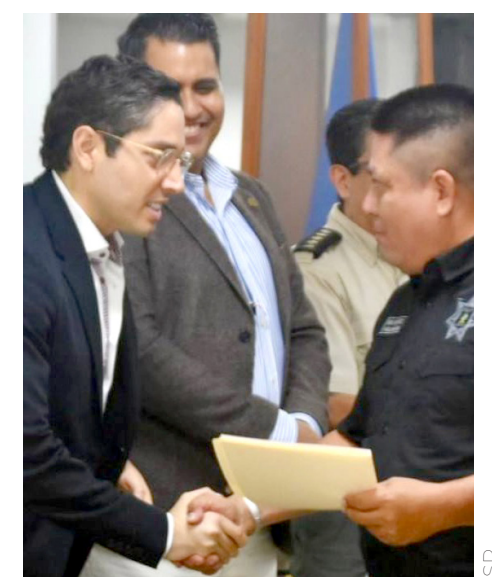
Fueron 40 oficiales de 12 corporaciones.

El papel del moderador. Investigación Documental. Investigación de campo. Informe pericial. Juicios Penales. Anatomía Tipográfica. Investigación y fijación del lugar de los hechos. Dactiloscopia. Revelado e impresión de fotografía en el sistema manual. Huellas latentes y dactilares. Balística. Cadena de custodia. Indicios físicos y biológicos. Computación y software 3D.