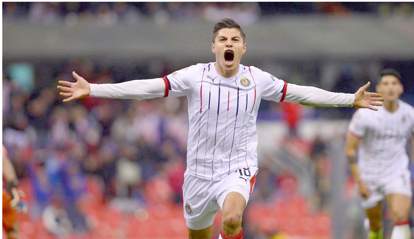
Ronaldo Cisneros continuará su carrera en Querétaro.