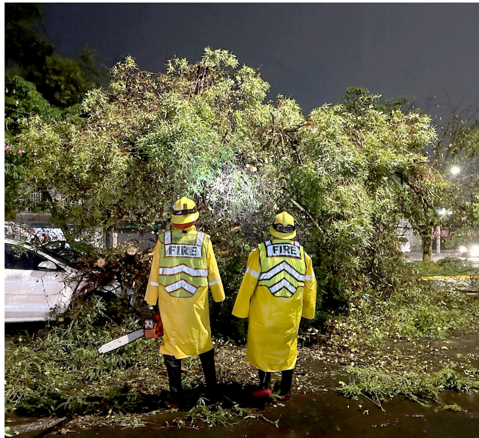
En Zapopan fueron cerca de 78 servicios los que incluyeron retiro de árboles.

Debido a la fuerte lluvia que se presentó por la noche, hubo un