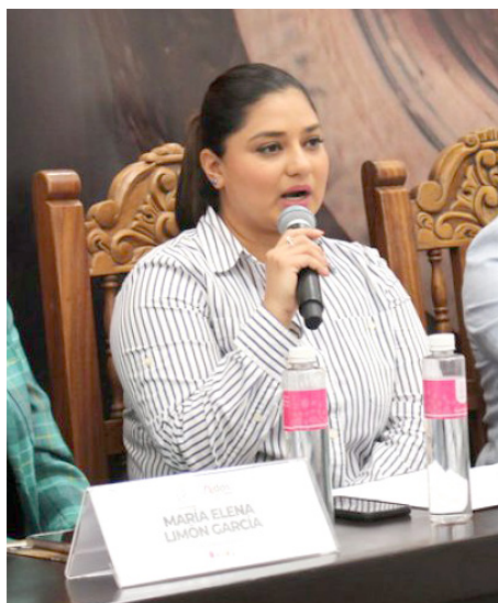
Gobierno de Tlaquepaque

Los integrantes de los distintos colectivos expresaron sus dudas a los encargados de la capacitación, mismas que fueron resueltas durante este proceso. El organismo tiene el interés principal de asegurarles a los colectivos que está presente en el acompañamiento de búsqueda de sus familiares.