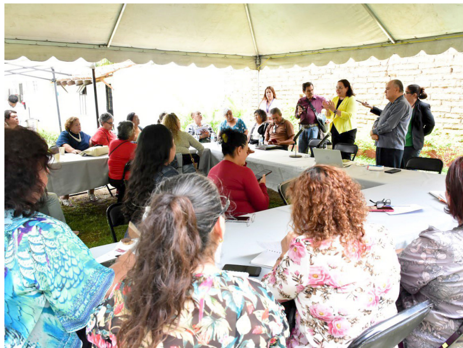
Participaron cuatro colectivos de búsqueda de personas.

Se les informó sobre los deberes de las instituciones relacionadas con el seguimiento a las denuncias por personas que no han regresado a casa