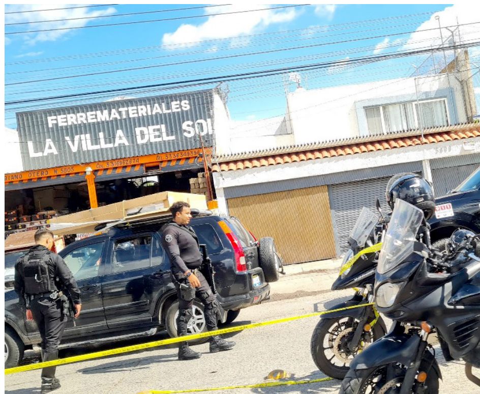
En los primeros seis meses de este año se cometieron 10 mil 27 delitos.

De acuerdo con datos del Secretariado Ejecutivo del Sistema Nacional de Seguridad, el Estado de Jalisco registró una disminución del 66.2%