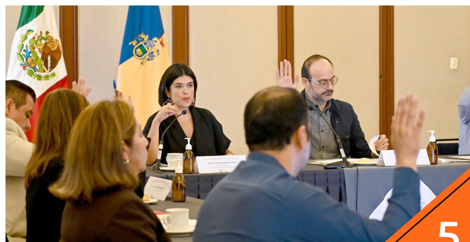
La Junta de Coordinación Metropolitana sesionó para aprobar la propuesta.

Durante los próximos 45 días, quienes habitan el Área Metropolitana de Guadalajara podrán participar en la Consulta Pública para el Desarrollo y Ordenamiento Metropolitano.