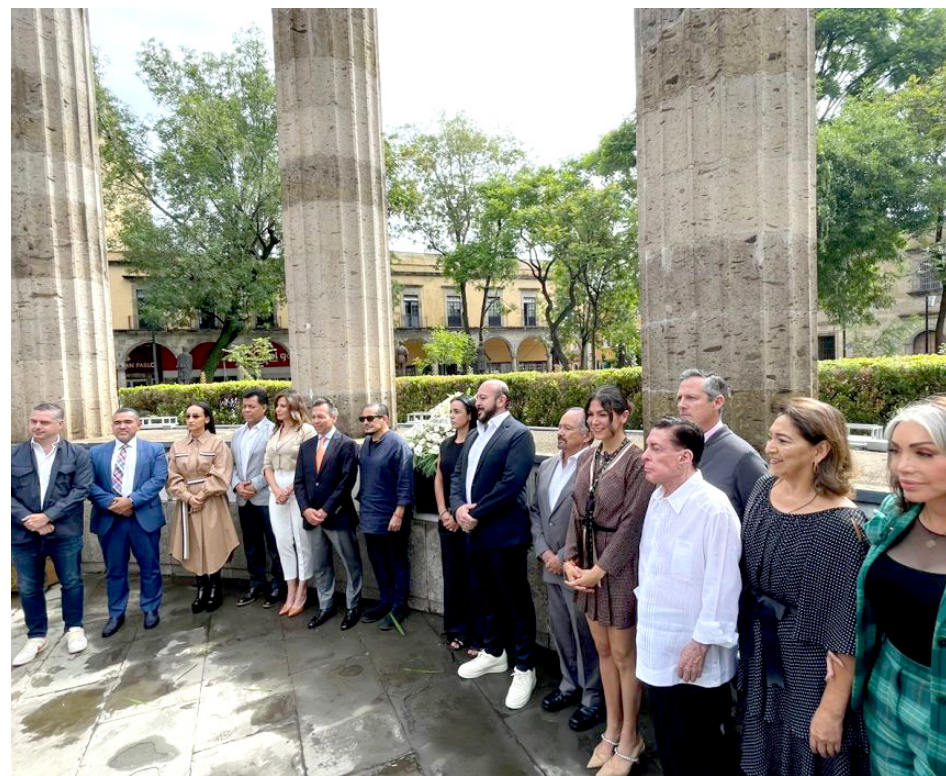
Se conmemoró el 126 aniversario de su natalicio en la Rotonda de los Jaliscienses Ilustres.