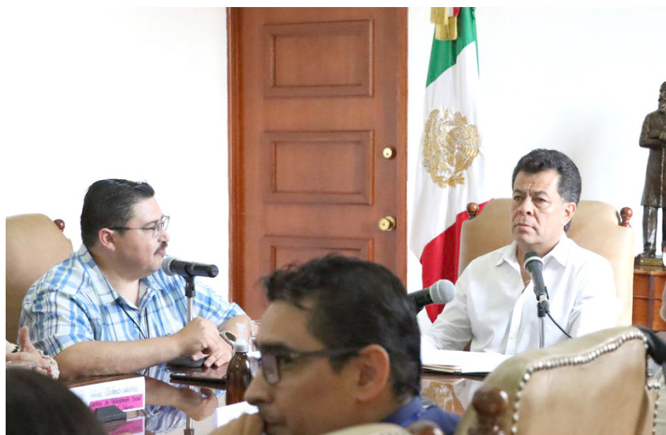
Realizan reuniones para llevar a cabo estrategias conjuntas.

Las dependencias estatales y municipales han realizado visitas a más de 90 domicilios para concientizar sobre la descacharrización