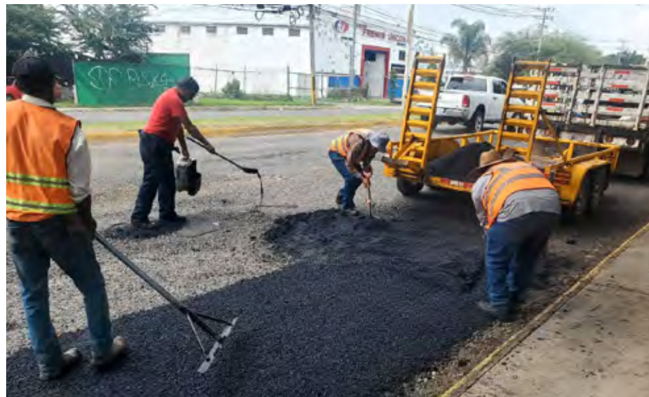
Se trata de un tramo de 11 kilómetros en una intervención urgente desde Periférico hasta San Agustín.

Mientras, la Secretaría de Infraestructura y Obras Públicas informó que continúan las intervenciones