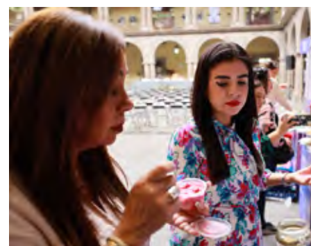
Reconocieron a participantes de Talento e Innovación.