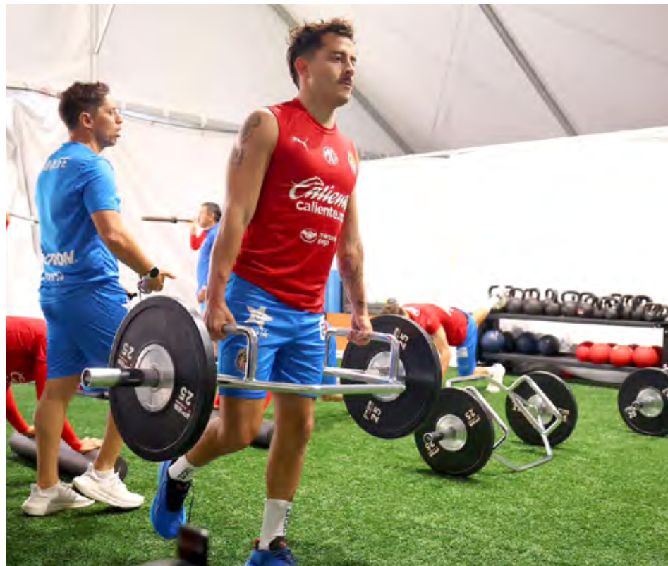
En este certamen, Chivas comenzó con un empate frente a San José.

El equipo tapatío está listo para medirse el próximo domingo ante el Galaxy de Los Ángeles, líder de la Conferencia Peste de la MLS