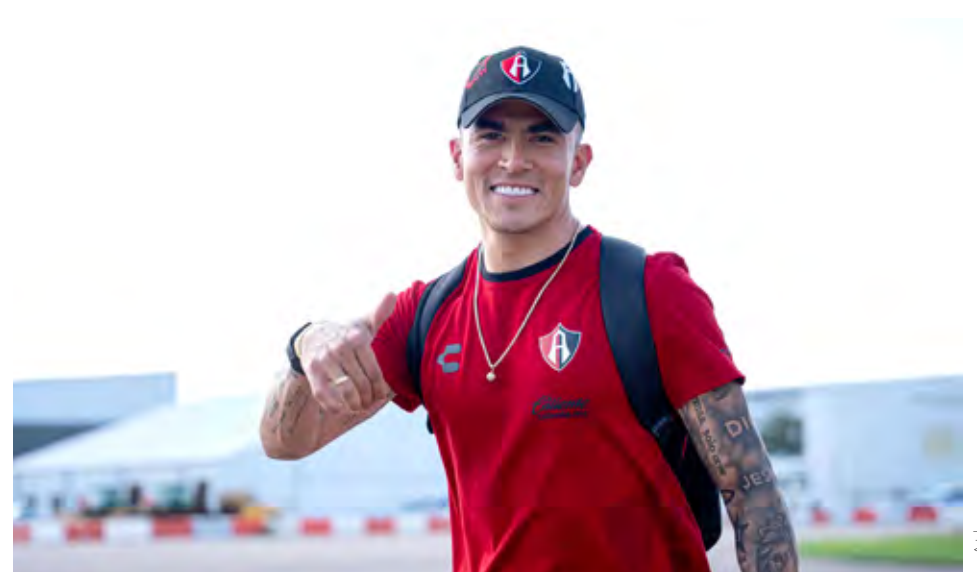
Los Rojinegros se dirigieron rumbo a

“Tras la victoria de La Academia de 0-1 ante Houston Dynamo en su debut dentro de la Leagues Cup 2024, los Zorros han continuado con su preparación en tierras norteamericanas. Este 29 de julio, inició a las 08:30 horas para los jugadores y cuerpo técnico de los de Jalisco, con un desayuno en el hotel de concentración. Posteriormente, los Rojinegros realizaron un entrenamiento en las instalaciones del mismo hotel, para después iniciar su camino hacia su nuevo destino”, explicó el club.