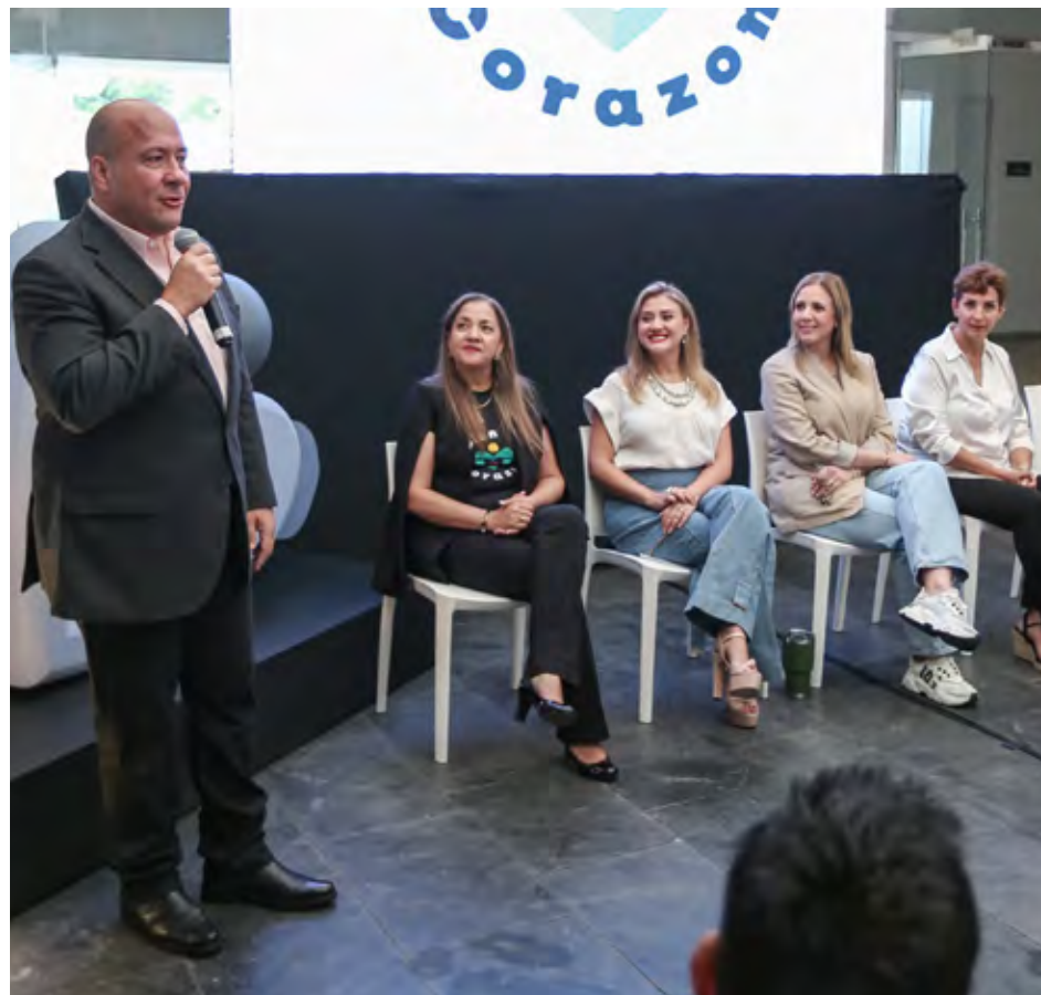
La obra de rehabilitación integral inició el 27 de septiembre del 2021.

La obra de rehabilitación integral inició el 27 de septiembre del 2021, el