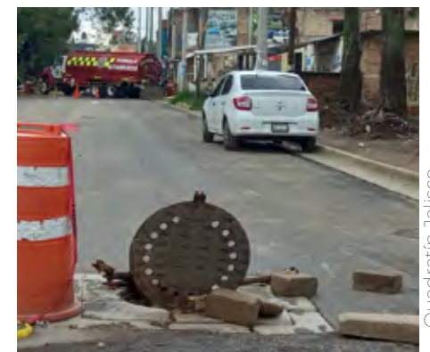
Se habían vertido más de 6 mil litros de gasolina a los drenajes.

El pasado domingo 7 de julio se dio a conocer que se habían vertido más de 6 mil litros de gasolina a los drenajes, y se responsabiliza a la gasolinera Oxxo Gas en la zona de Coyula; y lo anterior provocó intranquilidad en las más de ocho mil personas que residen en la demarcación, reconoció el jefe de gabinete municipal, Carlos Maguey, quien refiere que se ya no existe un riesgo de explosividad.