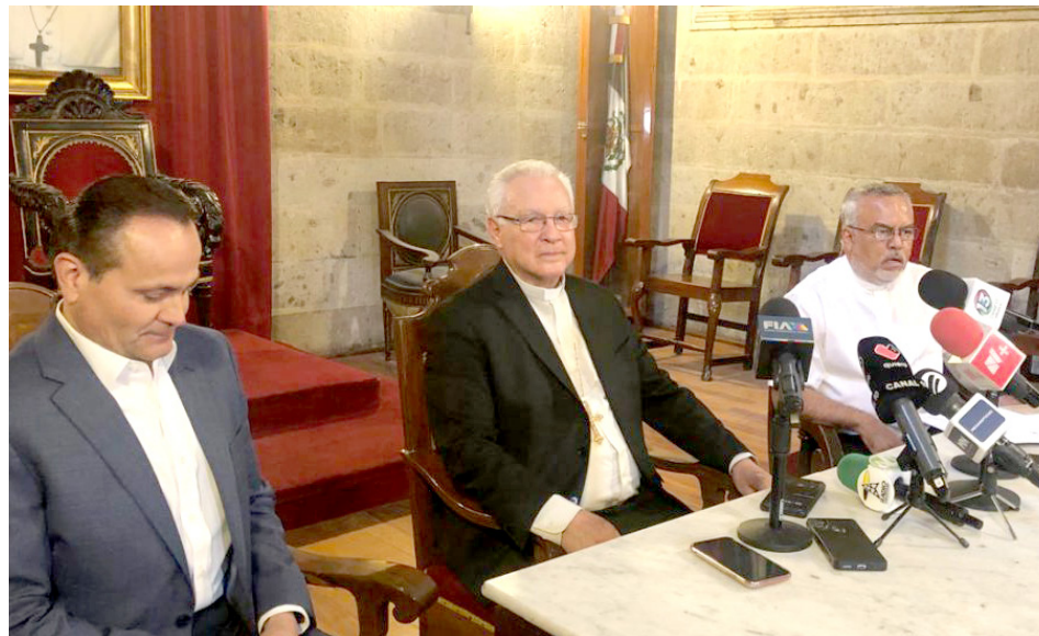
El cardenal Francisco Robles Ortega, dio a conocer los pormenores de la visita.