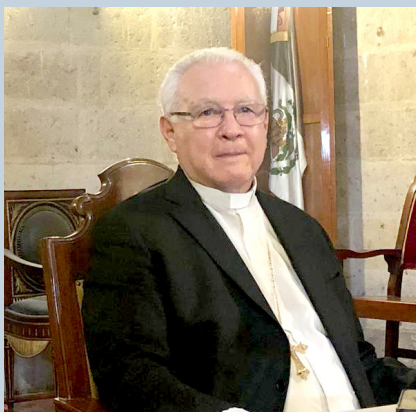
Gobierno de Jalisco

Virgen de Zapopan visitará el Lago de Chapala