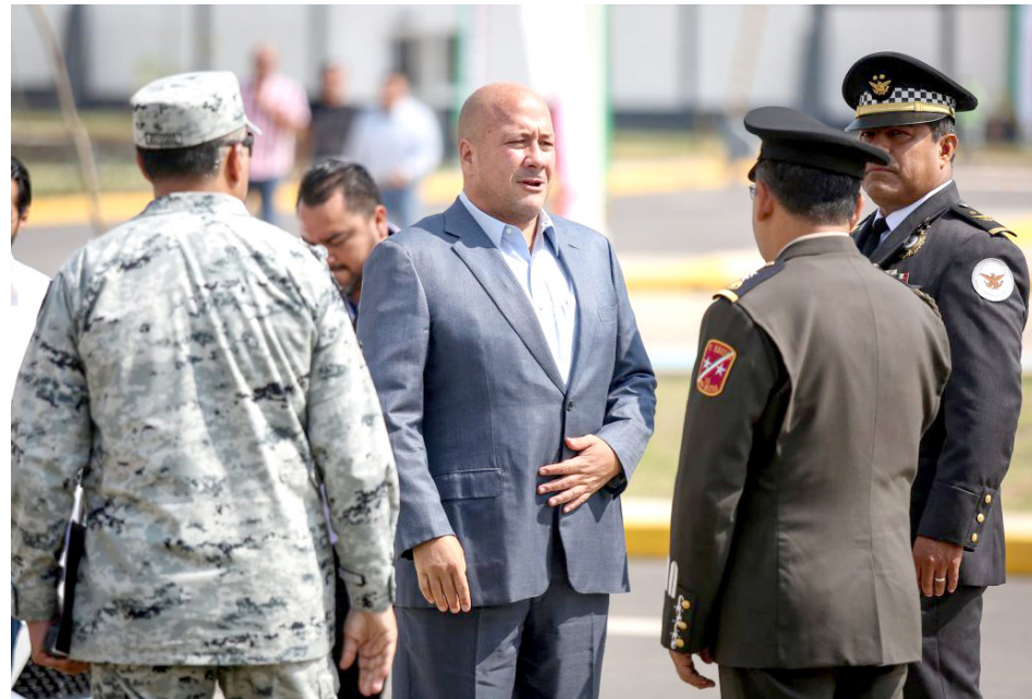
La Guardia Nacional se ha convertido en un aliado de las entidades federativas, dijo el Gobernador.

“La Guardia se ha convertido en un aliado muy importante para las entidades de la República y para los municipios del país, porque justo en estados como Jalisco hemos ido fortaleciendo los mecanismos de coordinación para tener una sola idea de hacia dónde vamos, para tener un trabajo basado en la comunicación permanente y basado también en el respeto; jamás hubiera sido posible, sin el apoyo de la Guardia Nacional, del Ejército Mexicano y de la Marina de México, dar los resultados que