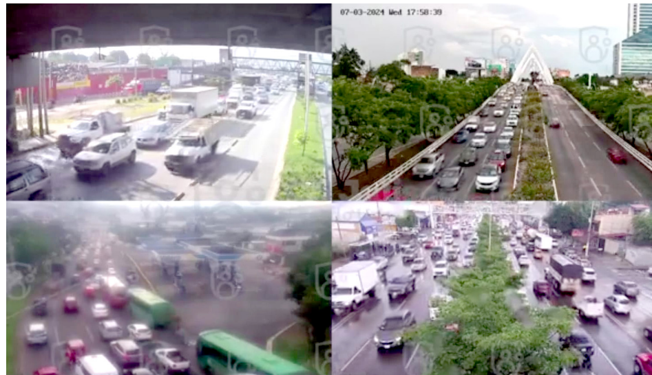
Fueron 204 vehículos ubicados por medio del sistema de videovigilancia de Escudo Urbano C5.

Mediante un comunicado se informó la recuperación a través de diferentes medios de detección. Por ejemplo, 204 vehículos fueron ubicados por medio del sistema de videovigilancia de Escudo Urbano C5, lo que derivó en cada uno de los casos diversas acciones estratégicas para obtener la ubicación exacta y culminar con el aseguramiento.