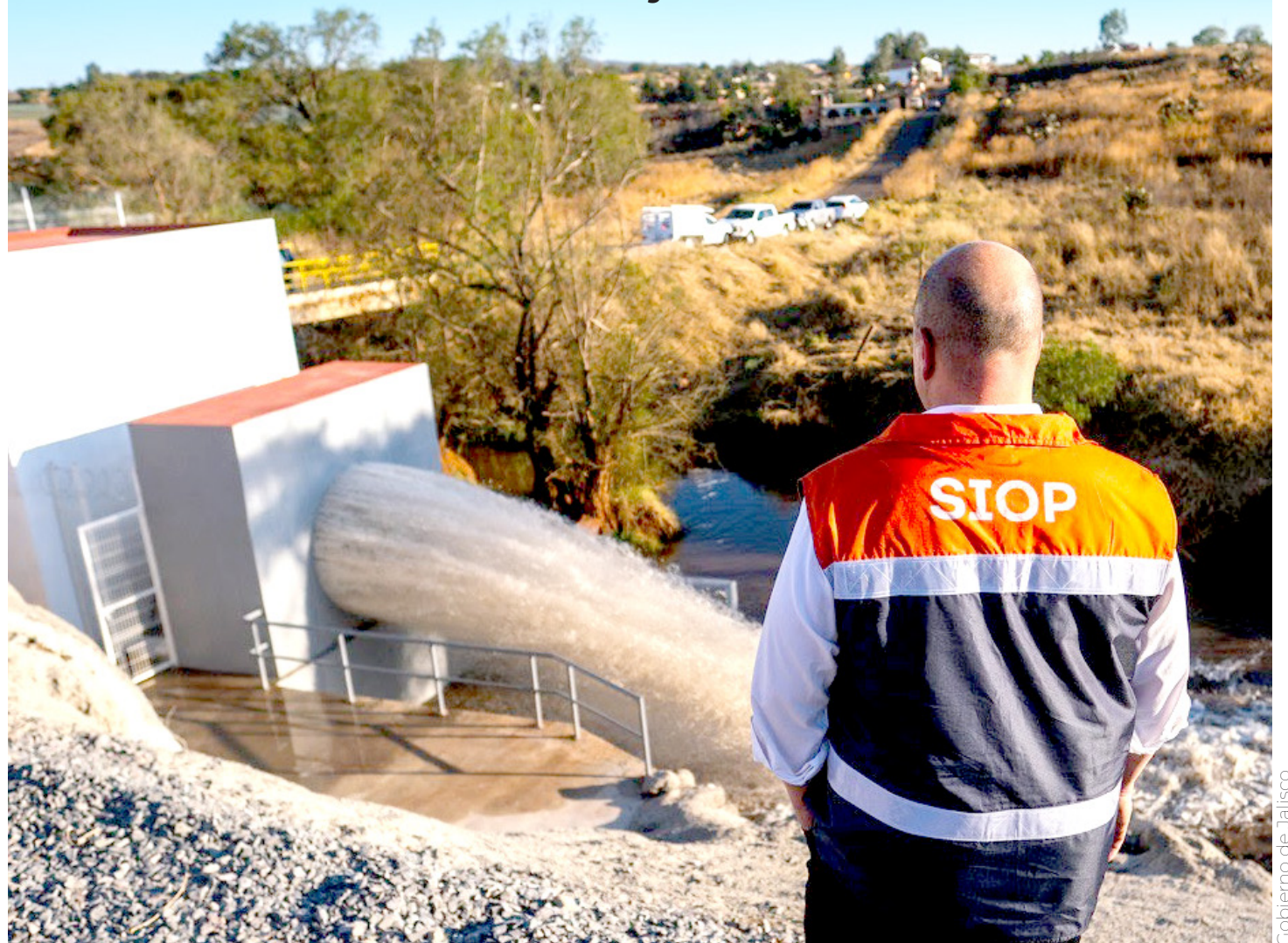
Gobierno de Jalisco