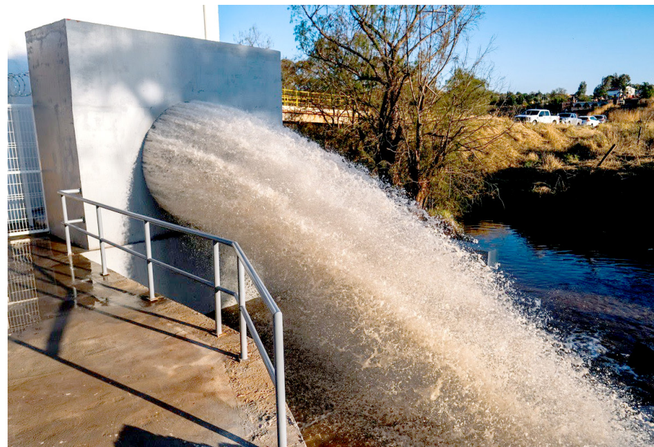
Las presas El Salto y Calderón han iniciado un ascenso en sus niveles.

“Ya inició la recuperación de nuestras presas, podemos decir con mucho orgullo que resistimos la peor sequía de la historia, que no hubo necesidad de hacer tandeos como lo habíamos explicado, que ya la presa Calderón empezó su recuperación, que Chapala inclusive ya se recuperó. Entonces ya pasó el estiaje y salimos afortunadamente bien librados, sin ningún problema. Estamos a punto de terminar las obras de electrificación que faltaban para el sistema El Salto-Calderón, que nos va a permitir tener ya el doble de agua de la presa El Salto, de la que tenemos ahorita, y la presa El Zapotillo inició ya su llenado, ya se hizo el cierre hidráulico, entonces en este temporal ya está juntando agua, y el acueducto de El Zapotillo a El Salto