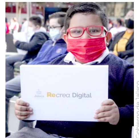
Este programa comenzó durante el gobierno del mandatario en Tlajomulco.

“En esa apuesta que hizo el Presidente, el Gobierno de Jalisco ha hecho su parte, hemos aportado prácticamente dos millones de metros cuadrados de tierra para poder generar la infraestructura que hoy da soporte a la Guardia Nacional”.