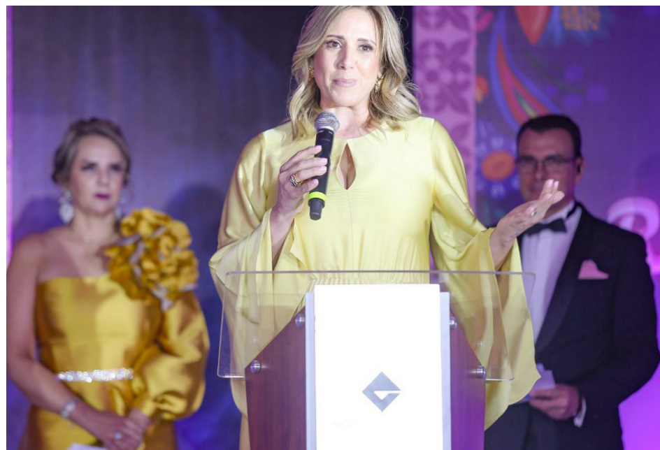
Gobierno de Jalisco

El programa de Apoyo a las Organizaciones de la Sociedad Civil (OSC), ha otorgado recursos directos por 15.4 mdp en apoyo a mil 196 mujeres