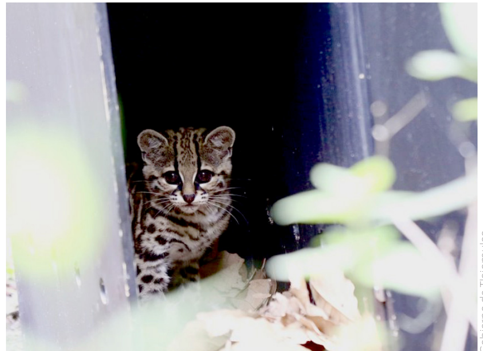
Gobierno de Tlajomulco

El sitio ideal para su reubicación es el Nevado de Colima, un área de 100 mil hectáreas de bosque donde se encuentran más de 240 especies de aves y mamíferos, incluyendo todos los felinos mexicanos el director de este espacio, José Villa Castillo.