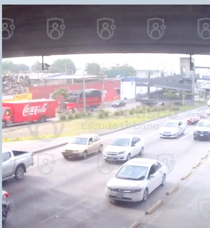
Escudo Urbano C5

Recuperan 242 autos robados con Escudo Urbano C5