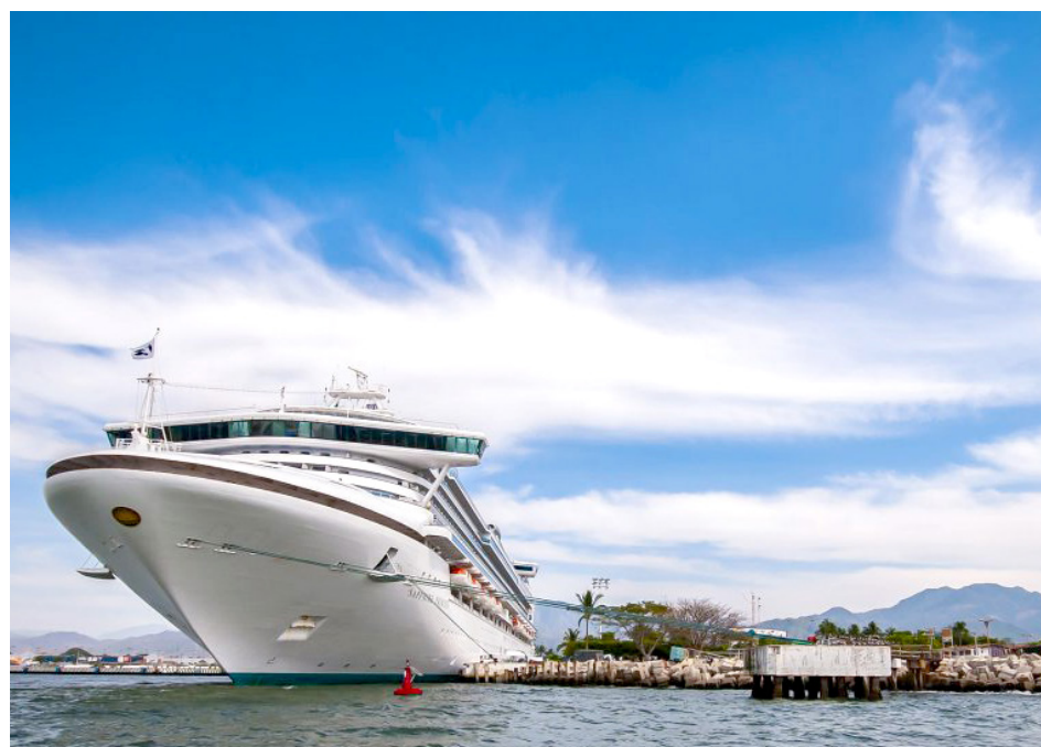
Será un crucero de 912 pies con capacidad para más de 2,700 personas.

Brilliant Lady está siendo construido para la línea de cruceros Virgin Voyages y comenzará a navegar desde Los Ángeles con parada en el destino jalisciense