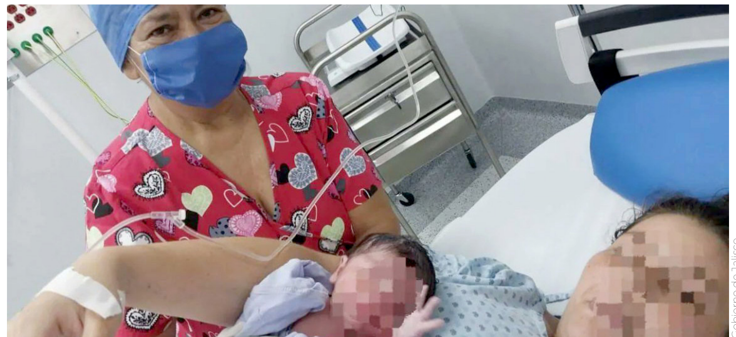
La madre del bebé posó junto a su pequeño para su primera fotografía.

Cabe mencionar que la nueva unidad médica cuenta con Servicio de Cirugía, Consulta Externa, Urgencias, Laboratorio de Rayos X y auxiliares de diagnóstico, CEYE, Tococirugía, recuperación, hospitalización, área de gobierno, Unidad de Cuidados