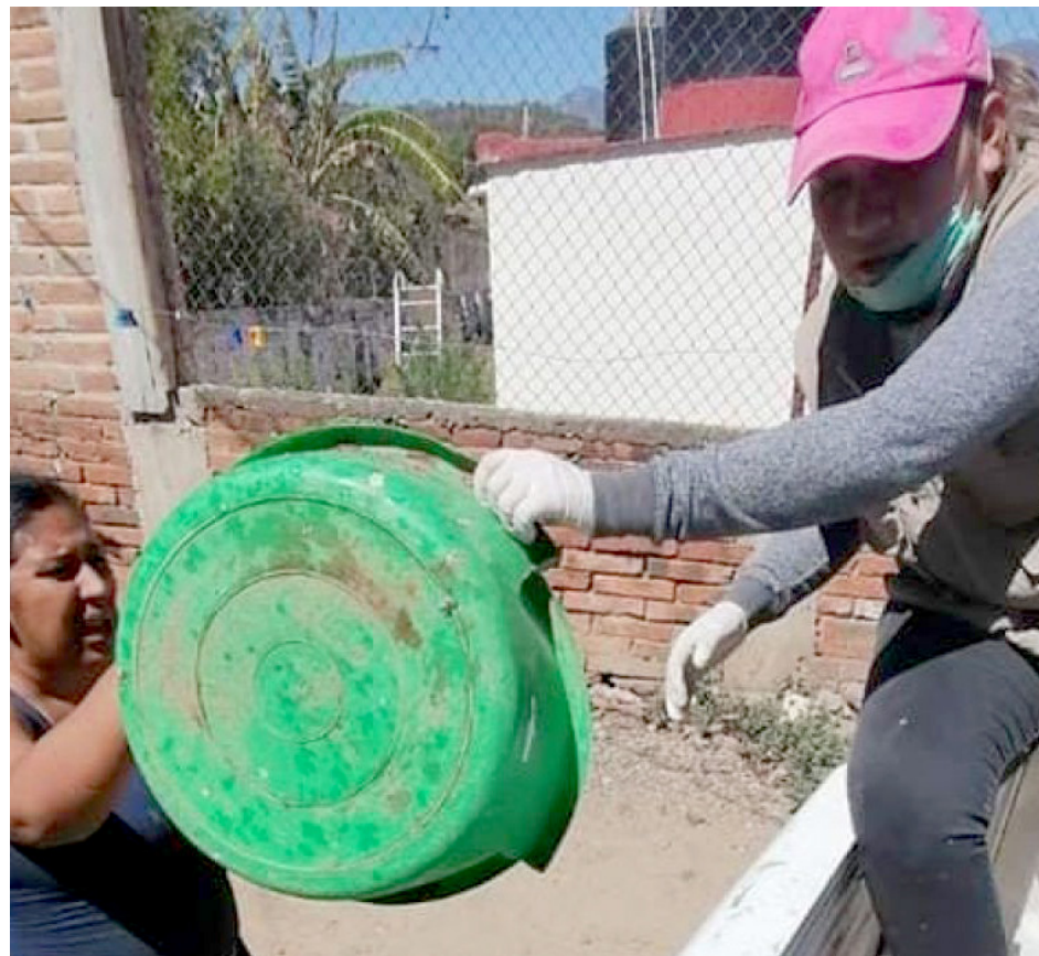
De enero a lo que va de junio, se han recogido 217 toneladas de cacharros.

"En las zonas de mayor densidad poblacional tenemos el mayor riesgo, como es la zona Valle, por lo general también el trabajo de la descacharrización se dificulta porque son hogares donde la gente sale a trabajar y las casas quedan solas, pero normalmente es la zona que más nos impacta", añadió.