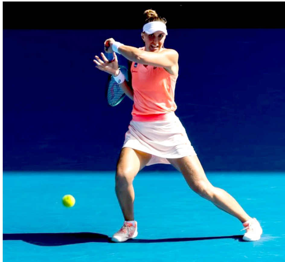
La brasileña Beatriz Haddad Maia confirmó su participación en este certamen.

Se disputará del 9 al 15 de septiembre en el Complejo Panamericano de Tenis y contará con la participación de la brasileña Beatriz Haddad Maia