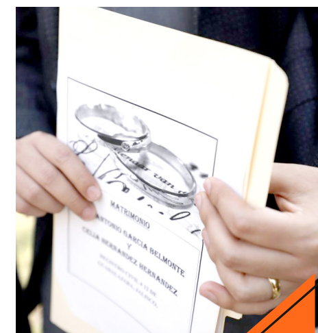
El matrimonio otorga certeza jurídica a las parejas.

Ejemplificó que, en ediciones pasadas, han participado personas con discapacidad, personas mayores e integrantes de la comunidad LGBTIQI. El año pasado, explicó, se celebraron 180 matrimonios igualitarios.