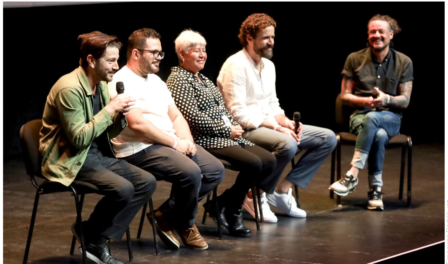
Los creadores de este proyecto presentaron su documental.

“Teníamos que dar es conocer esto y que la sociedad conociera lo importante de lo que hacemos nosotros, no es fácil entrar caminado a las comunidades”.