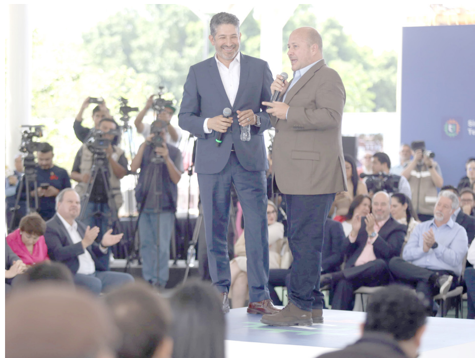
El gobernador del Estado, Enrique Alfaro Ramírez hizo la presentación del nuevo sistema.

Enrique Alfaro aseguró que el primer sistema en su tipo en México, preparará a los jóvenes para los retos del futuro y aprovechar las oportunidades