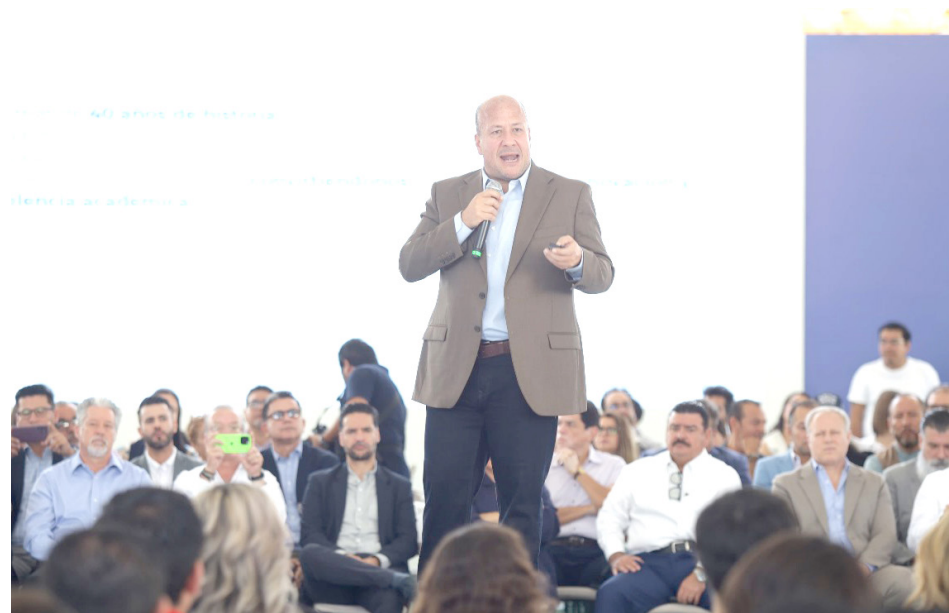
El gobernador Enrique Alfaro Ramírez.

El Gobernador de Jalisco señaló que será en los próximos días cuando dé a conocer su postura general sobre la situación actual del partido naranja