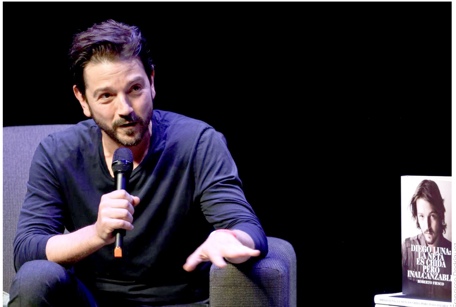
Diego Luna hizo un recuento de su carrera a través de esta obra literaria.

La neta es chida pero inalcanzable, le sirve al actor como una terapia para poner en orden su vida, así lo relató en el evento realizado en el Conjunto Santander