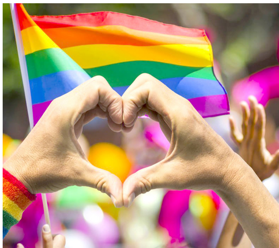
El evento reunirá a colectivos que marcharán por el orgullo LGBTIQ.

Corporaciones estatales acompañarán el contingente que partirá de la Glorieta Minerva con rumbo al Instituto Cultural Cabañas este sábado