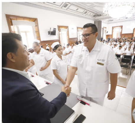
Gobierno de Guadalajara

Los estudiantes ya pueden iniciar sus prácticas clínicas.