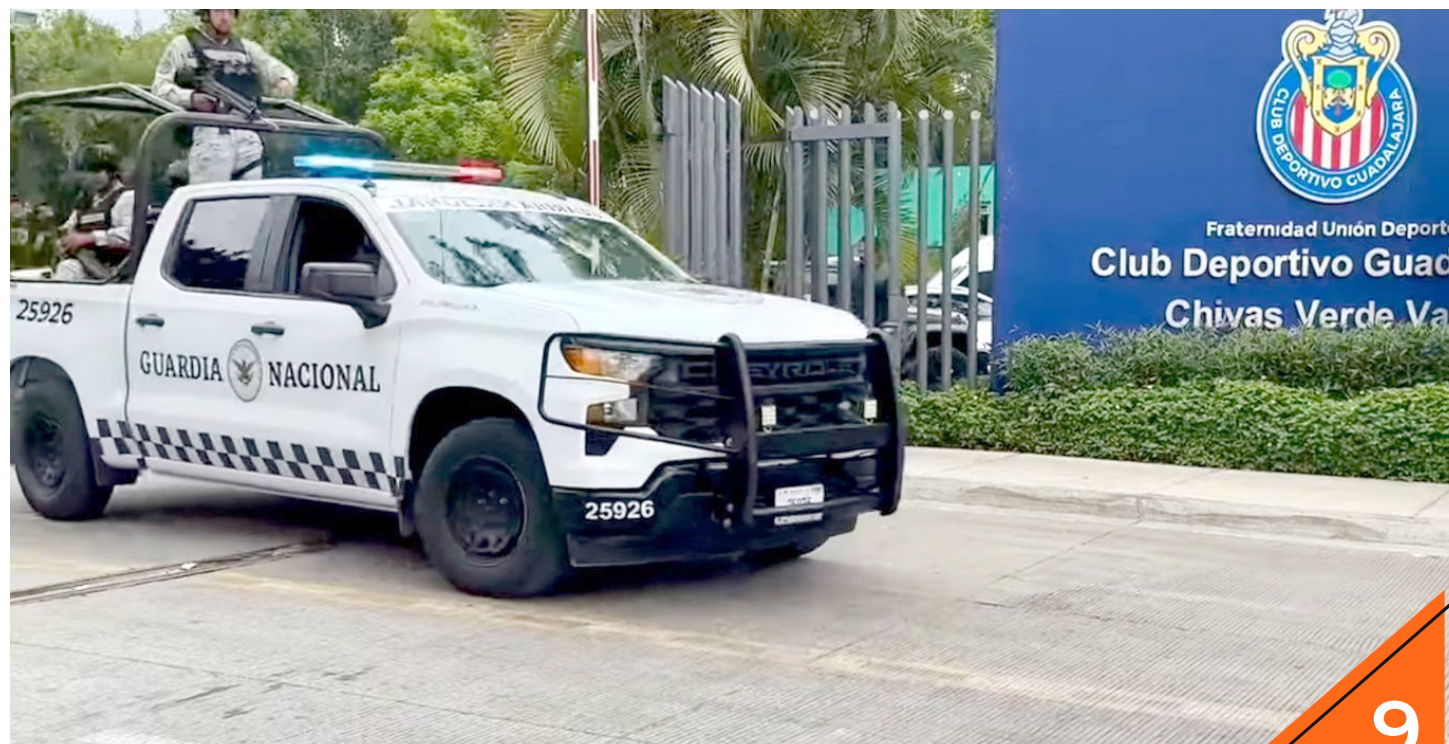
Dos camionetas de la Guardia Nacional acompañaron al equipo.