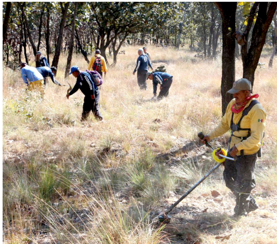
El Gobierno atribuye esta buena noticia a las acciones de prevención.

Esta temporada se realizaron alrededor de 680 mil metros cuadrados de líneas negras y guardarrayas en La Primavera y El Cerro Viejo