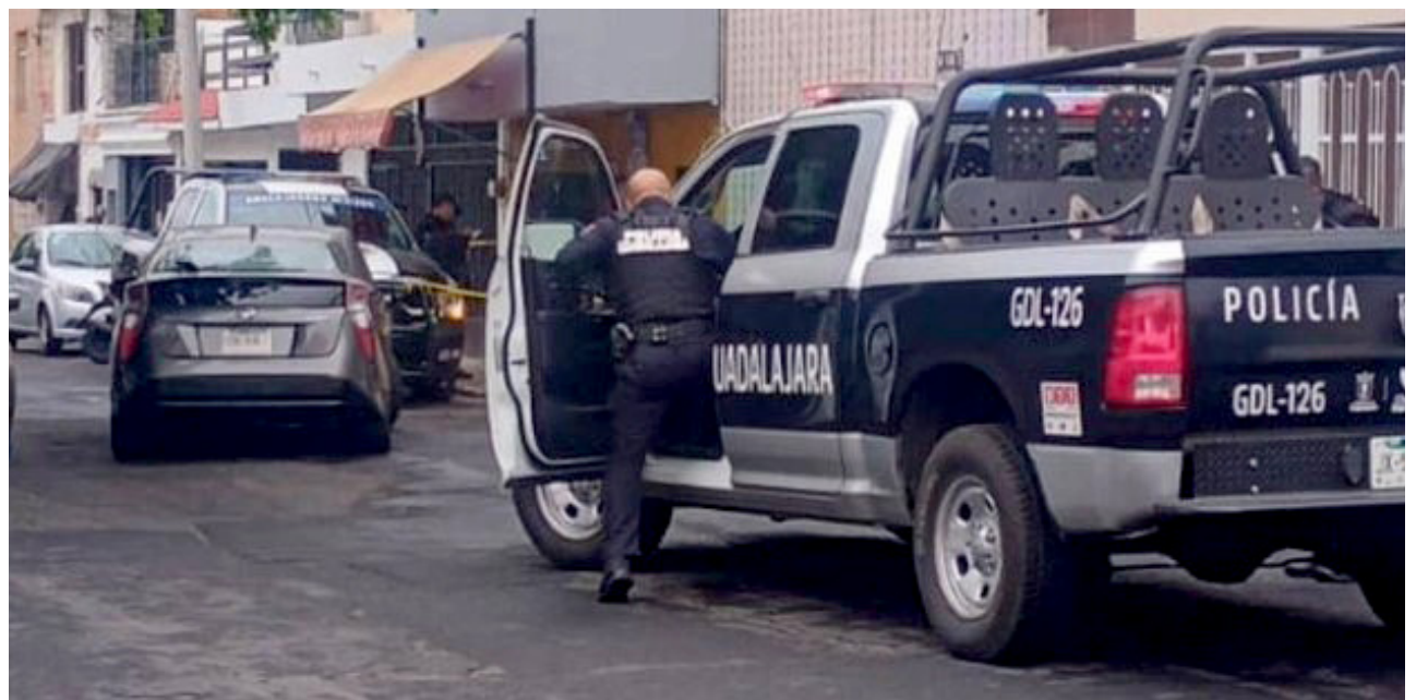
En la colonia La Guadalupe de Guadalajara quedó el cuerpo de un asesinado.

El muchacho tenía 18 años de edad, y según paramédicos, podría haber sufrido un choque metabólico, o un infarto. Trasciende que el joven consumía drogas sintéticas, y que recurrentemente consumía bebidas energéticas.