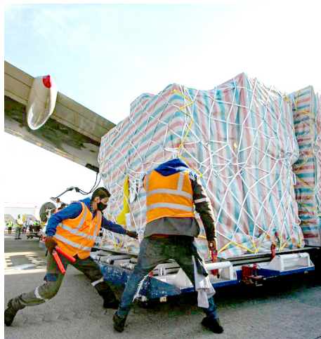
Gobierno de Jalisco

Las empresas jaliscienses podrán trazar rutas estratégicas.