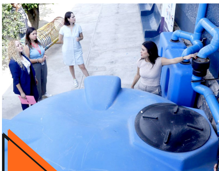
Gobierno de Zapopan

En este último registro fueron 30 casos de dengue no grave, 15 con signos de alarma y, uno grave, lo que suman 46 nuevos casos de acuerdo al último cómputo.