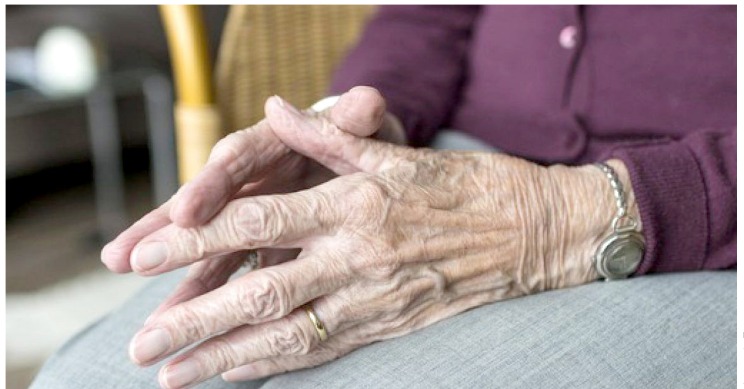
De enero a mayo se realizaron 155 reportes ciudadanos.

De acuerdo con un comunicado, las personas víctimas de maltrato son atendidas en el CEMAM por equipos interdisciplinarios integrados por