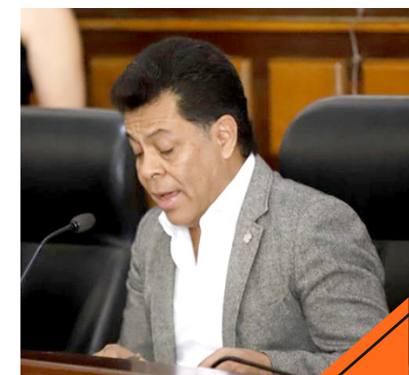
El IEPCJ se encargará de resolver cualquier controversia.

Será el IEPCJ, conforme a sus atribuciones legales y administrativas, quien resuelva esta controversia