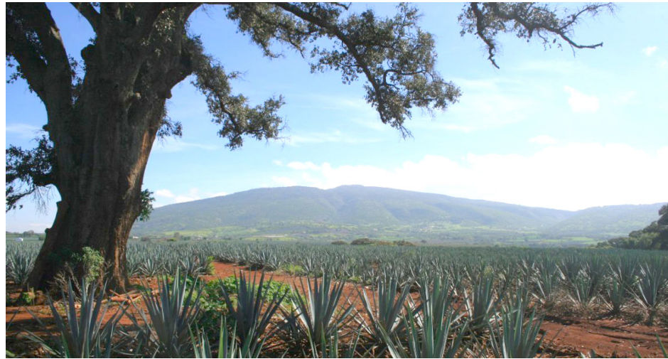
El CRT actúa como Organismo de Certificación, Unidad de Inspección y Laboratorio de Pruebas.

“En el Consejo contamos con el área de atención a productores de agave, todos los agricultores pueden llamar o acudir para recibir información sobre los trámites que deben de seguir, como el registro, la actualización de plantaciones, el