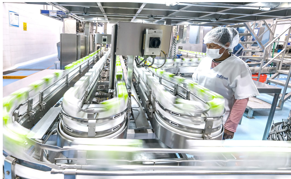
Gettel iniciará operaciones en marzo de 2025 y se ubicará en el Centro Logístico de Jalisco.

Gettel iniciará operaciones en marzo de 2025 y se ubicará en el Centro Logístico de Jalisco. En una segunda etapa, tras su arranque, facilitará la generación de hasta 400 empleos para la economía local.