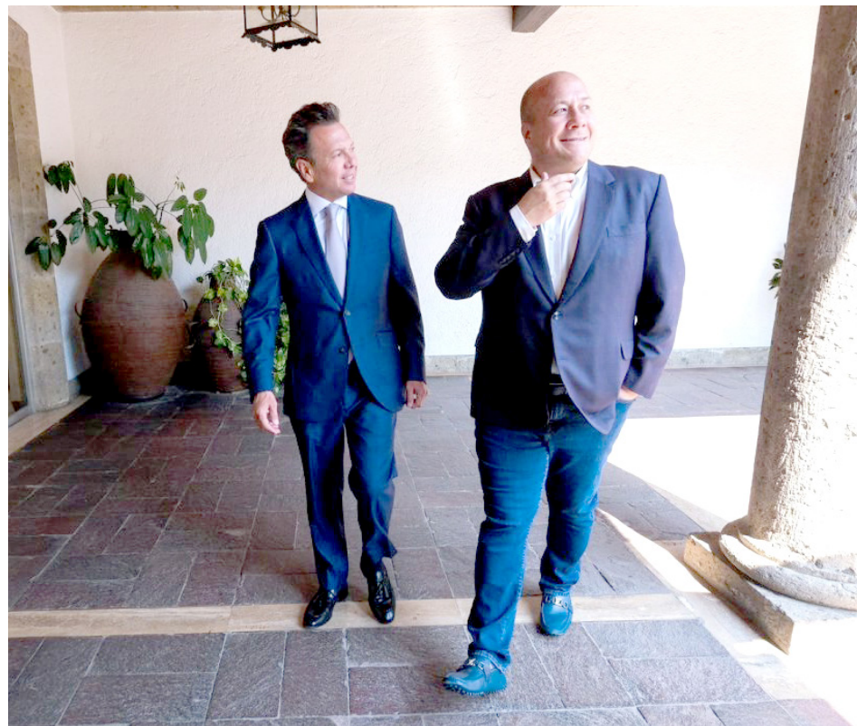
El mandatario electo, Pablo Lemus, aseguró que su gobierno será de coordinación.

Pablo Lemus fue recibido por el gobernador Enrique Alfaro en el que será su nuevo hogar: Casa Jalisco; el mandatario reconoció el liderazgo del emecista