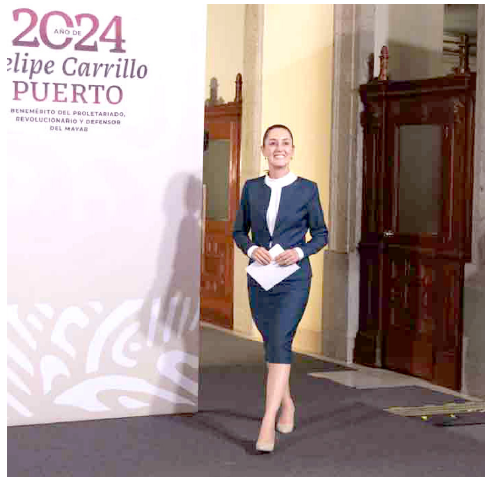
Mantener los programas sociales y la reforma al Poder Judicial, fueron algunos temas planteados.

Morena. Finalizó su discurso al hacer hincapié en que, “hoy se llevó a cabo la primera reunión de muchas más con Andrés Manuel López