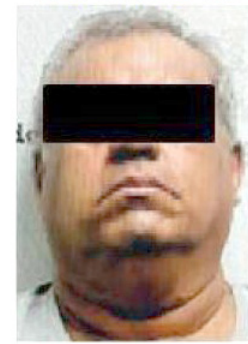
Los cinco detenidos son señalados de tomar diversas joyas valuadas en tres millones de pesos.