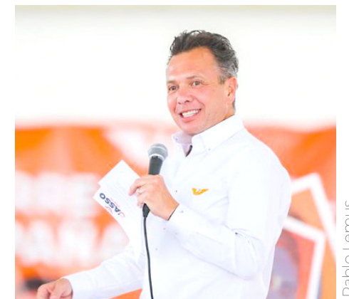
Morena y sus aliados consiguieron 19 de las 38 curules disponibles.

El Partido Verde Ecologista fue de los que estuvieron más inconformes, pues se les “quitó” un diputado, ya que en lugar de darles tres escaños, solo obtuvieron dos.