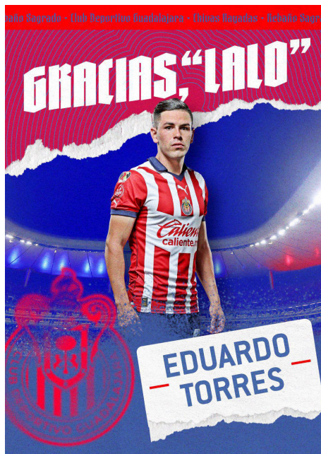
El Rebaño Sagrado continúa con la labor de delinear su plantel.