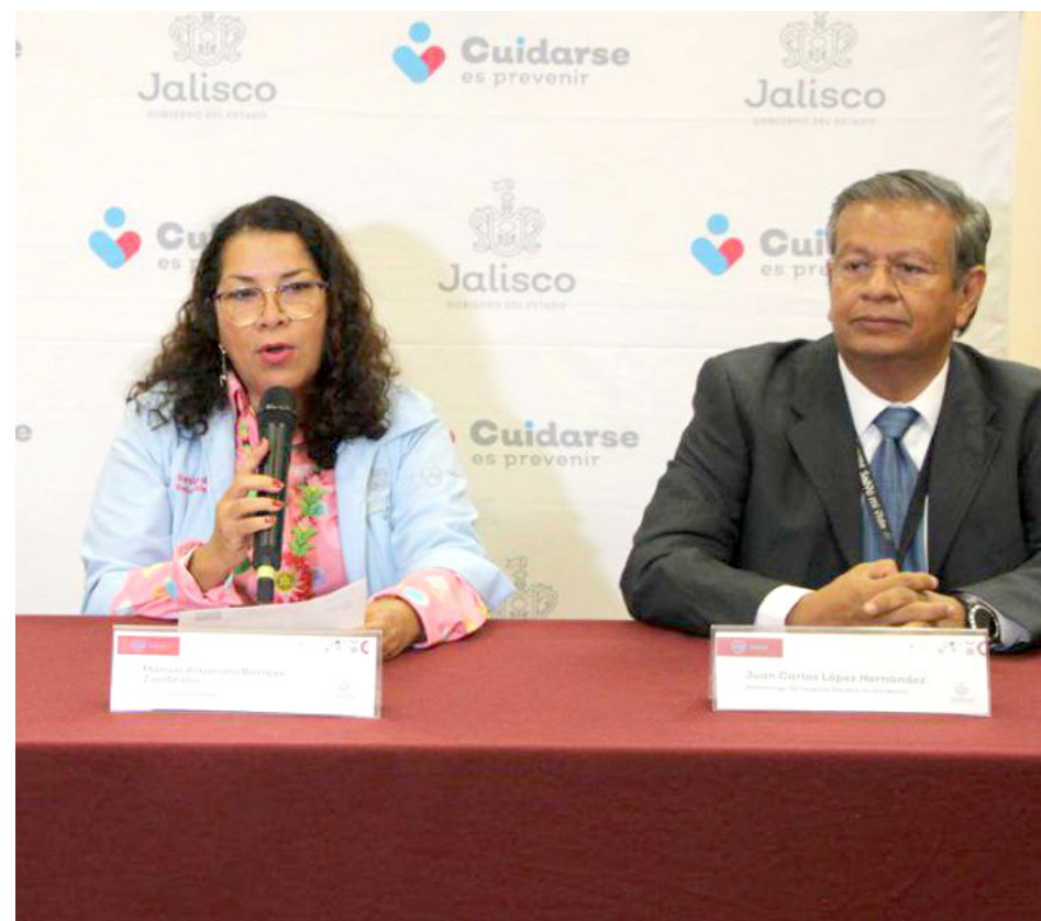
En rueda de prensa explicaron que es importante acabar con los mitos en torno a la donación.