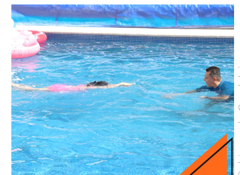
El alcalde entregó una alberca donde se impartirán semanalmente clases.

“Lo que significa el éxito para esta obra no solamente es ver unas instalaciones bonitas o una alberca bonita, nada de esto hubiera sido posible sin el trabajo que hacen los que colaboran en el DIF Guadalajara”, afirmó.