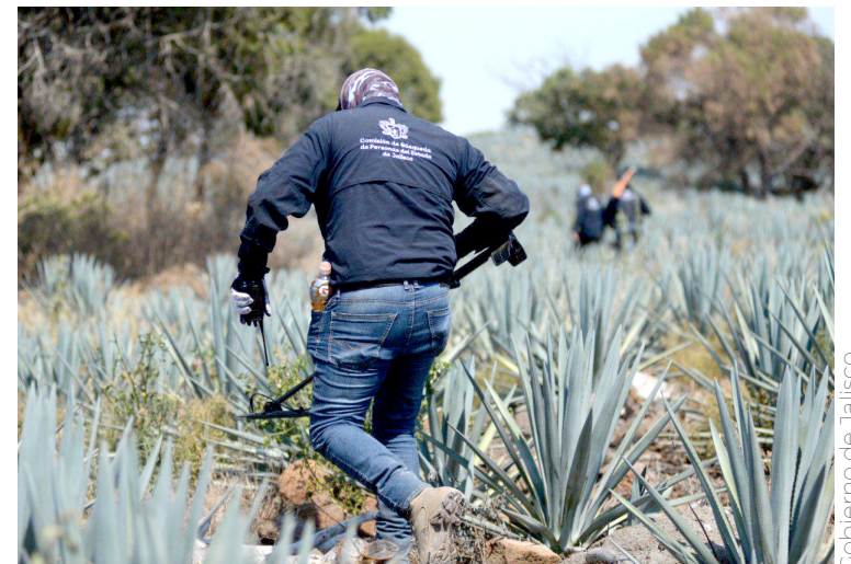
Personal de la Comisión de Búsqueda de Personas realizó el operativo.

La Comisión de Búsqueda de Personas del Estado de Jalisco trabaja coordinadamente con las autoridades de los tres niveles de gobierno, para buscar a quienes nos faltan, pone a disposición de la ciudadanía la línea telefónica 3315145422 las 24 horas del día, los 365 días del año.