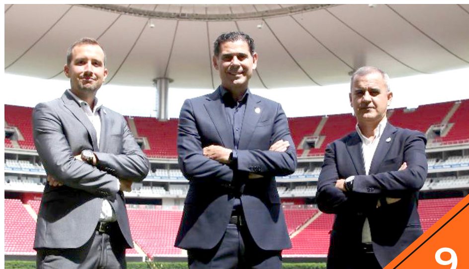
Presentaron al nuevo Comité Técnico Deportivo.