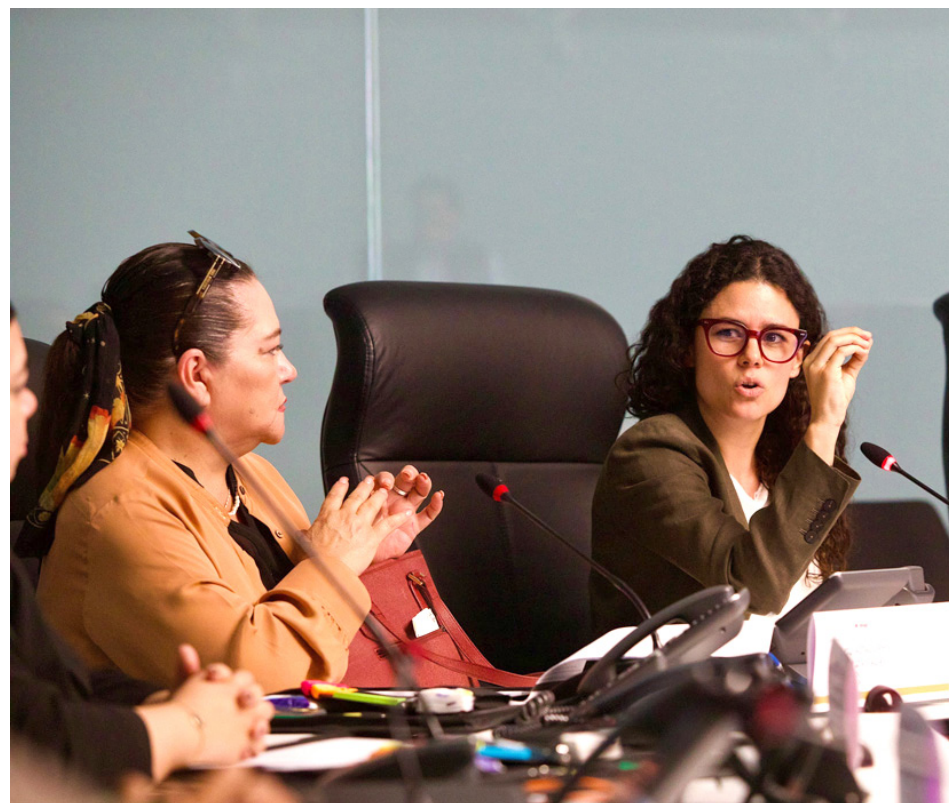
Secretaría de Gobernación

“Esto lo hemos hecho con pleno convencimiento de que no se trata de una responsabilidad exclusiva ni del INE, ni del Ejecutivo federal o de las fuerzas de seguridad, sino de todas