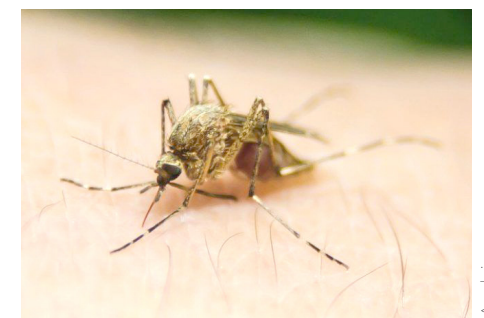
En Jalisco ya son 168 casos.

El listado lo encabeza Puerto Vallarta con 81, le sigue Cuautitlán de García Barragán con 19, Casimiro Castillo 11, Guadalajara y Zapotitlán de Badillo 8, Cabo Corrientes y Cihuatlán con 6. El resto se encuentran en los municipios de Toluca, El Limón, Tonila Talpa de Allende, Villa Purificación, Autlán de Navarro, Pihuamo, Tomatlán, La Huerta, Tuxpan, El Grullo, La Barca, Tlajomulco de Zúñiga y Tlaquepaque.