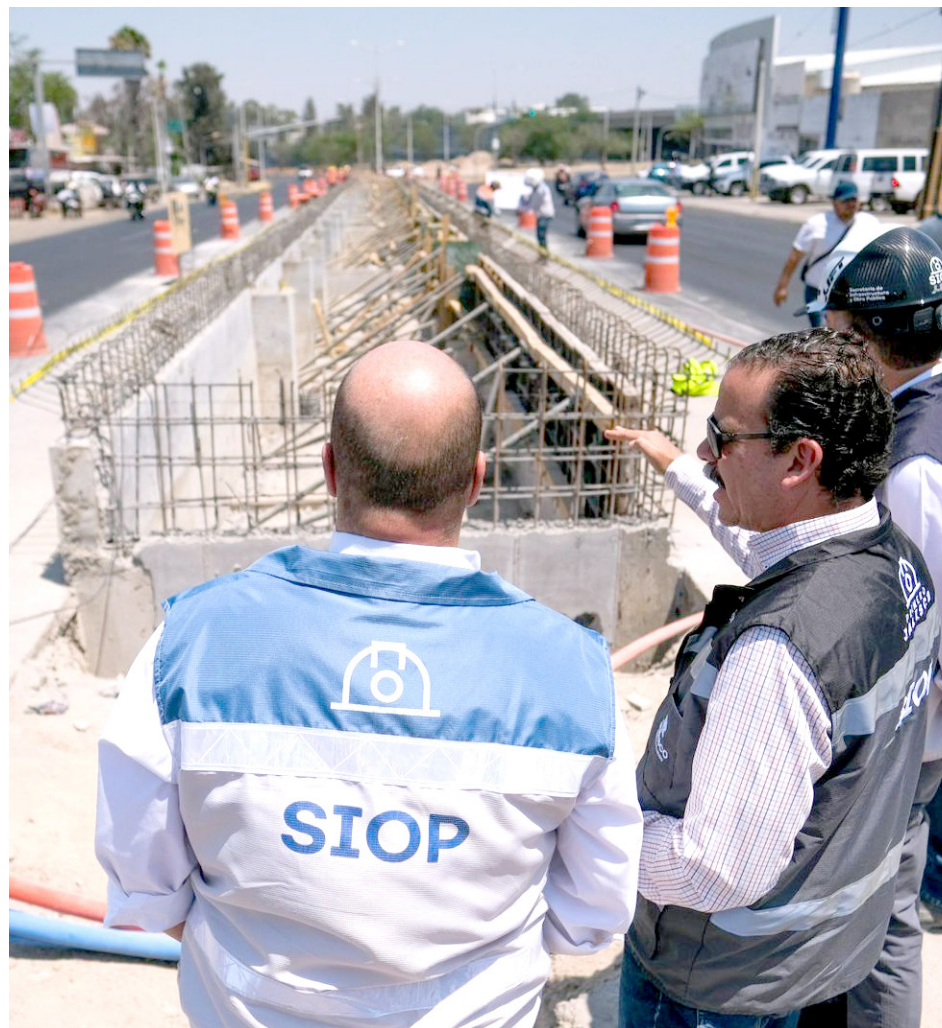
Las estaciones Colonia Jalisco y Los Conejos, avanzan con un 25 por ciento de obra.

La estación Jalisco 200 años tiene un 15 por ciento y a la par se realizan obras complementarias como la ampliación