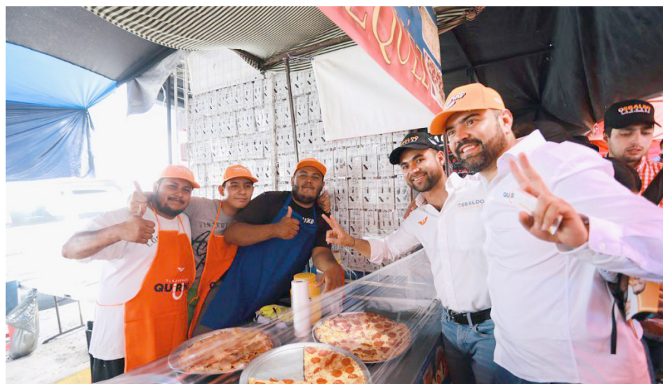
El candidato visitó la zona Valle del municipio.