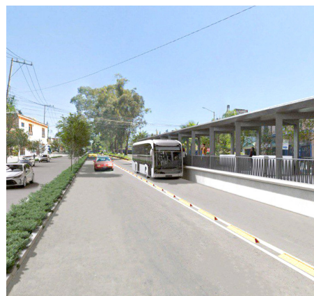
Las estaciones Colonia Jalisco y Los Conejos, avanzan con un 25 por ciento de obra.

del puente vehicular con 14 metros de cada lado, laterales, colector pluvial, puente peatonal y rehabilitación de la calle Colima, con un monto de inversión