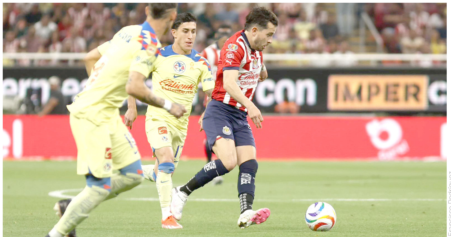
Chivas tuvo otro torneo que terminó en fracaso.

Finalmente, el Rebaño Sagrado podría sufrir la baja de José Juan Macías. Es un caso polémico, pues el técnico lo cepilló a pesar de ser un atacante con calidad y con gol. Arrancó el torneo como titular y luego perdió el puesto. Fuentes al interior del equipo aseguran que no hubo comunicación entre el entrenador y el jugador para hablar sobre su suplencia.