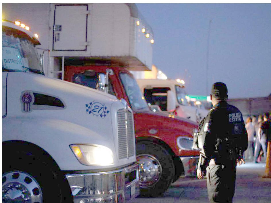
Llegaron desde el estado de México en un convoy de veinte camiones de carga.