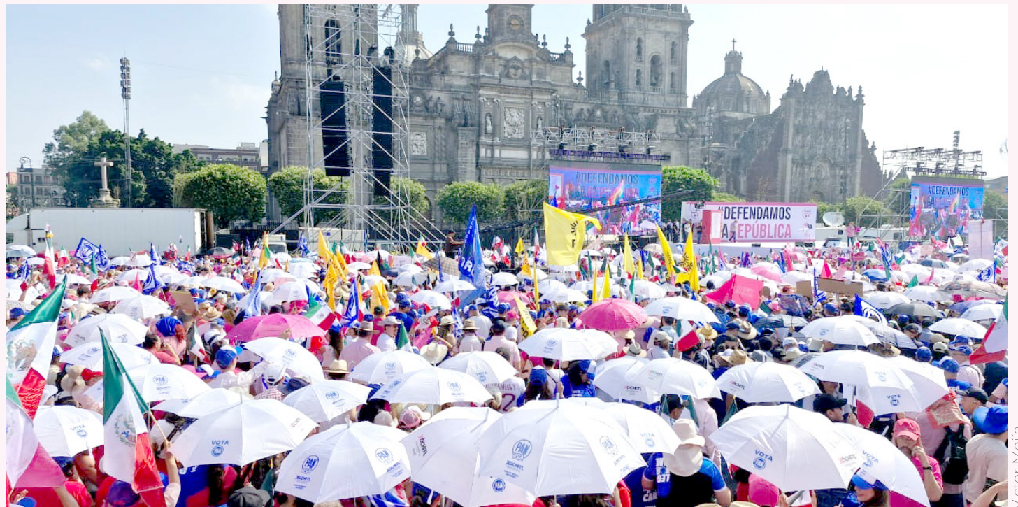
Ni el fuerte sol que pegaba en el Centro de la capital mexicana, menguó las ganas de los asistentes.

Con la bandera en todo lo alto la Marea Rosa se apoderó del centro capitalino; Xóchitl Gálvez, agradeció a la sociedad civil el apoyo, y proclamó: ¡Antes de partido tengo patria!