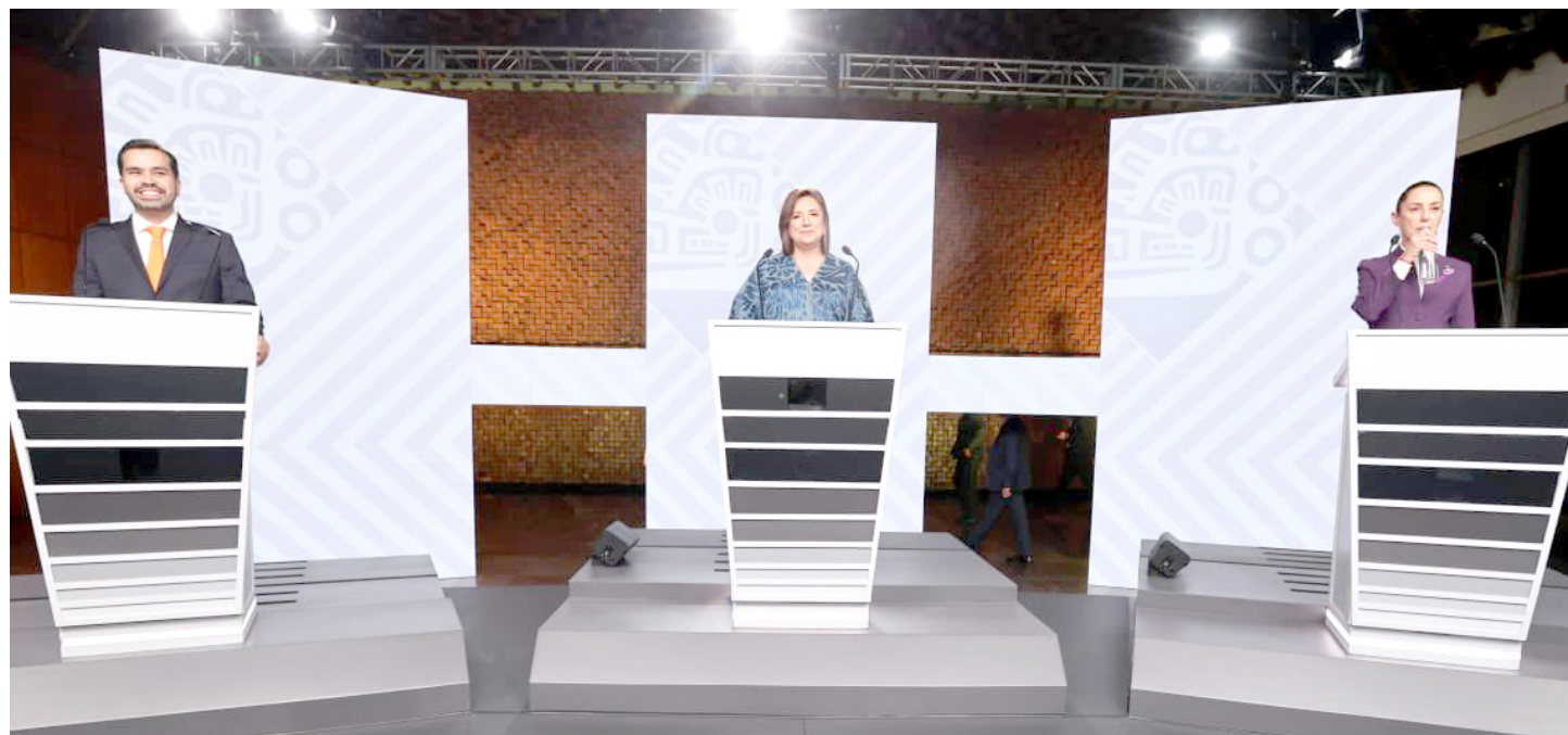
De nueva cuenta fueron las candidatas las protagonistas de las acusaciones mutuas.

En su oportunidad, Jorge Máynez señaló que los únicos que no tienen financiamiento del crimen organizado y por eso tiene la autonomía de hablar con libertad son precisamente los integrantes de Movimiento Ciudadano. “Tengo más Independencia más