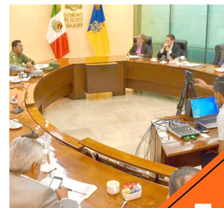
Los aspirantes se consideran en riesgo.

Durante la sesión de hoy también se dio cuenta de la distribución y custodia del material electoral que ya ha comenzado a llegar a Jalisco, y se refrendó la coordinación plena que existe para llevar a cabo la logística que se requiere.