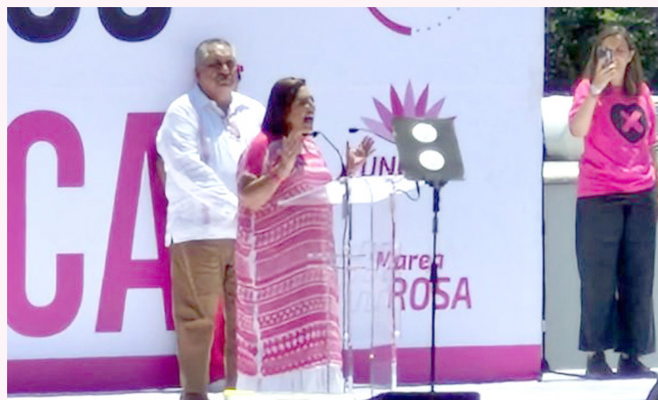
Simpatizantes del PRI, PAN y PRD se unieron al grito de “fuera Morena”.

República, antes que partido tenemos democracia, antes que partido tenemos México, México es primero”, recalzó.