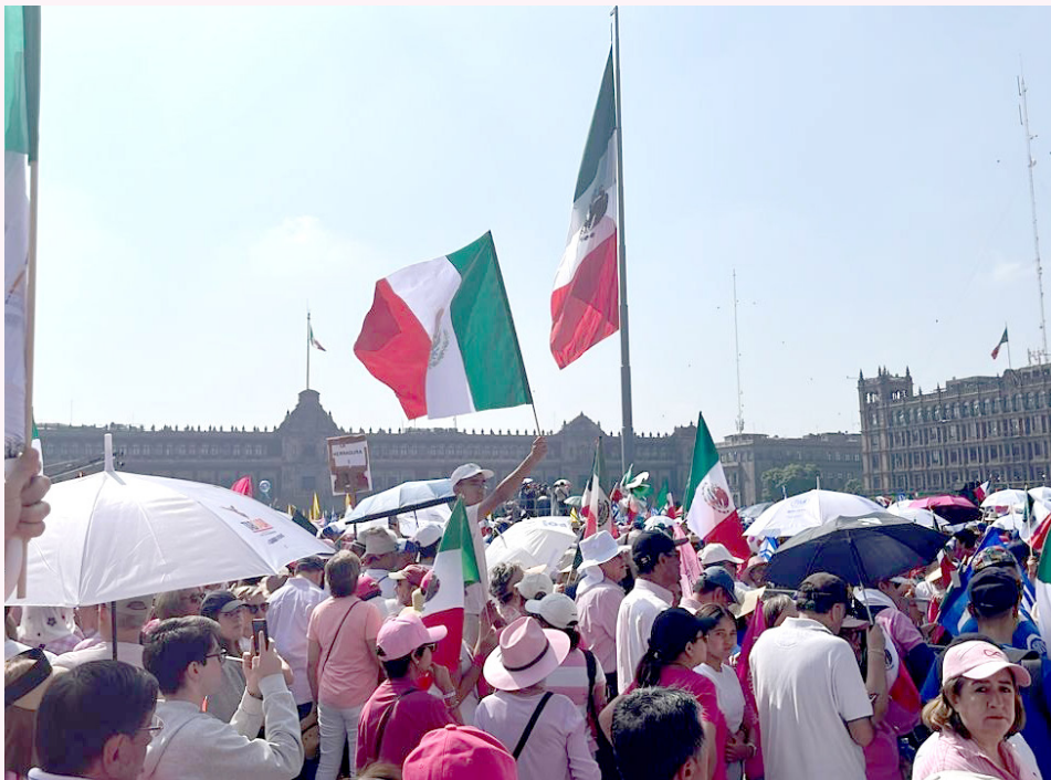
La abanderada panista manifestó que ha recorrido el país.

“ Antes que partido tengo Patria, antes que partido tenemos República, antes que partido tenemos democracia, antes que partido tenemos México, México es primero ”