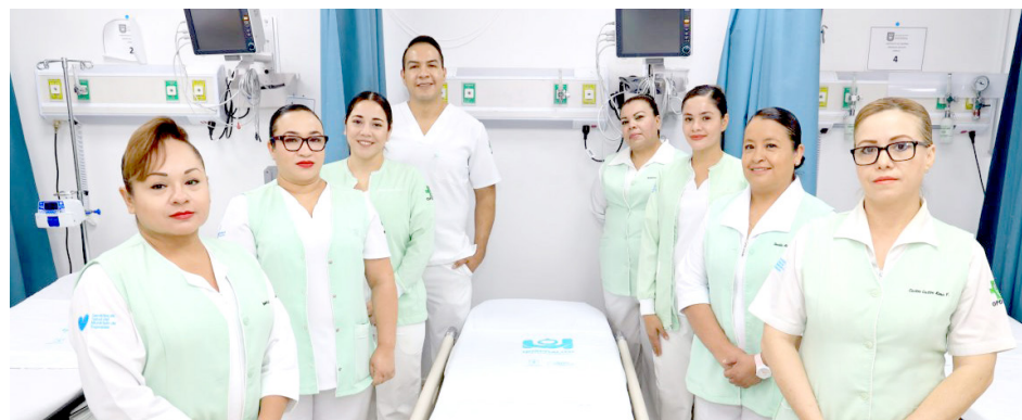
El evento de salud se realizará el 23 y 24 de mayo.

Mediante un comunicado se informó que la sede del evento será el auditorio