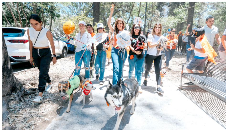
Anunció la creación del Escuadrón de Protección y Atención a Nuestros Animales Locales,

un trato digno y también los reconoce como merecedores de política pública para su bienestar”, destacó.