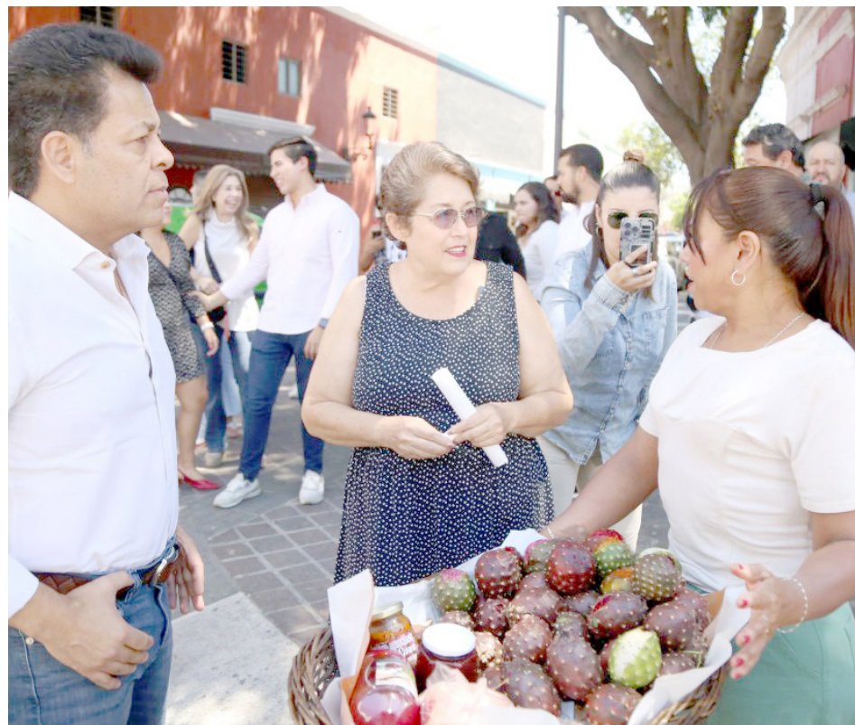
Francisco Ramírez Salcido, alcalde interino de Guadalajara, visitó la zona

Este rincón tapatío es uno de los favoritos, pero en esta temporada resulta un sitio donde se reúne el color y el sabor de frutas de temporada