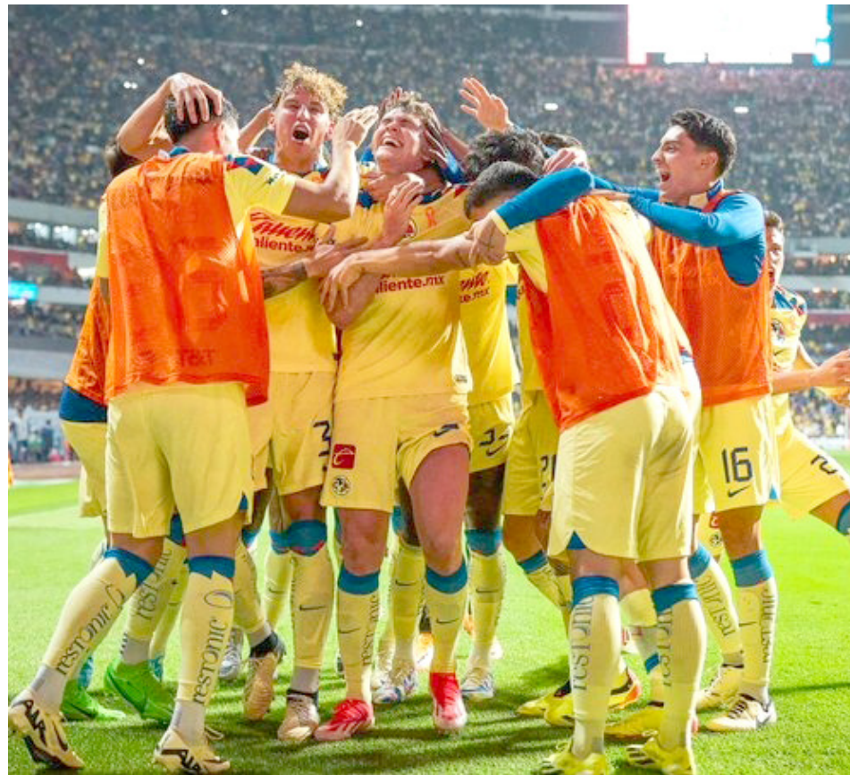
El Rebaño Sagrado nunca logró apretar con suficiente fuerza al rival.