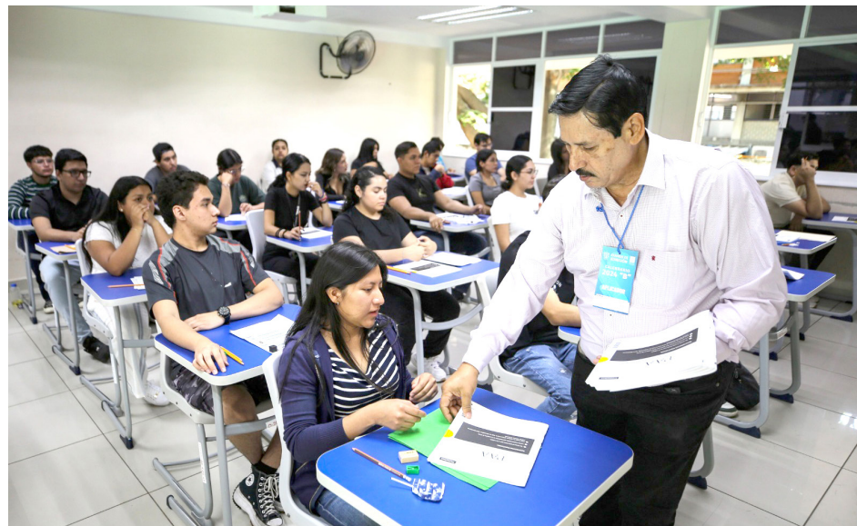
Fue una jornada que resultó satisfactoria y transcurrió de manera regular.

En esta primera de tres jornadas de aplicación de exámenes de admisión, se tuvo la presencia de 96.07 por ciento de las 53 mil 981 aspirantes convocados