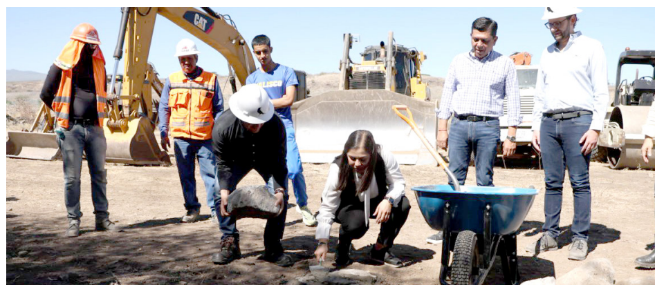
Se convertirá en el principal centro de entrenamiento físico y recreación de la región.

El Distrito de la Niñez, que abarcará más de 15 mil metros cuadrados, se convertirá en el principal centro de entrenamiento