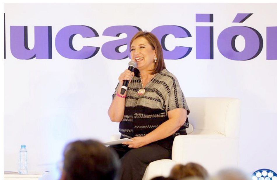
Xóchitl Gálvez considera necesario recuperar la formación y la enseñanza.

En respuesta, la ingeniera considera necesario recuperar la formación y la enseñanza desde una visión de reconocer y promover, y dejar la idea