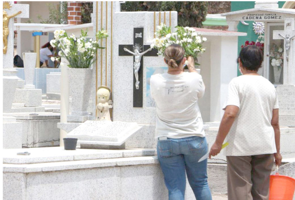
Los cementerios de Tlajomulco estarán abiertos de las 8 a 18 horas.

Oficiales de Protección Civil y Bomberos realizaron la revisión de las condiciones de seguridad que guardan los cementerios. Realizaron el acordonamiento de 194 criptas que representaban algún riesgo, además realizaron el retiro de un enjambre de abejas.