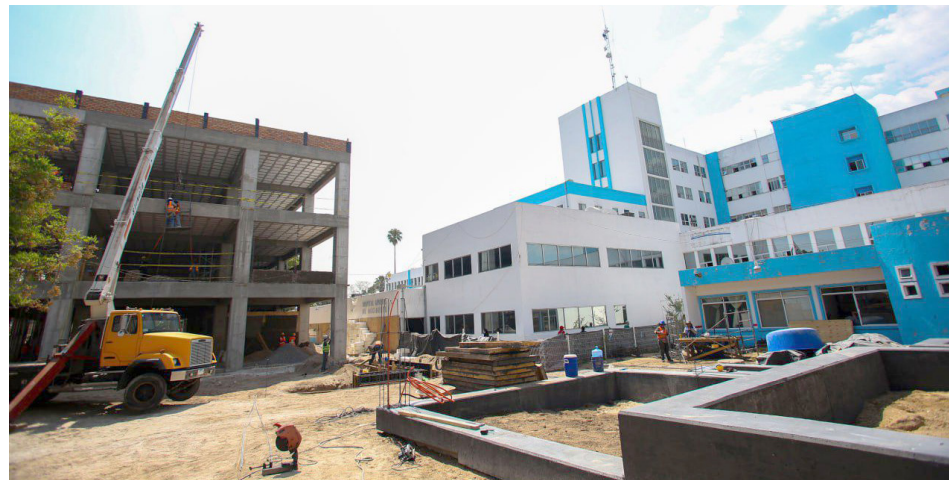
La estructura de concreto está completada al 90 por ciento.

También se ha concluido la renovación de los módulos de baños