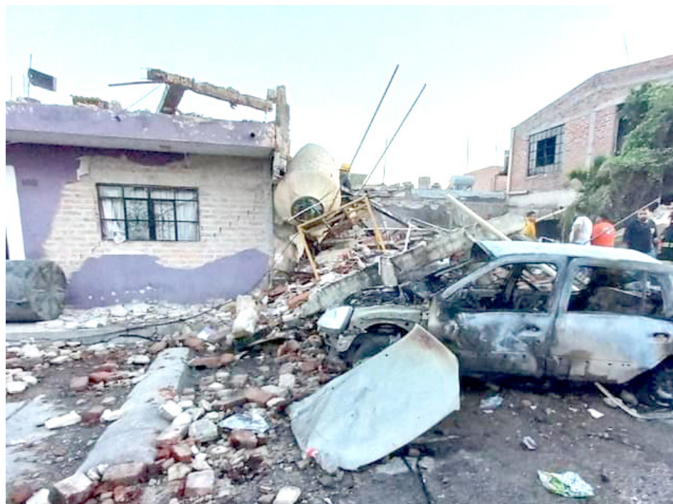
Buscan evitar que ocurra otro accidente como el de La Barca.

En la supervisión de inmuebles los que no contaban con medidas de seguridad cerraron y otros 7 recibieron apercibimientos