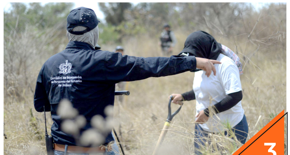
El operativo se llevó a cabo con el uso de herramienta tecnológica.

La Comisión de Búsqueda de Personas del Estado de Jalisco pone a disposición de los ciudadano el teléfono 3315145422 las 24 horas y durante los 365 días del año.