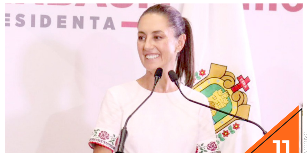
Claudia estuvo de gira en Veracruz.

Claudia Sheinbaum añadió que otro de los proyectos que se contemplan es el tren de pasajeros en su ruta México-Puebla-Veracruz, refrendando así su compromiso para la realización de éstas obras para el desarrollo económico y el desarrollo social de la zona.