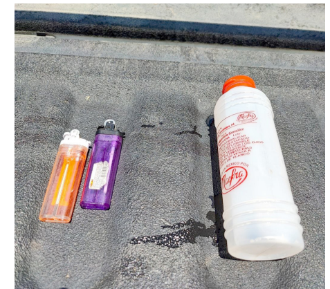
Comisaría de Zapopan

Una de las acciones más importantes de esta etapa de intervención es la renovación de las instalaciones y equipos principales que se encontraban en pésimo estado y no cumplían con las normas. Se están renovando los equipos de la subestación eléctrica y de la planta de emergencia, así como los equipos de compresor y bomba de vacío del sistema principal de gases medicinales. También se están renovando los chillers para los sistemas de aire acondicionado, las calderas, los equipos hidroneumáticos y la cisterna general de 560 m 3 .