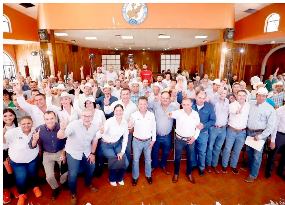
El candidato resaltó la importancia del sector agrícola de Jalisco

Uno de los puntos destacados, es el aumento del Fideicomiso de apoyo a la producción de maíz, que pasará de 120 a 200 millones de pesos para el próximo año