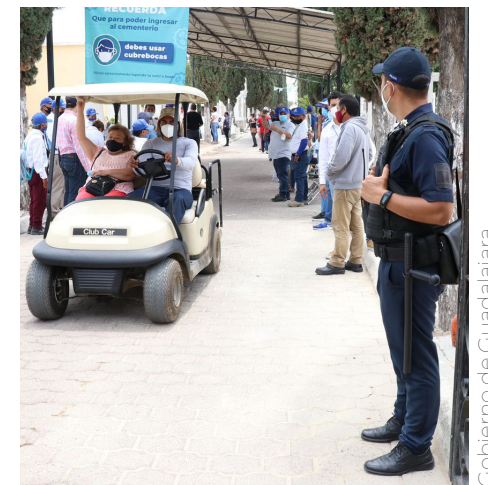
Desplegarán a más de 650 trabajadores del Gobierno.

El Gobierno de Tlajomulco exhorta a los ciudadanos para que respeten las zonas acordonadas, además de que mantengan vigilados a los niños y a las personas adultas para evitar incidentes.