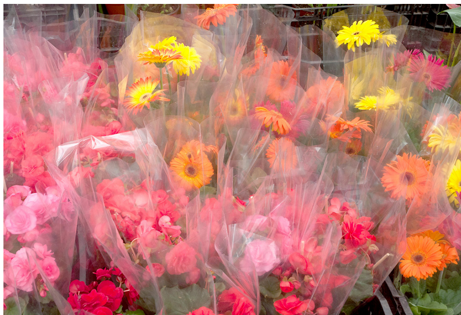
Las flores siguen siendo el regalo favorito para las madres este 10 de mayo.

De acuerdo con una encuesta realizada sobre los hábitos del consumo del 10 de mayo en la zona metropolitana de Guadalajara, el 74 por ciento confirmó que sí festejará el Día de las madres, el 19 por ciento acudirá a un restaurante, el 14 por ciento comprará flores, el 13