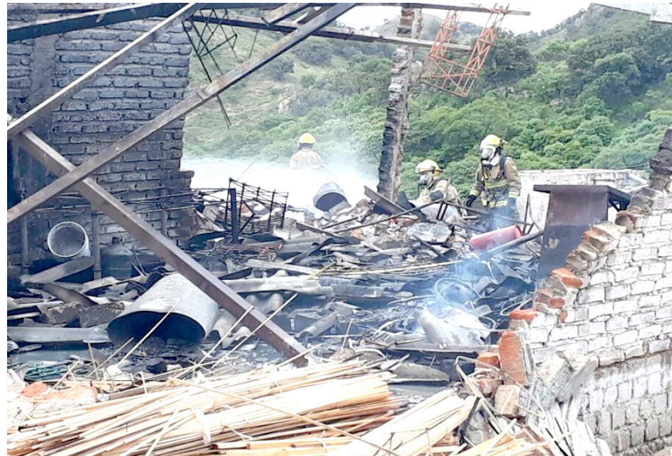
Los operativos darían inicio de manera inmediata en todo el Estado.

Para llevar a cabo estos operativos, habrá coordinación conforme al ámbito de competencia entre la 15/a y 41/a Zonas Militares, el Gobierno del