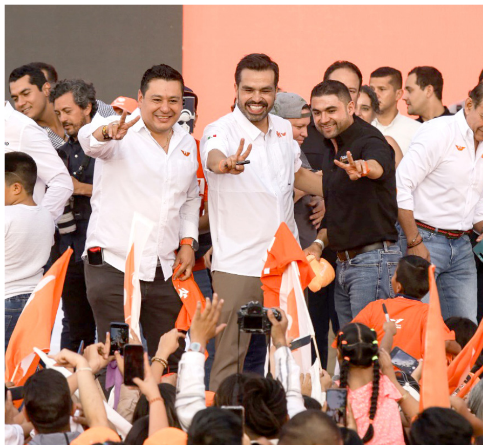
El aspirante visitó Tlajomulco y estuvo acompañado de los candidatos naranjas.

El aspirante lamentó que se invierta en proyectos absurdos y obsoletos de otros Estados, pero no en las obras estratégicas para Jalisco