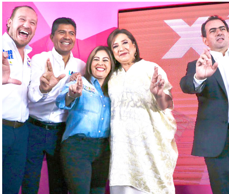
Xóchitl Gálvez señaló que no dejará solos a los Estados.

“No se puede polarizar políticamente y al mismo tiempo buscar colaboración y trabajo conjunto