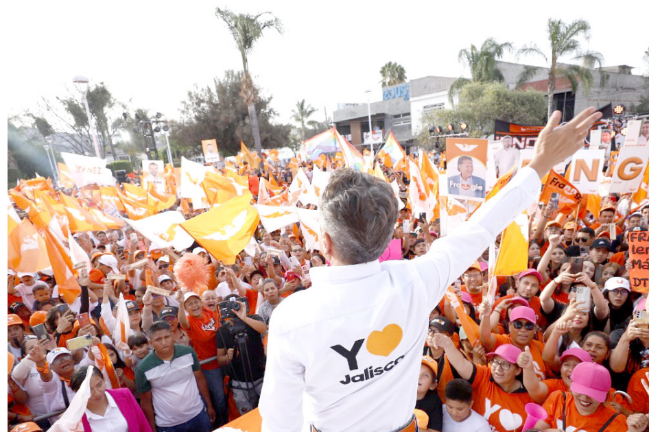
Pablo Lemus Navarro, candidato a la gubernatura de Jalisco por Movimiento Ciudadano.

Antes de anunciar sus compromisos, Lemus Navarro recordó que uno de los logros en la administración en Zapopan y Guadalajara, fue promover su conversión en municipios amigables con las personas mayores, obteniendo un certificado internacional.