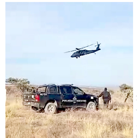
Los elementos efectuaban un recorrido de vigilancia.

inicio de manera inmediata en todo el Estado.