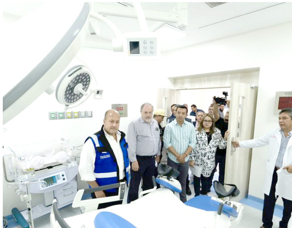
El nuevo hospital crece un 70%, en promedio, la capacidad de atención y servicios en general.

“Siempre me llena de orgullo poder regresar a entregar un compromiso cumplido, como el día de hoy lo hacemos aquí en Sayula, un municipio por el que tengo un gran cariño, presidente municipal, porque de aquí es parte de mi familia y habíamos quedado que íbamos a entregar este hospital totalmente nuevo, después de que el hospital de aquí de Sayula tenía ya 80 años de vida. Hoy estamos entregando una obra de 130 millones de pesos de inversión en infraestructura pero ya con el equipamiento, todo lo que estamos invirtiendo aquí son 170 millones de pesos que se van a poner al servicio del pueblo de Sayula a partir del día de mañana, hoy venimos hacer la supervisión final, quedó verdaderamente espectacular, es de verdad una obra que se hizo a conciencia y, qué orgullo da poder hoy estar con todo el personal que va a estar al pendiente de este gran hospital”, mencionó el Gobernador.