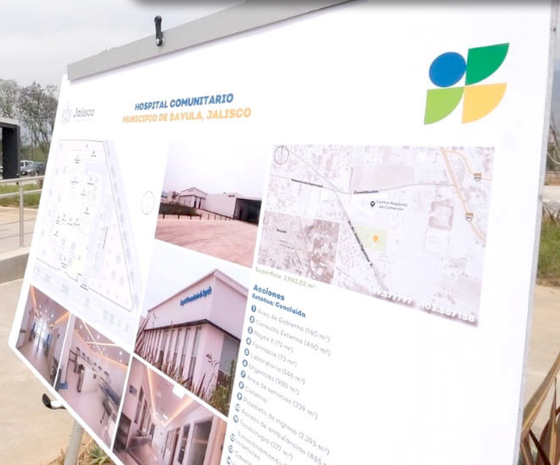
Gobierno de Jalisco