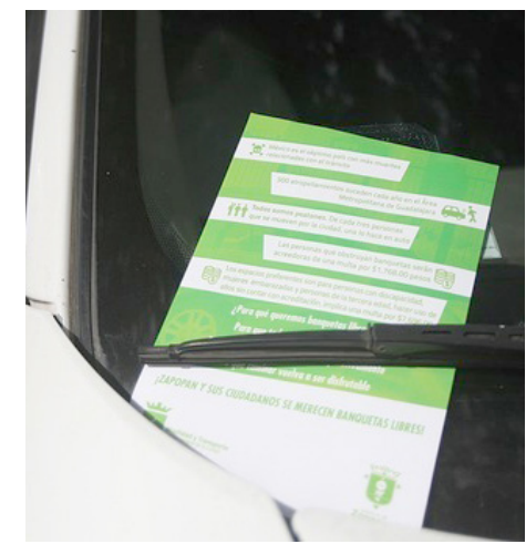
Las personas podrán acceder a descuentos tomando el curso EducaVial.

Las multas que aplican los agentes de movilidad de la Dirección son para vehículos mal estacionados, es decir; invadiendo acceso a cocheras, que no respetan la línea amarilla, cuando el