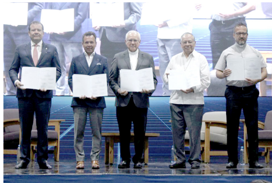
El documento se firmó en las instalaciones de la Univa