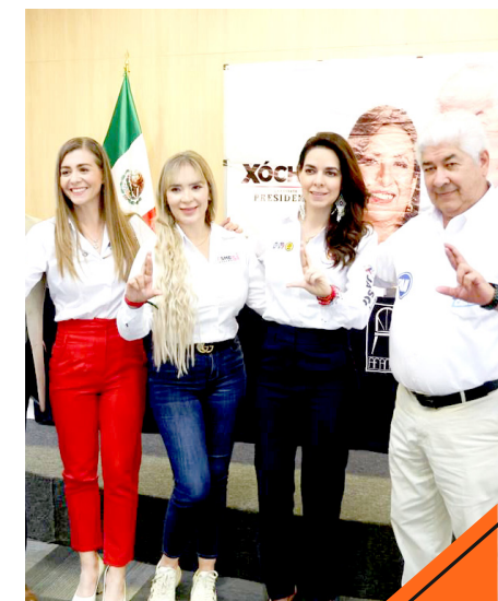
La candidata se reunió con la Asociación de Fabricantes Muebleros en Ocotlán.

Para el tema del saneamiento de agua, refirió que realizará una inversión histórica para el saneamiento de ríos, lagos y presas, así como a las plantas tratadoras de aguas que hay en cada municipio y que muchas de ellas se encuentran en desuso por falta de recursos del municipio.