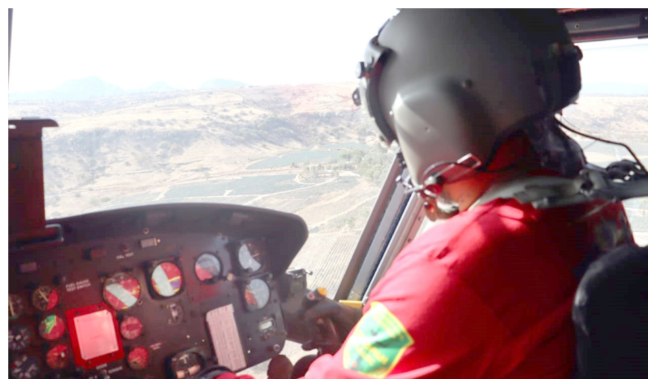
Para esta temporada de estiaje se destinó mayor capacidad de recursos humanos y