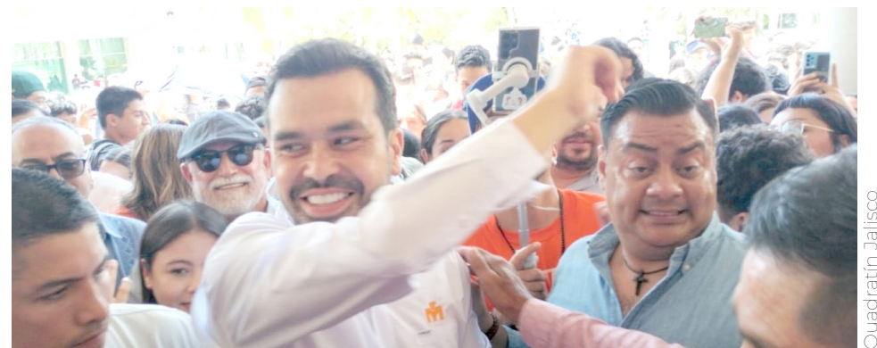
Señaló que MC va en segundo lugar, por encima de Xóchitl Gálvez

El candidato ha sumado simpatías luego de que durante su participación en el segundo debate presidencial se enfocara en presentar sus propuestas dejando de lado los ataques personales