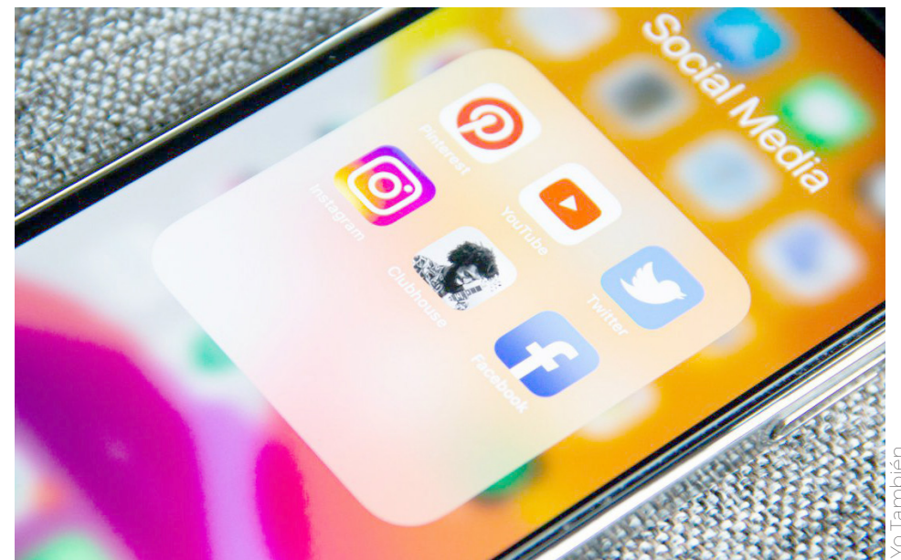
Facebook es el lugar favorito para conocer información relevante.

Esta encuesta levantada entre 254 estudiantes de las 17 carreras del centro