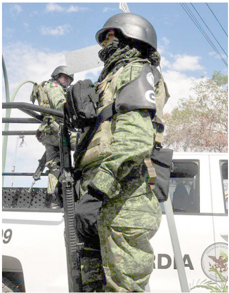
Los candidatos que cumplieron con el protocolo recibirán protección.