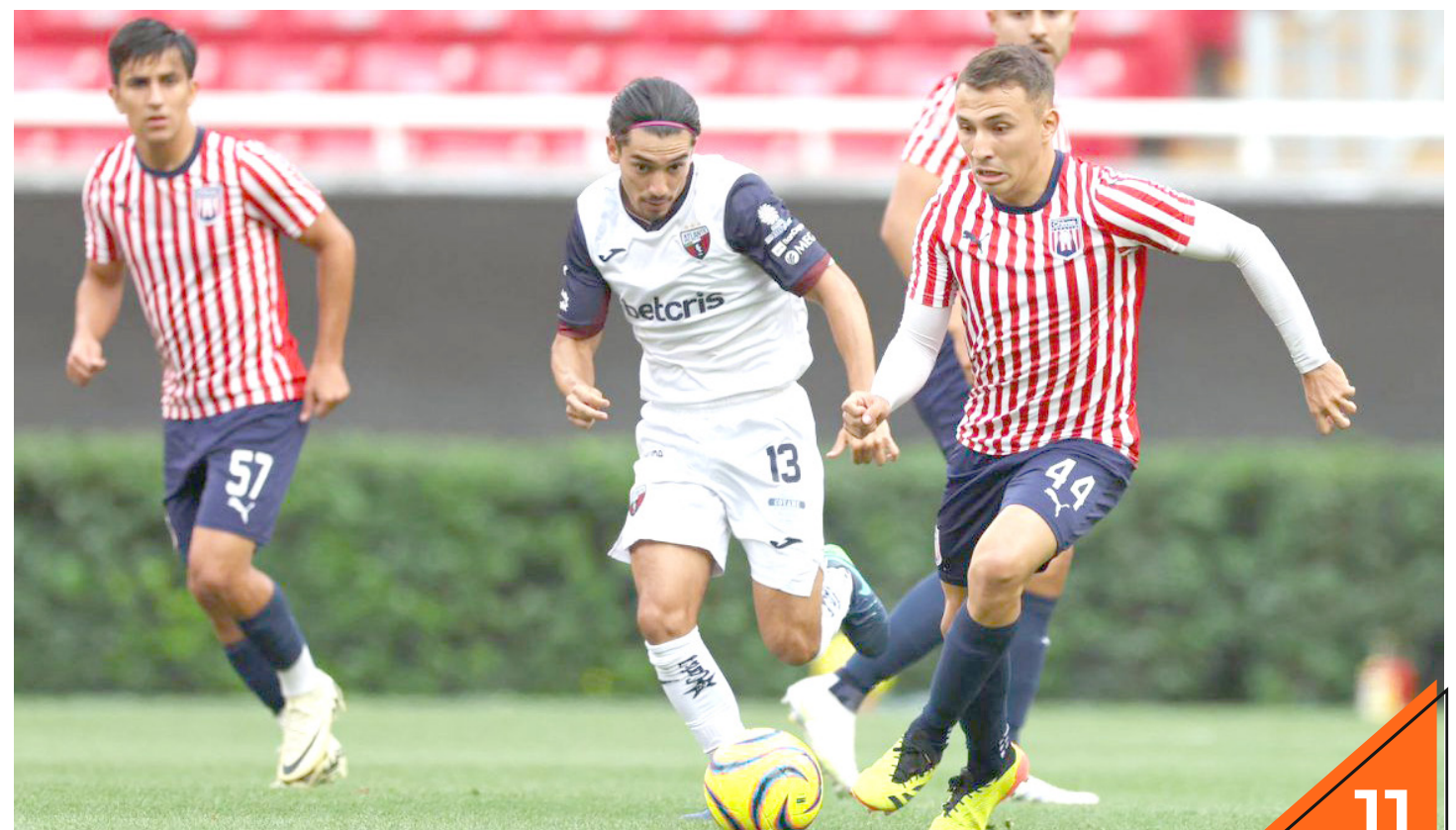
Leones Negros tenían la ventaja en el duelo de ida.

Los Leones Negros son fuertes en casa y buscarán alcanzar esa última instancia que se les ha negado en los últimos torneos.