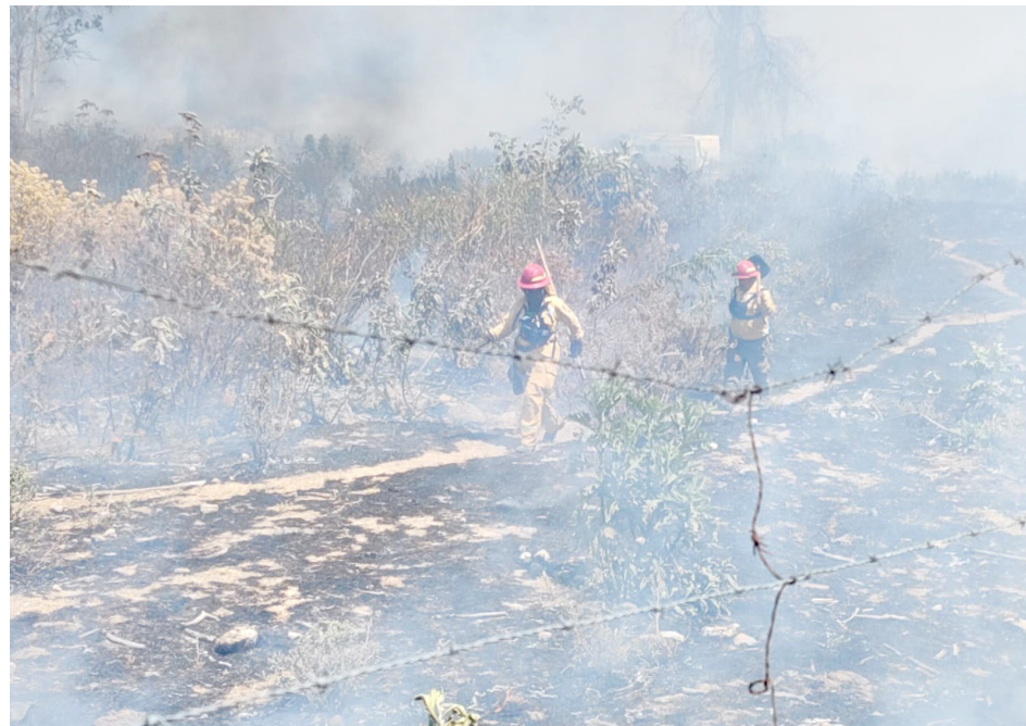
PC y Bomberos Zapopan

En este esfuerzo compartido por disminuir la superficie afectada, pese a la crisis climática que se enfrenta a nivel mundial, agravando la presencia de incendios forestales debido a la sequía extrema que azota al país, así como los fuertes vientos, topografía compleja y cobertura forestal de Jalisco, se coordinan dependencias de los Gobiernos municipales, estatales y federales, así como la sociedad civil organizada.