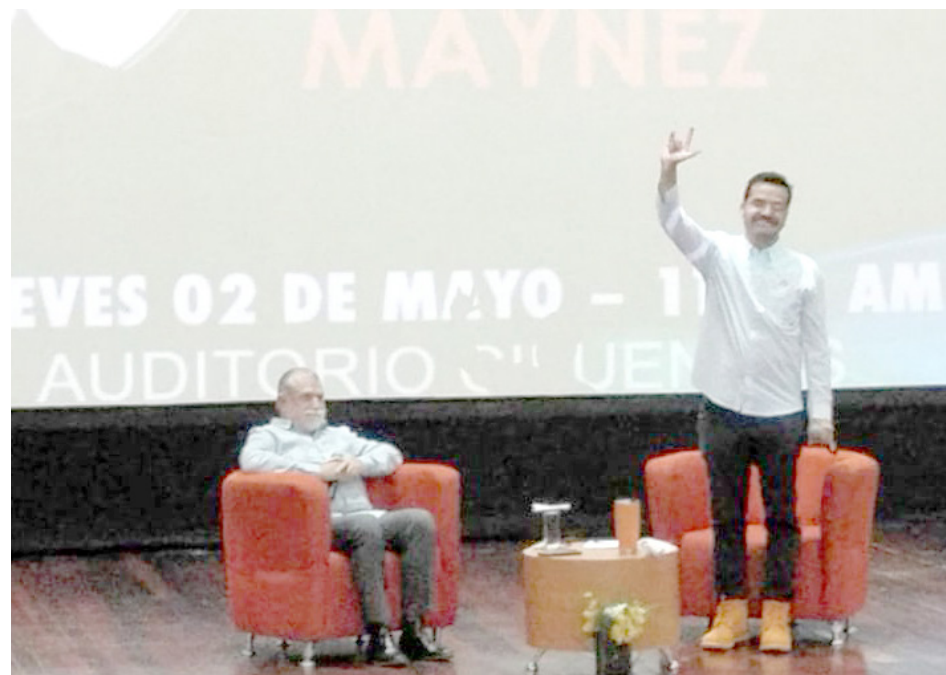
Señaló que los jóvenes deben tener oportunidades antes, durante y después de terminar sus estudios.

“El 80 por ciento de las parejas que abandonan los estudios por tener un hijo siempre caen o recaen en la mujer. Y eso no es normal, no es justo, no se puede seguir tolerando porque además lo que yo he dicho es que partimos del principio de que el machismo nos hace, nos da ventajas a los hombres y eso no es tan evidente, no es tan cierto”, dijo el