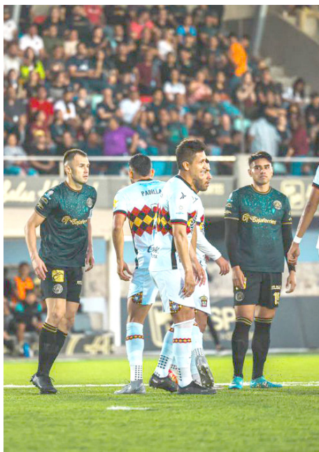
Tapatío cayó 3-0.