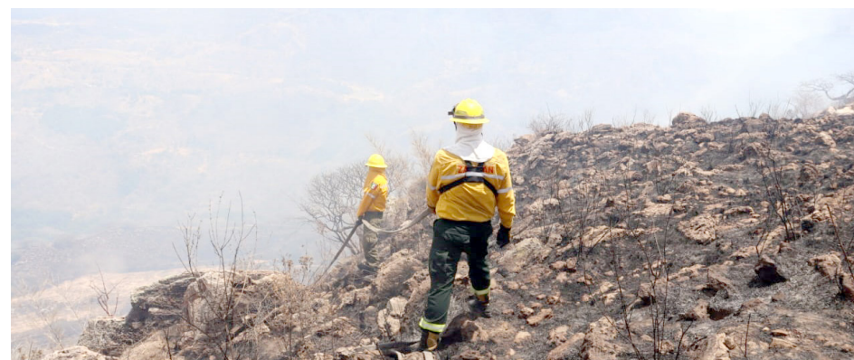
El estado se ubica en el séptimo lugar a nivel nacional en incendios forestales.