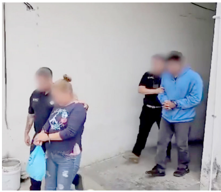
Fiscalía de Jalisco

Al parecer prestaron su cuenta bancaria para recibir diversas cantidades de dinero.