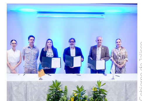
Buscan implementar mejores prácticas de sustentabilidad.

Como parte de este programa, con el convenio de colaboración, Expo Guadalajara y Semadet actualizarán los términos de referencia enmarcados en el PCAV para certificar eventos sustentables.