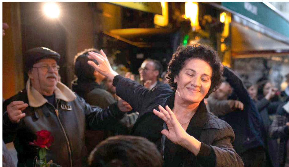
Las películas que participan son de diferentes partes del mundo.