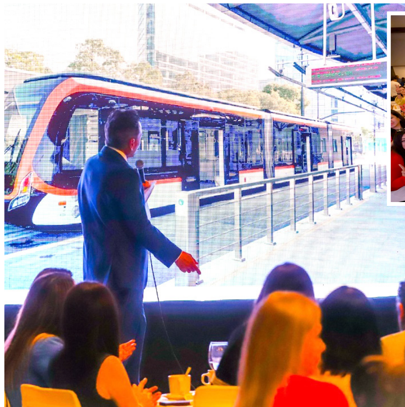
Pablo Lemus presentó sus propuestas y respondió inquietudes.

El candidato subrayó la relevancia de invertir en energía, agua, infraestructura y transporte público para garantizar