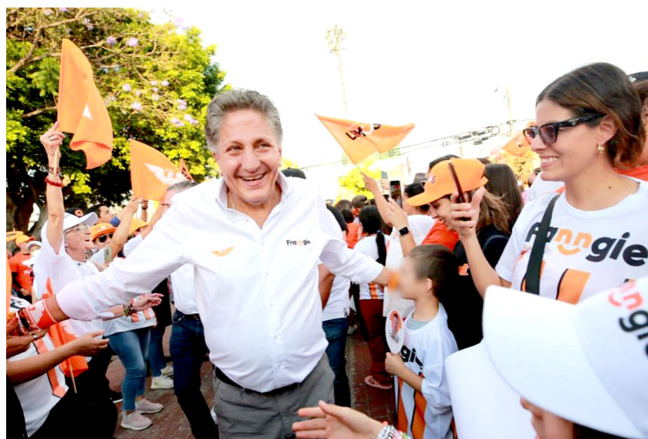
El candidato también prometió regularizar más de 3 mil predios.

“Nosotros vamos a terminar con 5 mil títulos de propiedad dados a las personas, en donde les estamos dando certeza jurídica. En Zapopan tenemos más de 50 mil terrenos que no están regulados. Nadie había volteado a ver esta parte y nosotros le apostamos a darles una certeza jurídica”.