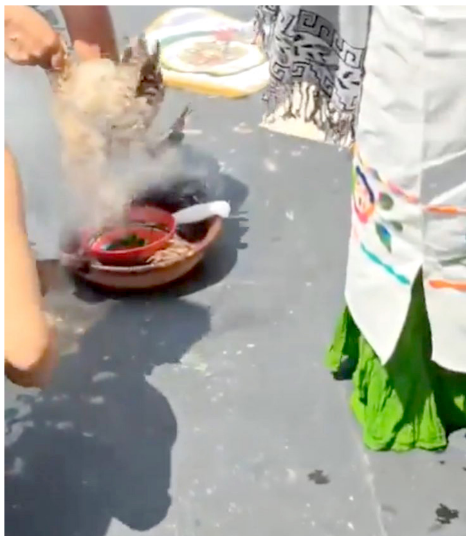
Una gallina fue sacrificada en la sede del Senado de la República.

México, en su artículo 25 prohíbe el uso de animales para celebrar ritos o tradiciones en las que se afecte su bienestar: “Artículo 25. Queda prohibido por cualquier motivo: XIII. El uso de animales en la celebración de ritos y usos tradicionales que puedan afectar el bienestar animal”.