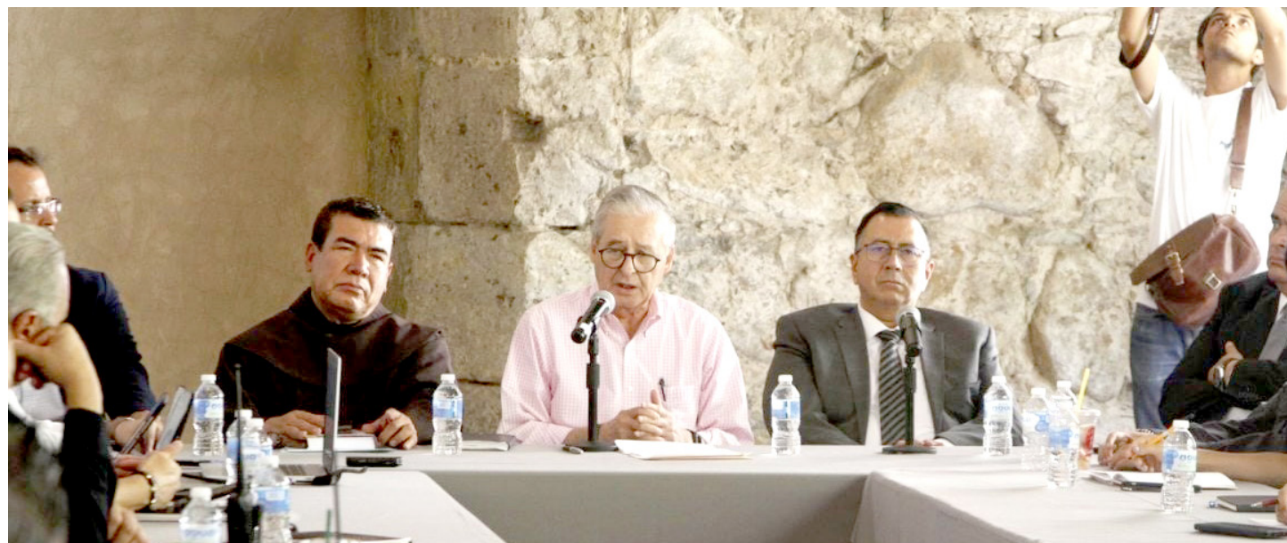
Los recorridos de la Virgen inician el próximo 20 de mayo.

Representantes de los tres órdenes de gobierno y eclesiásticas ya coordinan lo que será el recorrido de la Generala desde mayo hasta octubre