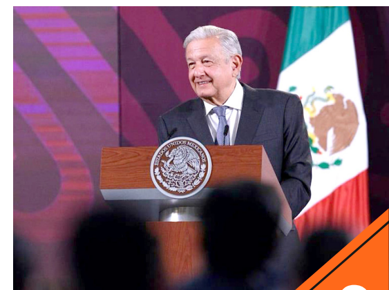
La solicitud de suspensión no fue analizada.

El Pleno consideró que son actos gubernamentales de comunicación social que, por su naturaleza intrínseca, no constituyen la emisión de propaganda gubernamental prohibida por los artículos 41 y 134 de la Constitución Federal.