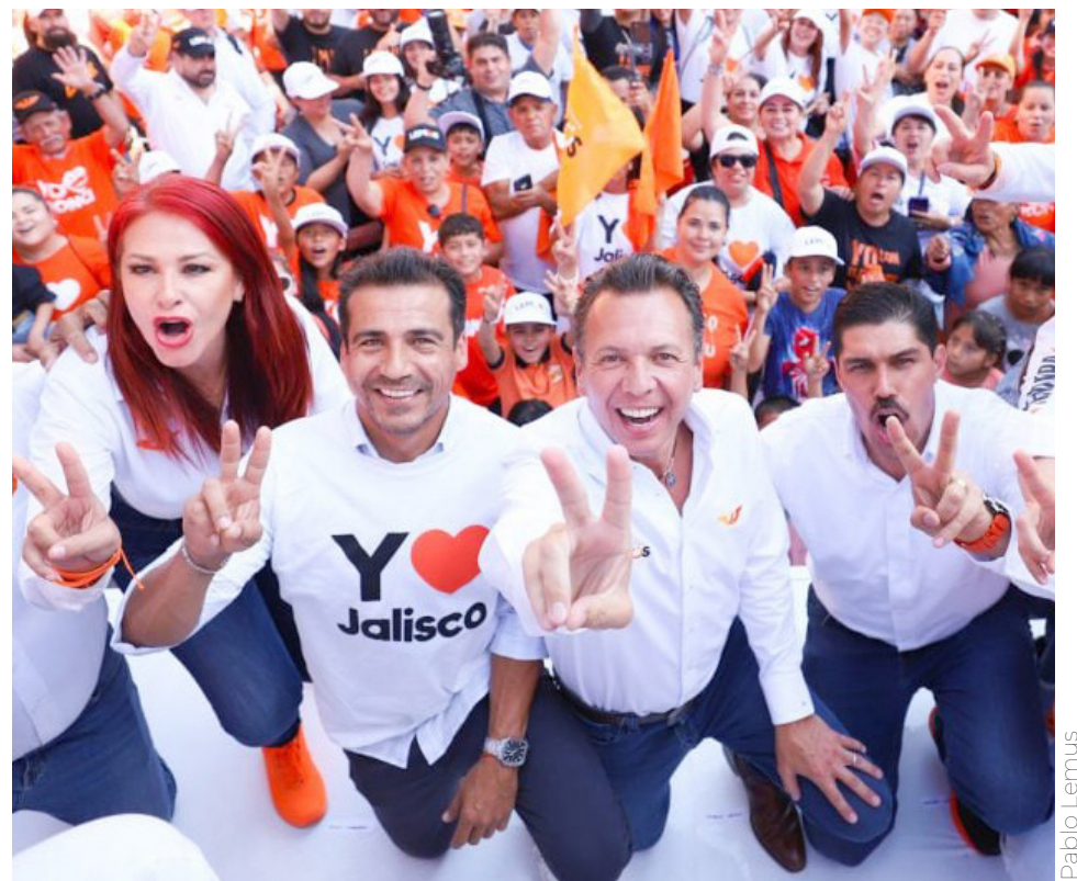
El aspirante emecista convivió con la población y escuchó sus necesidades.

Además, anunció la creación de una Clínica de Hemodiálisis en Poncitlán,