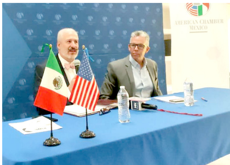
Sus empresas no se van de México, pero esperan tranquilidad.

Entregarán a todos los aspirantes de todos los partidos su plataforma Ruta 2024-2030 con seis ejes y 11 líneas de acción