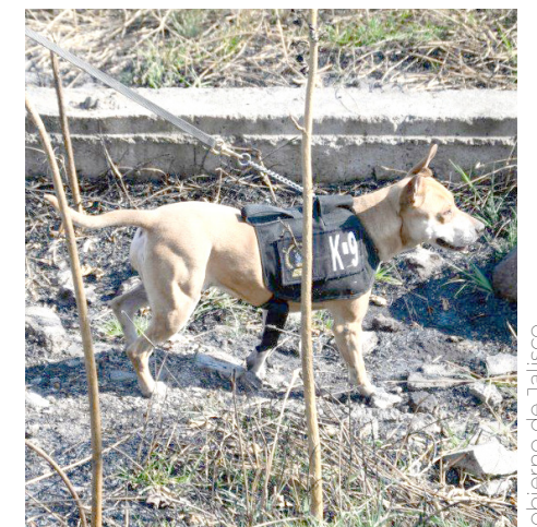
Relizaron trabajo de campo en la colonia Haciendas Santa Fe.

La Comisión de Búsqueda de Personas del Estado de Jalisco, cuenta con la línea telefónica 3315145422 las 24 horas del día, los 365 días del año, para recibir reportes o información que pueda ayudar a dar con el paradero de las personas que han sido reportadas como desaparecidas.