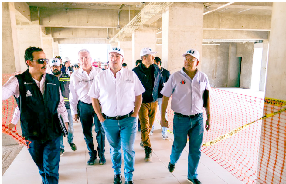
Enrique Alfaro realizó un recorrido por el Instituto Tecnológico Superior de Tepatlán de Morelos.

Enrique Alfaro dio a conocer que se ampliará la matrícula de 15 a 40 mil alumnos, ofertando carreras totalmente vinculadas al sector productivo