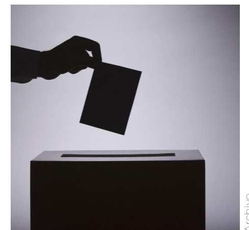
Es el mecanismo que busca dar certidumbre y transparencia.

Se trata de un documento que establece no sólo las directrices a seguir, sino cómo se van a llevar a cabo los simulacros, la selección de muestras de los 12 Conteos Rápidos que ejecutará el INE: tres elecciones federales, ocho gubernaturas y la Jefatura de la Ciudad de México.