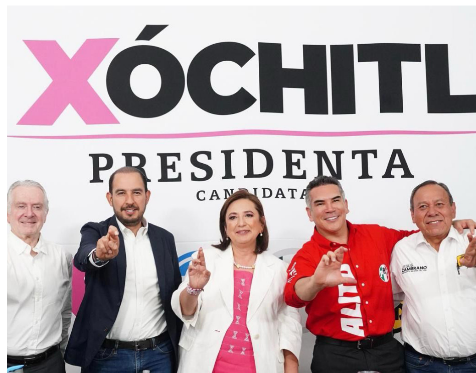
Xóchitl Gálvez señala que tuvo un repunte en las preferencias electorales.

“Todo este ataque que hemos sufrido es porque Morena sabe la verdad. Nos estamos acercando, ustedes lo saben, el campo está abandonado, la gente del campo está