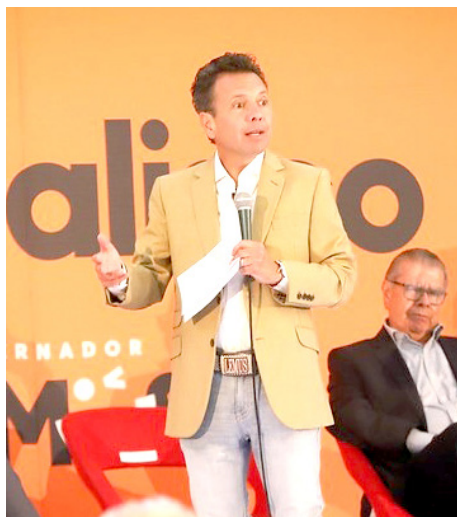
Abordaron temas medioambientales, sociales y de movilidad