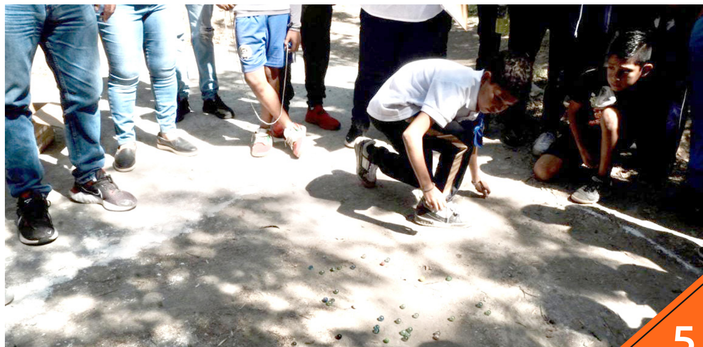
Los estudiantes disfrutaron de juegos que sólo conocían sus padres o abuelos.

La primera convivencia de este tipo se realizó en 2022. En esta edición, participan 160 estudiantes distribuidos en equipos de 10 integrantes, docentes y supervisores de Educación Física, mamás, papás y tutores.