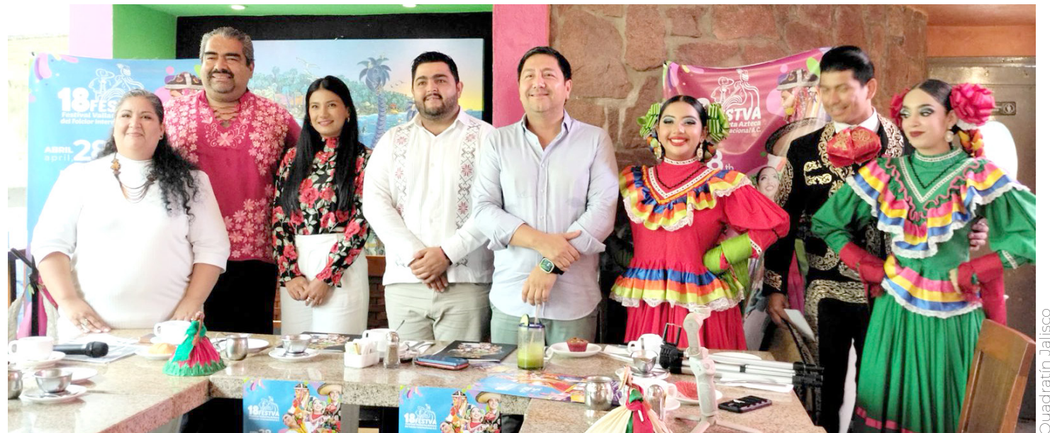
El Instituto Vallartense de la Cultura y la Asociación Civil del Festival dieron detalles.

El evento se llevará a cabo del 28 de abril al 5 de mayo donde buscarán promover este destino de playa