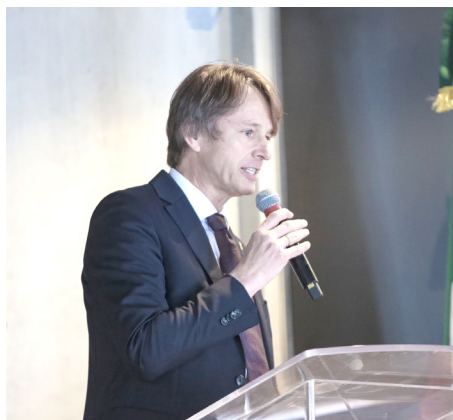
Esta visita es una de las actividades de seguimiento de la misión realizada a Praga.

este Festival al haber eventos programados en cada uno de estos sitios.